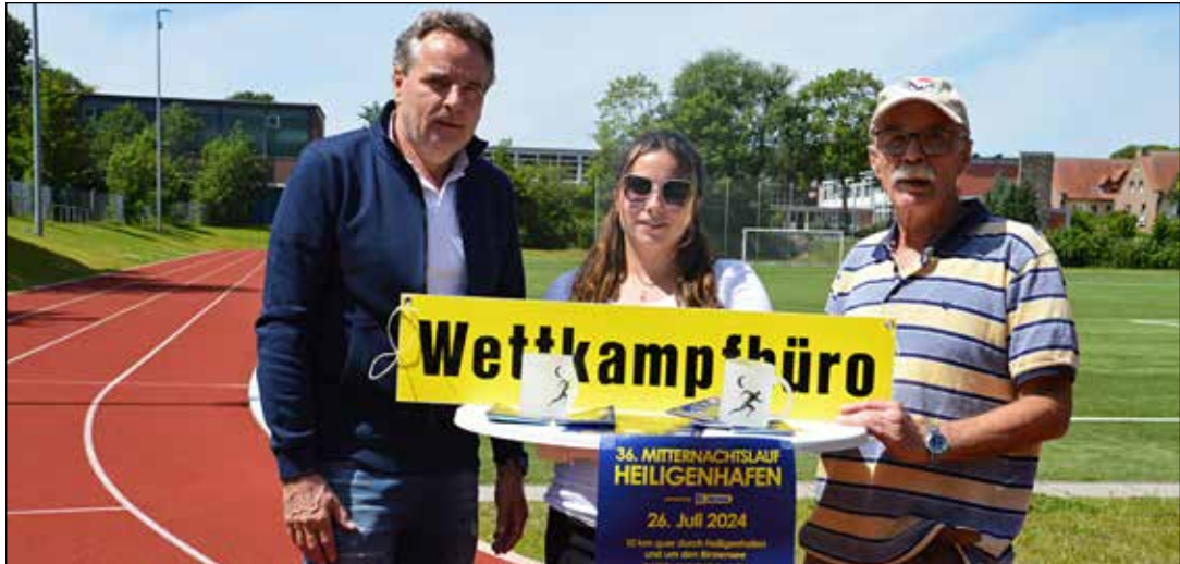
Zahlreiche Läufer starten am Freitag ab dem Sportplatz im Lütjenburger Weg bei der 36. Ausgabe des Heiligenhafener Mitternachtslaufs.

Die Mitternachts-Doppelmeile in ihrer zehnten Ausgabe mit rund 3,2 Kilometer ist für Zehn- bis Fünfzehnjährige geschaffen. Der Start erfolgt voraussichtlich