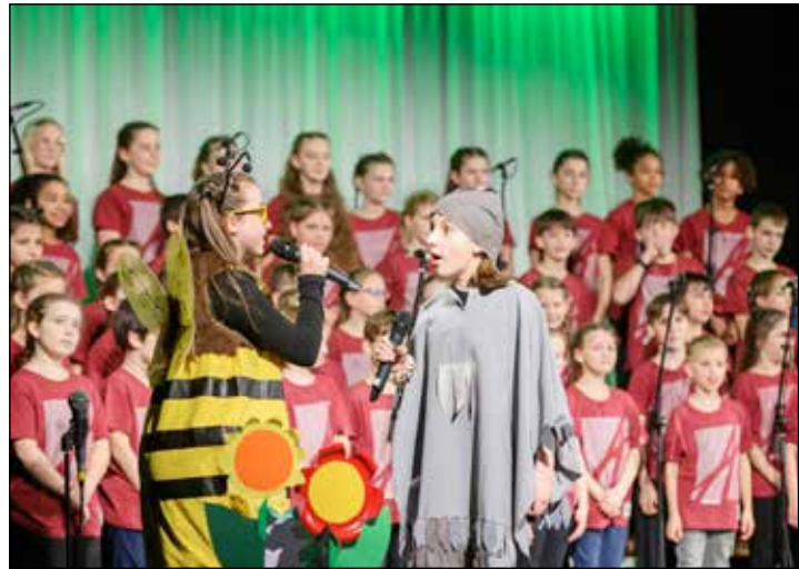
70 Sängerinnen und Sänger freuen sich auf ihren Auftritt auf Fehmarn.

Wenn die Adonia-Juniors auf der Bühne loslegen, ist es schwer, still sitzen zu bleiben. Die Lebensfreude der 70 talentierten Kinder ist ansteckend. Dieses Jahr sind 22 regionale Adonia-Juniorchöre an mehr als 40 Orten deutschlandweit unterwegs, insgesamt über 1300 Kinder. Erstmals zu Gast auf Fehmarn freuen sich 70 Sängerinnen und Sänger darauf, am Sonnabend (27. Juli) um 16 Uhr in der Großsporthalle Burg aufzutreten. Der Eintritt ist frei, um eine Spende am Ausgang wird gebeten.