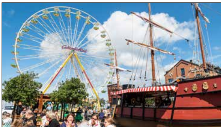
Die 47. Heiligenhafener Hafenfesttage laufen noch bis einschließlich Sonntag in der Warderstadt.

So können gemeinsam mit „De Nordlichter“, dem SV Göhl und befreundeten Tanzgruppen am Freitag von 17 bis 19 Uhr auf der Hafenbühne beim Linedance die Tanzbeine geschwungen werden. Ab 20 Uhr tritt die Band „Shiver“ auf die Hafenbühne. Die Coldplay-Tributeband liefert mit gefeierten Stücken wie