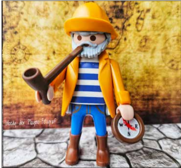
Playmobilfigur Fietje geht auf großes Inselabenteuer.

Anschließend sollte Fietje an einer anderen Stelle auf der Insel wieder ausgesetzt werden. „Warum mache ich das? Zum einen aus Freude daran, anderen