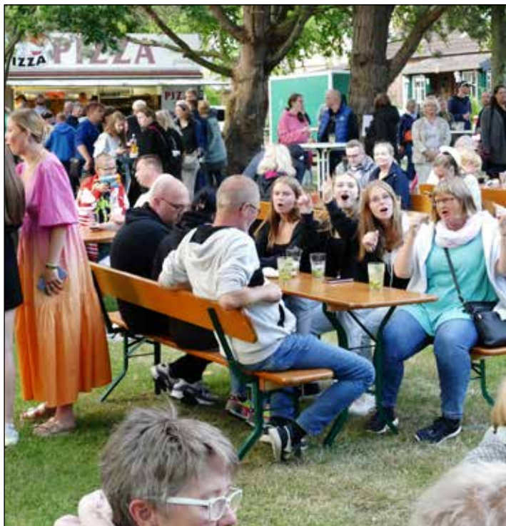
Am Freitagabend ab 22.30 Uhr heizt eine Feuershow den Besuchern auf dem Dorffest ein.

Auch kulinarisch hat das Dorffest ab Freitagabend ab 18 Uhr viel zu bieten: zahlreiche Es-