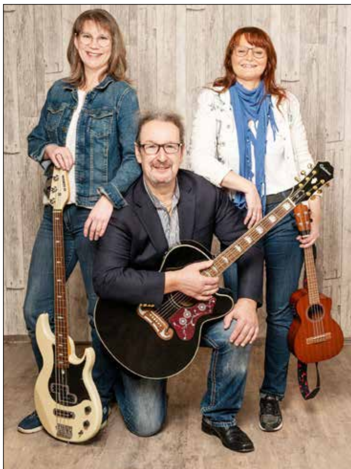
Das Trio „Farvenspeel“ vereint Musik und Leidenschaft.

Mit feinfühligem Moderationen teilen die Musiker ihre persönliche Beziehung zum christlichen Glauben und sprechen „von Mensch zu Mensch“. Ihre Auswahl an stimmungsvollen, modernen christlichen und christlich angelehnten Songs, in Deutsch, Englisch und Dänisch, lädt das Publikum zu einer Reise für Herz und Seele ein. „Glaube – Liebe – Hoffnung“ ist kein musikalischer Gottesdienst, sondern ein Konzert, das berühren kann. Der Eintritt zu diesem besonderen Konzert ist frei. Die Briefkastensche sollte jedoch griffbereit sein, denn die Künstler finanzieren ihre Konzerte in den Kirchen ausschließlich durch Spenden, die nach dem Konzert gesammelt werden. Einlass ist 30 Minuten vor Konzertbeginn.