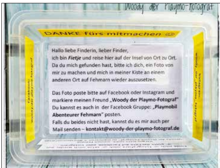
In dieser Box möchte Fietje die Insel Fehmarn erkunden.

ein Lächeln ins Gesicht zu zaubern, aus Neugier darüber, wie viele mitmachen werden, und wie lange die Reise von Fietje letztendlich dauern wird. Und auch, weil ich gelegentlich einfach verrückte Ideen habe, die ich gerne umsetze“, so der leidenschaftliche Playmobilsammler.