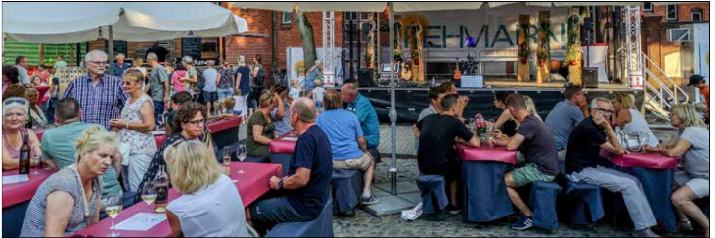
Genuss und gute Stimmung: Besucher des Weinfests in Burg können edle Tropfen an den Winzerständen probieren.