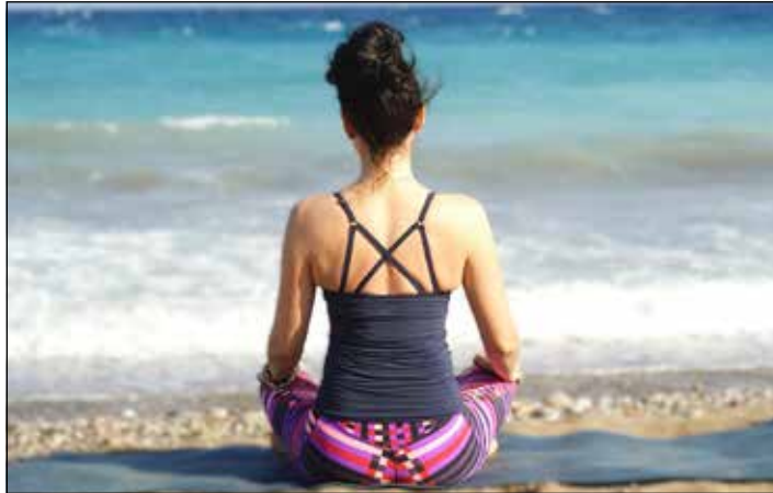
Sport am Meer macht gleich doppelt Spaß.

Das beliebte Aquafit-Programm findet weiterhin mittwochs und donnerstags von 10 bis 10.45 Uhr statt. Die Teilnehmer können sich auf ein effektives Wassergym-