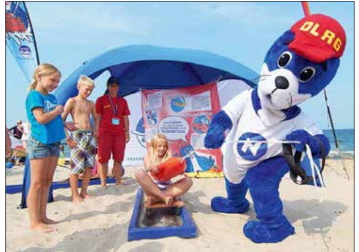
Beim DLRG/Nivea-Strandfest geht es nicht nur um Spiel und Spaß, Baderegeln und das richtige Verhalten im Wasser spielen ebenfalls eine Rolle.

anhänger, Ringe, Armbänder und Ohrringe gefertigt werden. Es fällt keine Gebühr an. Die Teilnehmer zahlen nur die Materialkosten, die je nach Größe des ausgesuchten Bernsteins variieren.