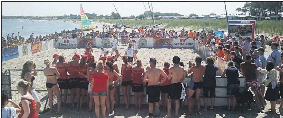
Im Rahmen der Flens-Beach-Trophy treffen sich am Wochenende deutsche Spitzensportler im Beachsoccer am Großenbroder Südstrand.

Am Sonnabend gehen insgesamt zehn Herren-/Mixed-Teams an den Start. Nach der Begrüßung um 12.50 Uhr fällt gegen 13 Uhr der Startschuss für das Turnier. Gespielt wird in zwei Fünfergruppen, nach der Gruppenphase geht es für die zwei Besten beider Gruppen in den Halbfinals um den Einzug ins Endspiel. Die Siegerehrung findet gegen 18.15 Uhr statt. Sonntag kämpfen dann sechs Frauenteams um die Krone. Auch hier startet das Turnier nach einer Begrüßung (12.50 Uhr) um 13 Uhr. Im Modus „Jeder gegen jeden“ spielen die Frauen dann ihre Siegerinnen aus, die gegen 16.30 Uhr bei der