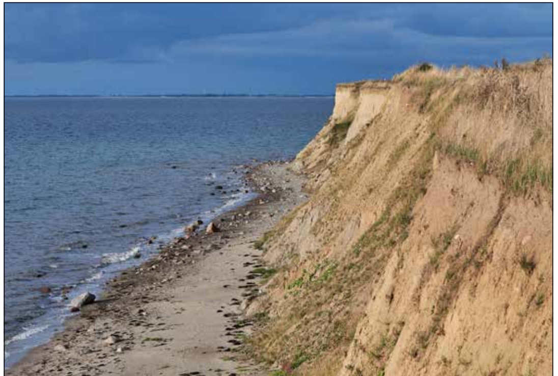
Die Steilküste von Heiligenhafen ist immer einen Ausflug wert.

An der Steilküste bietet sich ein atemberaubender Blick in die Ferne. Es lohnt sich, eine Kamera und ein Fernglas mitzunehmen und die besondere Natur, die sich im Laufe der Zeit immer wieder ändert, auf Fotos festzuhalten. Ebenso ist die Steilküste für Fossiliensammler interessant. Nach Stürmen werden immer wieder neue Versteinerungen angespült. Allein der Spaziergang an der Steilküste sorgt für einen freien Kopf, Entspannung und Eindrücke, die noch viele Jahre im Gedächtnis bleiben werden.