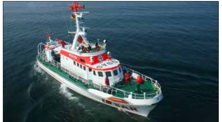
Der Seenotrettungskreuzer „Bremen“ ist in Großenbrode stationiert. Sie wurde 1993 in Dienst gestellt und ist rund um die Insel Fehmarn im Einsatz.