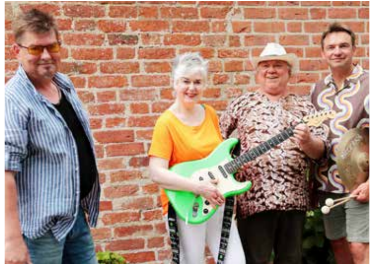
Die Band „Mango“ bringt ein abwechslungsreiches Programm aus Rock, Soul und Gospel in die Kirche St. Johannis.

An der Südseite befindet sich ein kleiner Turm, der „Fangel-turm“, in dem die „Armsünderglocke“ hing, die geläutet wurde, wenn ein Delinquent zum Petersdorfer Richtplatz, dem „Galgenberg“ geführt wurde. Dies und vieles mehr erfahren Interessierte bei den Führungen mit eigens dafür ausgebildeten Westfehmaranern. Beginn ist donnerstags und freitags um 17 Uhr im Eingangsbereich der Kirche, An der Kirche 4. Die Teilnahme ist kostenlos.