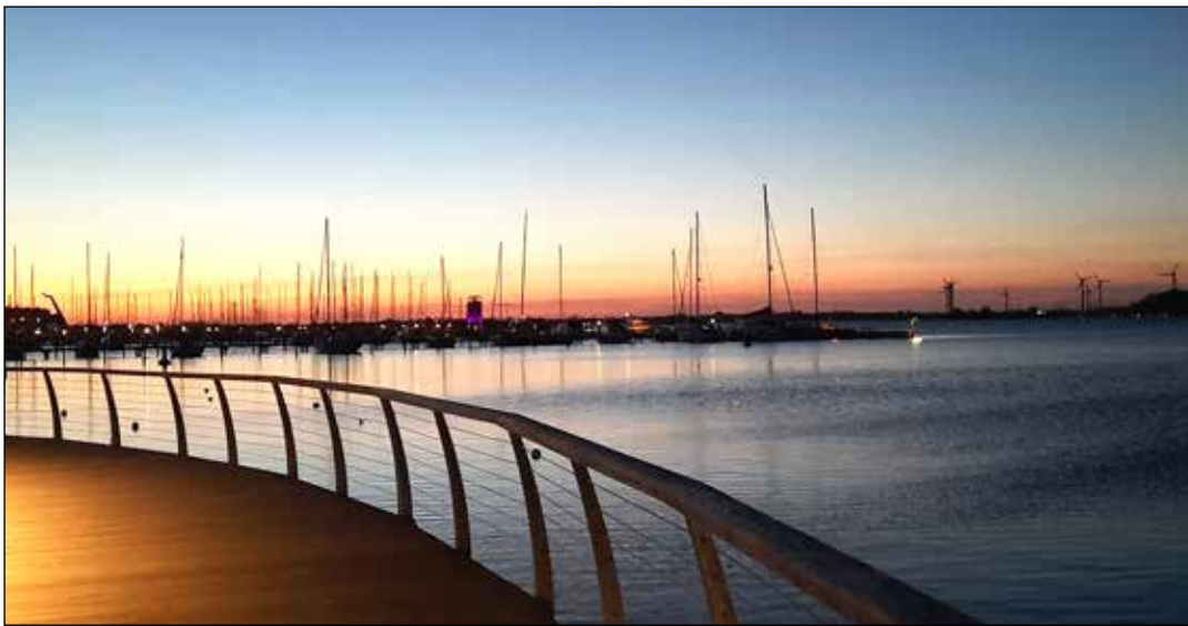
Sonnenuntergang auf Fehmarn: Ein beliebtes Fotomotiv ist der Jachthafen Burgtiefe.