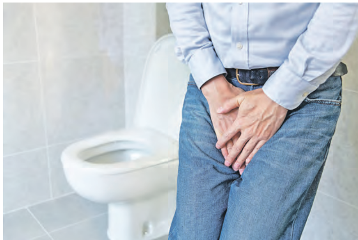
Keine Toilette in der Nähe? Die Angst vor „Unfällen“ führt bei Menschen mit Inkontinenz oft zu sozialem Rückzug.

sachen gefunden, können zum Beispiel Verhaltens- und Ernährungsmaßnahmen, ein Beckenbodentraining oder verschiedene Arzneimittel verordnet werden. Eine weitere Therapieform ist die sakrale Neuromodulation mit einem sogenannten Beckenbodenschrittmacher. Dieser wird im Rahmen eines minimalinvasiven Eingriffs im oberen Gesäßbereich in einer kleinen Tasche direkt unter der Haut implantiert. Mit sanften elektrischen Impulsen stimuliert er dort die sogenannten Sakralnerven, die die Funk-