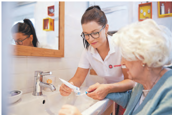
Die ambulante Pflege ermöglicht ein Leben in vertrauter Umgebung.

Mit diesem Ansatz verbindet der Johanniter-Pflegedienst moderne Pflegequalität mit persönlicher