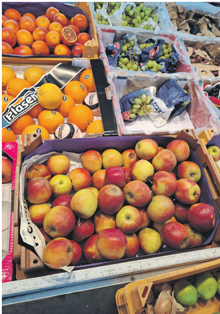
Obst und Gemüse sollten unbedingt eine Hauptrolle auf dem Speiseplan spielen.

Während des Wachstums braucht der Körper bestimmte Nährstoffe besonders dringend. Eiweiß ist wichtig für Muskelaufbau und Zellwachstum. Kalzium stärkt Knochen und Zähne, während Eisen für den Sauerstofftransport im Blut benötigt wird. Zusätzlich unterstützen Vitamine und Ballaststoffe das Immunsystem