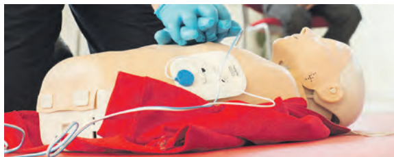
In einem Kurs beim DRK wird das richtige Verhalten im Notfall vermittelt.

Eutin/Plön (t). Erste Hilfe kann jeder lernen – der DRK Kreisverband Ostholstein e.V., in den Kreisen Plön und Ostholstein, nimmt mit seinem breiten Angebot an Erste-Hilfe-Kursen eine wichtige Rolle für mehr Sicherheit im Alltag ein, sei es im Straßenverkehr, am Arbeitsplatz oder zu Hause.