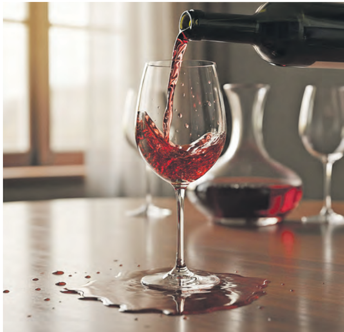
Alkohol kann zum gefährlichen Suchtmittel werden.

Das kann man an der Trinkmenge festmachen. Hierfür gibt es Grenzwerte: bei Frauen 12 Gramm Alkohol am Tag (das entspricht 0,125 Litern Wein oder 0,3 Litern Bier), bei Männern 24 Gramm Alkohol. Ein Teil der Menschen mit schädlichem Alkoholgebrauch steuert irgendwann in die Abhängigkeit.