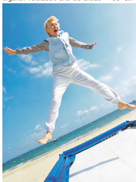
Springen, aktiv sein, das Leben unbeschwert genießen: Mit der richtigen Behandlung ist das auch bei Inkontinenz wieder möglich.