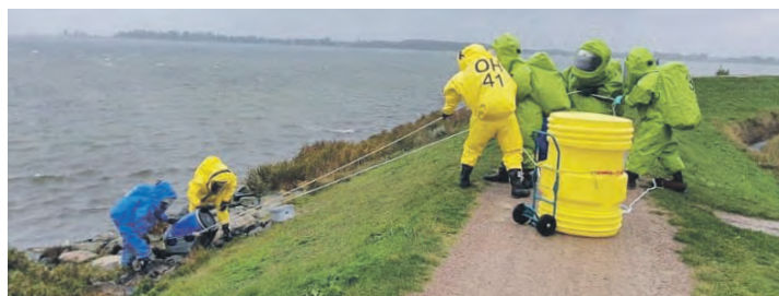
Das Einsatzgebiet der Erkundungsgruppe erstreckt sich von Fehmarn bis nach Eutin. Hier trainieren die Spezialisten die Sicherung und Bergung von Gefahrgut unter erschwerten Bedingungen im direkten Küstenbereich.