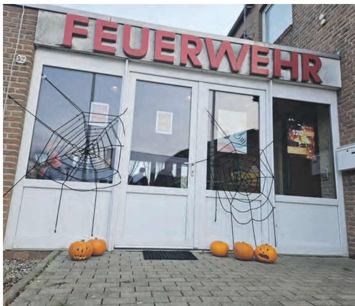
Halloween wurde gut in Szene gesetzt.