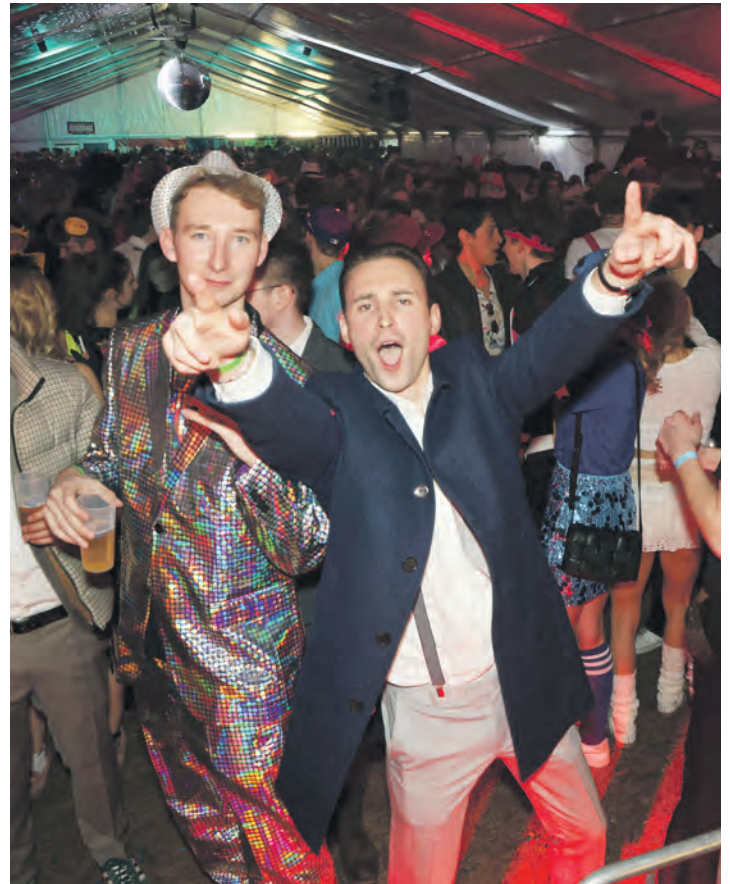
Reichlich gute Laune gab es beim 142. Inselkarneval.

Ein großer Dank gilt allen Beteiligten, die zum Gelingen der Veranstaltung beigetragen haben. Neben den zahlreichen Besuchern waren dies insbesondere die vielen Helfer, die DJs, der Zeltbetreiber TR Zeltverleih sowie die eingesetzten Sicherheits- und Rettungskräfte.