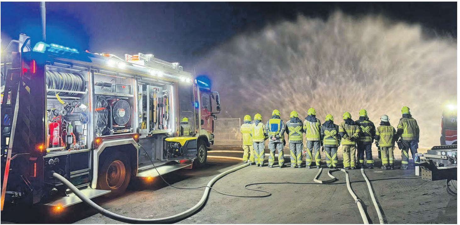
Eine starke Gemeinschaft, die zusammenhält: Die 30 aktiven Kameraden gewinnen Routine durch regelmäßige Übungen.