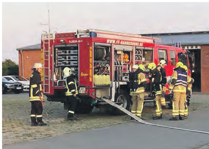
Um bei Großbränden die Wasserförderung und Löschwasserversorgung sicherzustellen, wird am Gerätehaus intensiv trainiert.