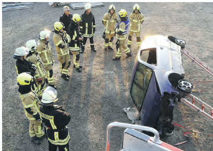
Nur durch eingespielte Zusammenarbeit lassen sich Einsätze meistern – hier bei einer Ausbildungseinheit zur technischen Hilfeleistung.