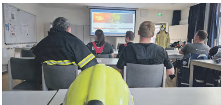
Einmal im Jahr müssen alle Atemschutzgeräteträger bei der Jahresübung ihre Ausdauer unter Beweis stellen, vorher gibt es Theorieunterricht.

Personalmäßig ist die Burger Wehr gut aufgestellt: Der Wehr gehören derzeit 122 Personen an – fünf Kinder in der Kinderabteilung, 28 Jugendliche in der Jugendwehr, 74 Kameradinnen und Kameraden in der Einsatzabteilung sowie 15 Kameraden in der Ehrenabteilung. Durch die hohe Zahl von 74 Kräften in der Einsatzabteilung ist die Tagesverfügbarkeit noch nicht kritisch, könnte aber besser sein. Am 1. März feierte die Wehr ausgelassen den Inselkarneval bei bester Partymusik auf dem Großparkplatz. »