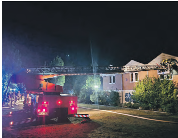
Nächtliches Großfeuer in Meeschendorf: Eine Wohnung in einer ehemaligen Freizeitanlage am Strand stand in Vollbrand.