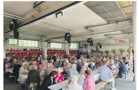
Das Passivenfest findet in diesem Jahr am 21. Juni statt.