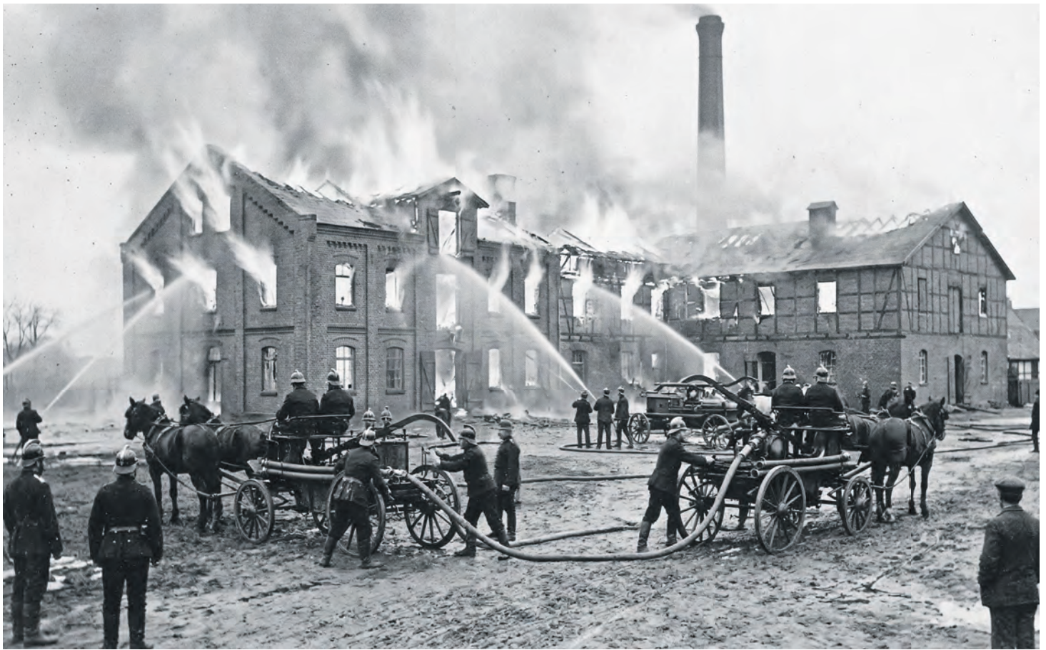
Visuelle Rekonstruktion des Brandes an der Knochendarre der Dampfmühle Mackeprang in Burgstaaken.