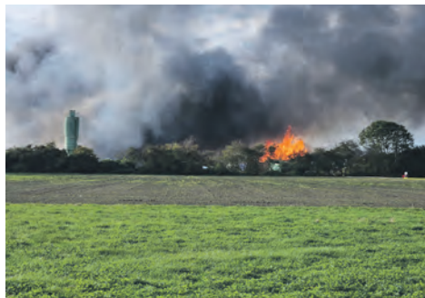
Das Großfeuer in Puttgarden fordert enorm viele Einsatzkräfte im Oktober 2025 heraus.