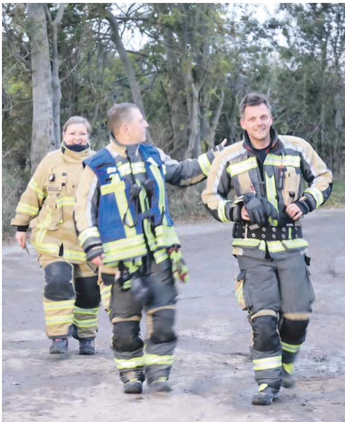
Wo „Caschi“ aufschlägt, herrscht meist gute Laune.