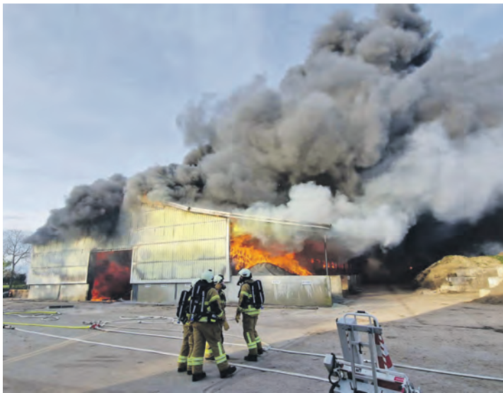
Nach dem Einsturz der Lagerhalle waren die Einsatzkräfte noch stundenlang mit den Nachlöscharbeiten beschäftigt.