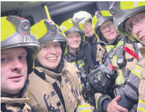
Feierabend für heute – die Truppe ist wieder eingerückt.