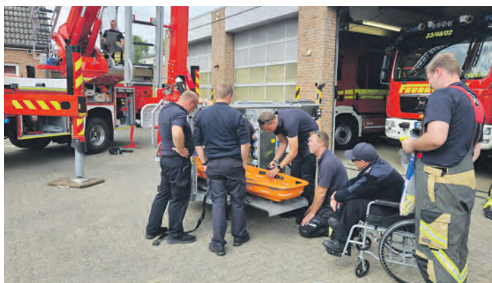
Die Maschinisten trainieren die schonende Patientenrettung, wofür der Korb mit speziellen Tragenhalterungen sowie einem stufenlosen Zugang für Rollstuhlfahrer ausgestattet ist.

» Für die Übergangszeit war eine 30 Jahre alte Ersatzdrehleiter in Burg stationiert, die am Mittwoch, 24. September 2025, zum Hersteller zurückgebracht wurde – womit die Burger Wehr das Kapitel Drehleiter endgültig abgeschlossen hat.