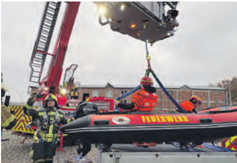
Mit dem Mast kann man das Rettungsboot optimal am Hafen zu Wasser lassen.