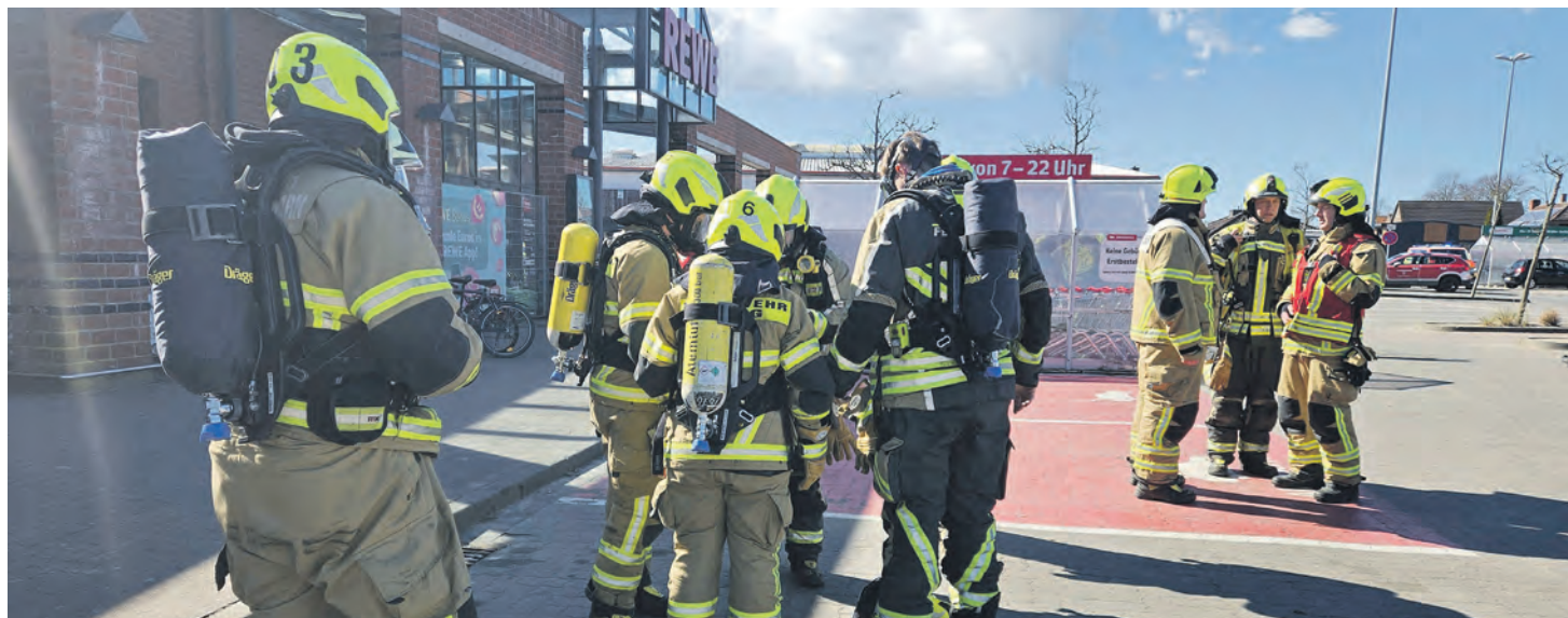
Die ersteintreffende Burger Wehr erkundete den Supermarkt mit mehreren Atemschutztrupps.