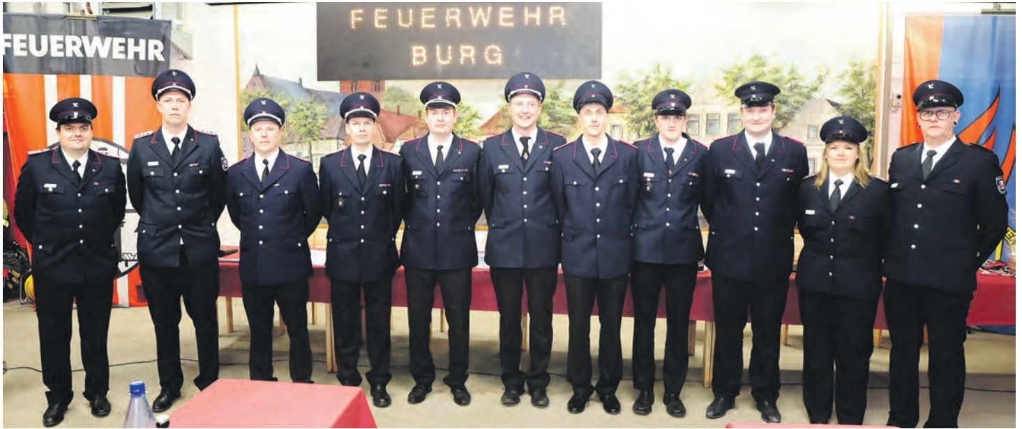
Das frisch gewählte Vorstandsteam der Freiwilligen Feuerwehr Burg stellt sich dem Fotografen. Auf dem Bild fehlen die Jugendwartin sowie der Gruppenführer 3.