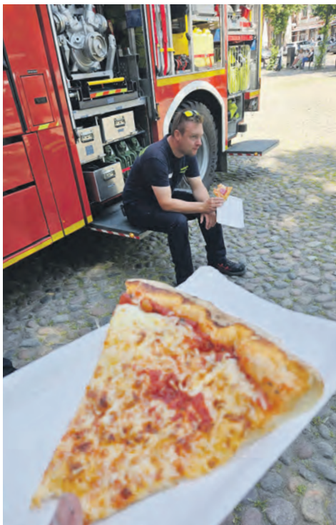
Kleine Stärkung während des Dienstes, nachdem ein Heckenbrand gelöscht wurde.