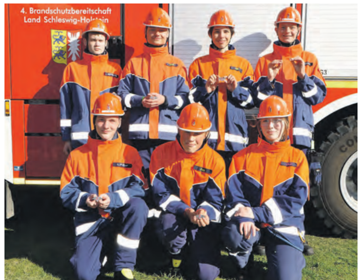
Mitglieder der Jugendfeuerwehr Burg und Oldenburg nach der feierlichen Verleihung der Leistungsspange.