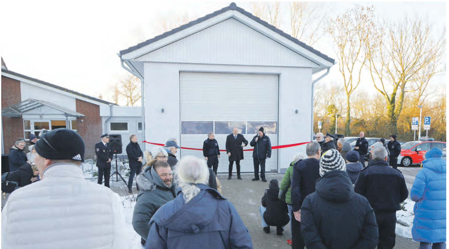
Mit durchtrenntem rotem Band und Ansprachen wurde die neue Fahrzeughalle der Feuerwehr Meeschendorf offiziell eingeweiht.