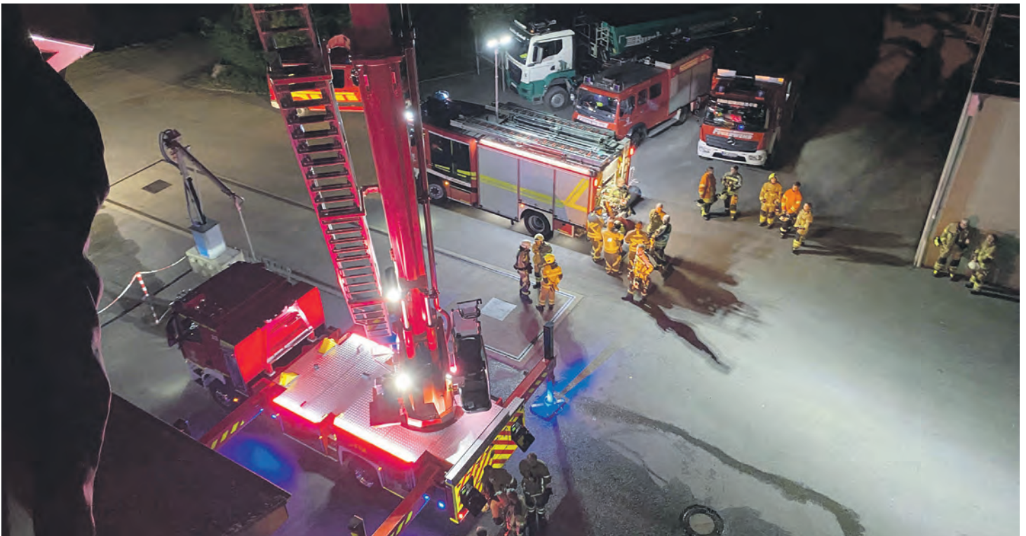
Viele Stunden Aus- und Fortbildung wurden ab September in den neuen Teleskopmast gesteckt.