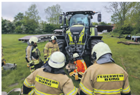
Übung: Zwei Personen klemmen unter einem Traktor, schwierige Hilfeleistung.