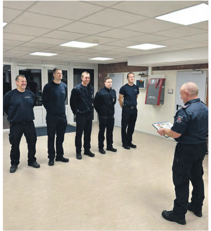
Um 7 Uhr beginnt der Tag mit der Einweisung durch den Wachabteilungsleiter.

Die Mischung aus praktischen Aufgaben, Fortbildungen, gemeinschaftlichen Momenten und Sport macht die Arbeit abwechslungsreich und fordernd. Die Wachabteilungen sind Orte der Effizienz und des Zusam-