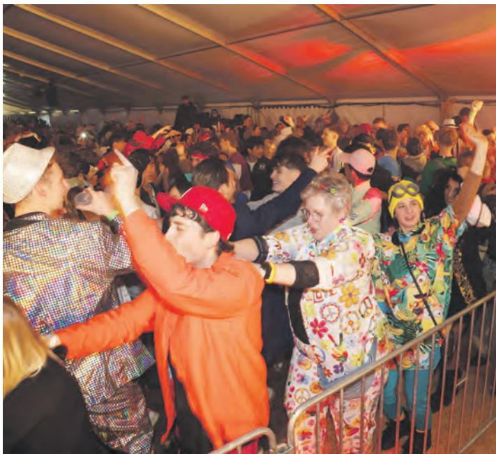
Die Polonaise nach Blankenese durfte nicht fehlen.

Eindrücke und Bilder der Veranstaltung sind auf der Internetseite der Feuerwehr Burg unter www.ff-burg.de zu finden. Eines steht bereits jetzt fest: Die nächste Auflage lässt nicht lange auf sich warten. Am 6. Februar 2027 (Sonntag) heißt es wieder: Fehmarn He-lau!