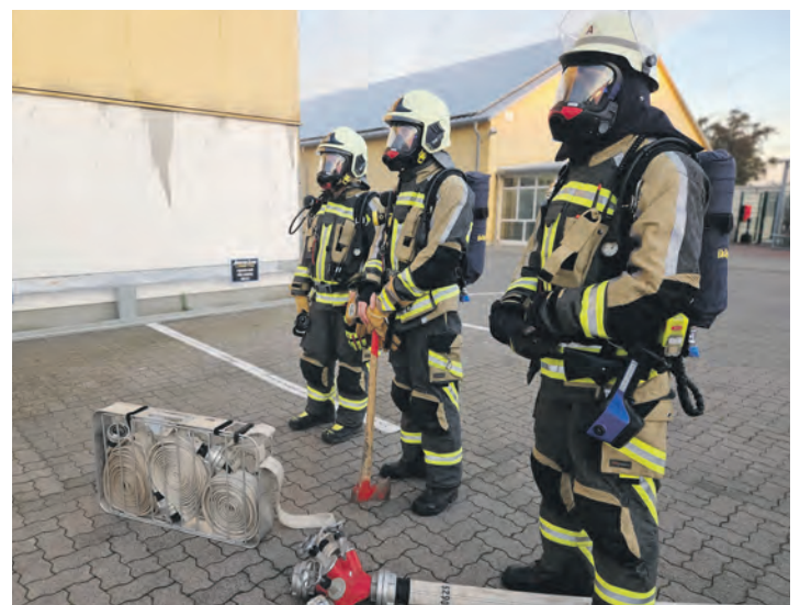
Atemschutzgeräteträger warten auf ihren Einsatz beim „FEU G 00“ an einem frühen Sonntagmorgen in der Industriestraße.