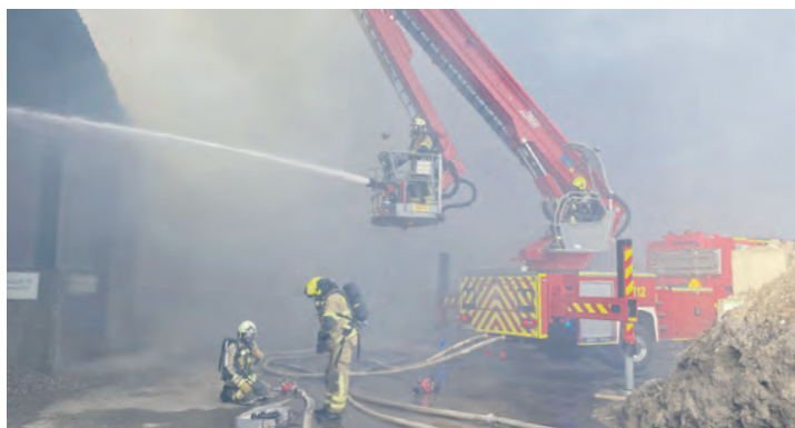
Die Feuerwehr profitiert besonders von der großen Reichweite des F32TLK, die ein Arbeiten bis zu 7,8 Meter über Dachfirste hinweg ermöglicht.