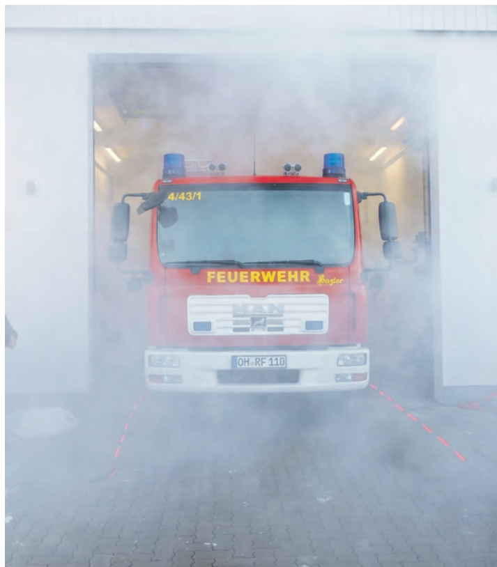
Begleitet von Musik und künstlichem Nebel rollte das Löschfahrzeug eindrucksvoll aus der neuen Fahrzeughalle.

Zusätzlich wurden in allen Orten des Ausrückbezirks jeweils vier verschiedene Plakate aufgehängt, um auf die Feuerwehr Meeschendorf aufmerksam zu machen. Dies hatte auch den