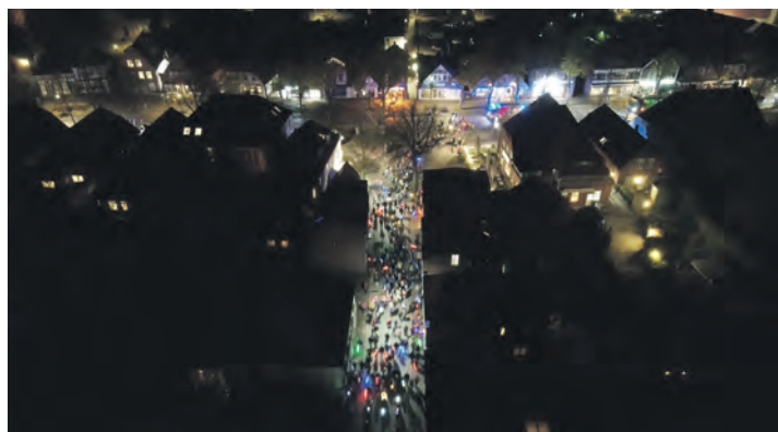
Laternenumzug in der dunklen Burger Altstadt.