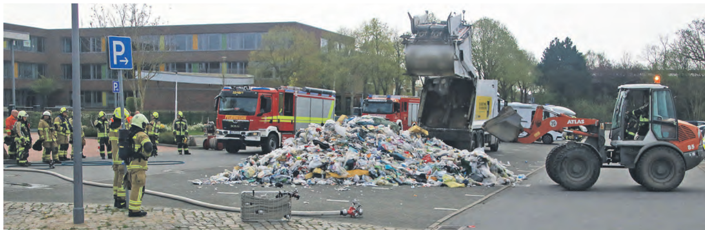
Entstehungsbrand in einem Müllfahrzeug auf Fehmarn während eines Abfuhrtermins – vermutlich ausgelöst durch unsachgemäß entsorgte Lithium-Ionen-Akkus.