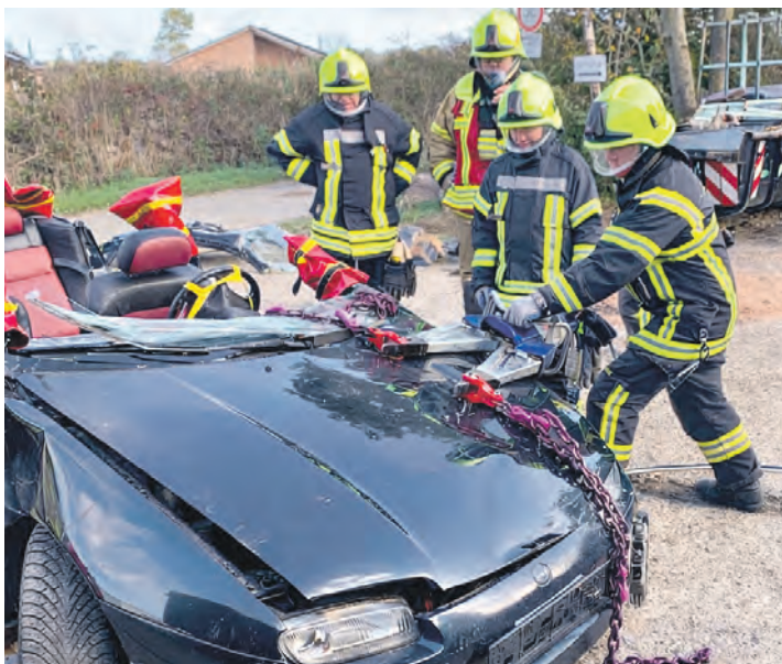
Kameradinnen und Kameraden der Freiwilligen Feuerwehr Landkirchen trainieren intensiv die technische Hilfeleistung.