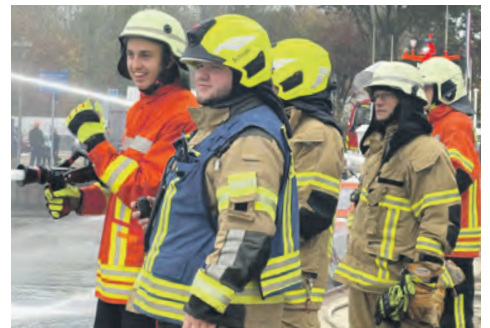
Spaß bei der Abschlussübung im Hafen Burgstaaken im vergangenen November.