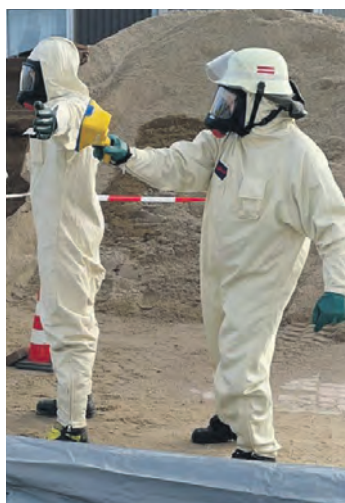
Ein Trupp der Erkundungsgruppe trainiert den fachgerechten Umgang mit spezieller Mess- und Spürtechnik.

Die Erkundungsgruppe Fehmarn ist eine spezialisierte Einheit des Löschzuges Gefahrgut (LZG) des Kreises Ostholstein. Dieser Zug ist dezentral organisiert und in einen Süd- und einen Nordzug aufgeteilt. Im Falle eines Zugalarms rücken im Nordzug neben der Einheit von Fehmarn auch Kräfte aus Heiligenhafen, Oldenburg und Eutin zur Einsatzstelle aus. Das Einsatzgebiet dieser Kräfte erstreckt sich von Fehmarn bis nach Eutin. Als Einsatzfahrzeug steht der Erkundungsgruppe ein Gerätewagen Logistik 1 zur Verfügung, der speziell nach den Anforderungen und Bedürfnissen der Einheit Fehmarn konzipiert wurde. In der Mannschaftskabine befindet sich ein Arbeitsplatz für die Einsatzdokumentation und Stofferkundung. Hierfür werden diverse Messgeräte und digitale Nachschlagewerke vorgehalten. Die einsatztechnische Ausstat-