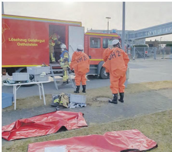
Einsatzkräfte des Löschzuges Gefahrgut Ostholstein an der Absperrgrenze. Dank der mobilen, auf Rollcontainern verlasteten Ausrüstung ist ein schnelles Eingreifen jederzeit möglich.