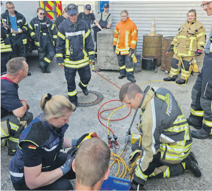
Einsatzkräfte des 1. Zuges der 4. Brandschutzbereitschaft Schleswig-Holstein (4. BSB SH) und Helfer des THW-Ortsverbandes Oldenburg üben gemeinsam die technische Hilfeleistung nach einem Verkehrsunfall.