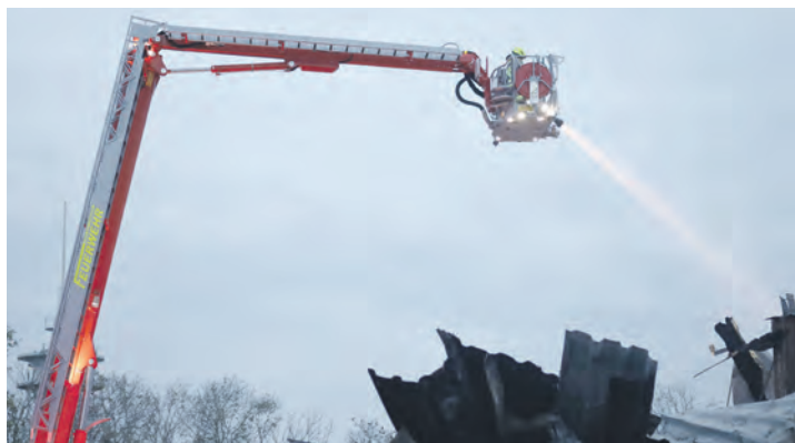
Ein fest verbauter Korbmonitor, eine Wasserabgabe von 2500 Litern pro Minute und die Möglichkeit, den Korb während des Löschvorgangs zu bewegen, sorgen für maximale Effizienz.