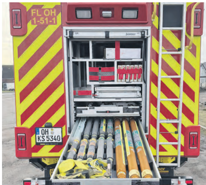
Die umfangreiche Ausrüstung ist für eine Vielzahl technischer Hilfeleistungseinsätze ausgelegt.

investierte bereits viele Sonderübungen, um sich mit den neuen Gerätschaften vertraut zu machen. Die offizielle Indienststellung und Pressevorstellung stehen noch bevor. Zwischen internationalen Lehrgängen und kuriosen Alarmen zeigte sich einmal mehr die Vielseitigkeit des ehrenamtlichen Engagements auf der Insel. „Normal“ ist in der Feuerwehrarbeit ein relativer Begriff, denn Einsätze und besondere Situationen lassen sich nicht planen. Dennoch bot das vergangene Jahr einen tiefen Einblick in das, was die Retter leisten. Ein zentraler Pfeiler war die Ausbildung. Insgesamt absolvierten die Kameradinnen und Kameraden 1656 Übungsstunden, um im Ernstfall jeden Handgriff sicher zu beherrschen. Neben 15 Übungen in der Ortswehr, teils gemeinsam mit den Feuerwehren Süderort, Westfehmar und Dänischendorf, wurden 28 externe Lehrgänge besucht.