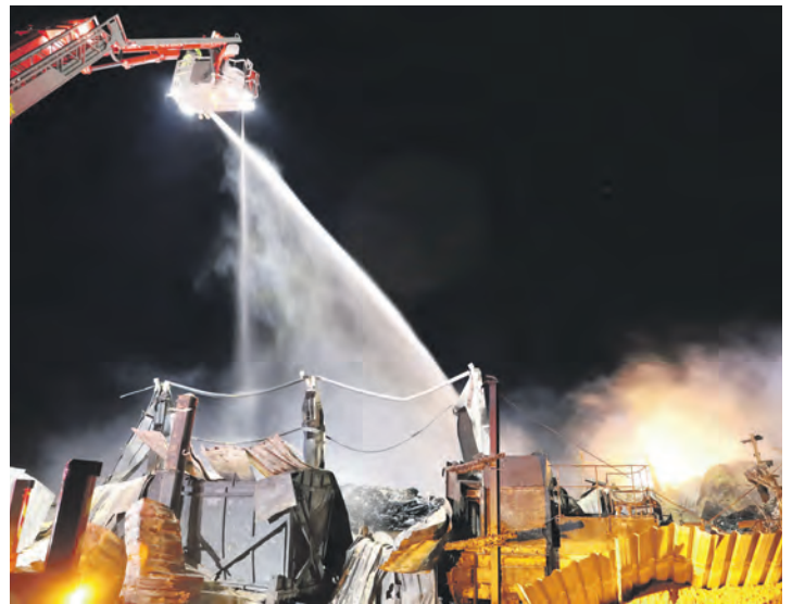
Auch der neue Teleskopgelenkmast vom Typ F32TLK war am 20. Oktober in Puttgarden im Einsatz.