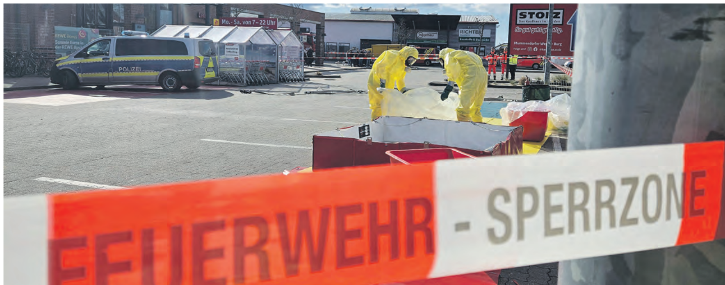
Einsatzkräfte des Löschzugs Gefahrgut Nord in Chemikalienschutzanzügen im Einsatz aufgrund des Verdachts auf Buttersäure.