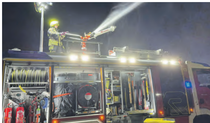
Strahlrohrtraining am großen Wasserwerfer des Einsatzfahrzeugs.

Freiwilligen Feuerwehr sind die regelmäßig stattfindenden Übungsdienste. Es werden unterschiedliche Einsatzsituationen trainiert, damit im Einsatz jeder Handgriff sitzt. Von der Brandbekämpfung bis hin zur technischen Hilfeleistung werden verschiedene Szenarien theoretisch und praktisch geübt, um Routine und Sicherheit im Umgang mit der Ausrüstung zu gewinnen.