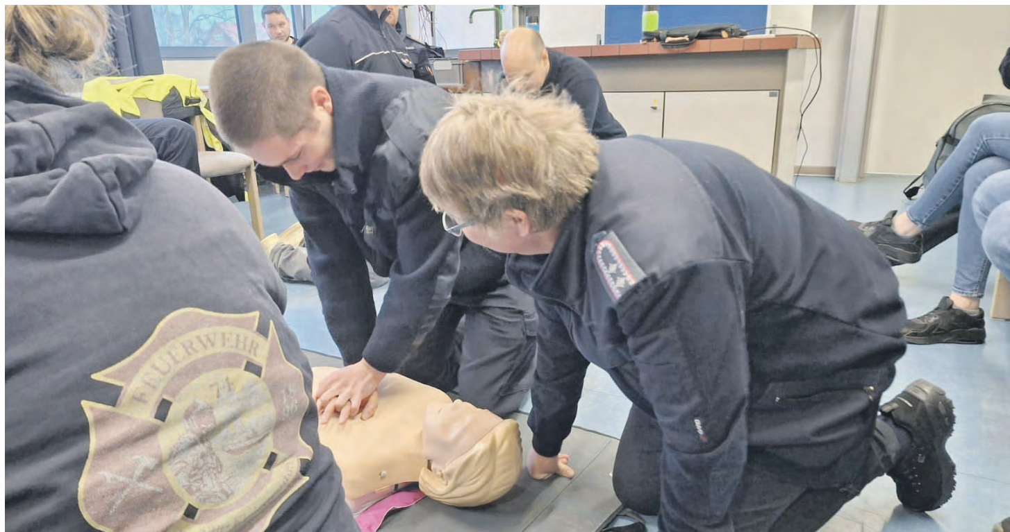
Feuerwehr-Sanitäter, ausgebildet in der FTZ Lensahn, leisten bis zum Eintreffen des Rettungsdienstes Erste Hilfe.

» Die Atemschutzgeräteträger (AGT) mussten sich im Januar zur jährlichen Jahresübung im „Käfig“ beweisen – zum letzten Mal in gewohnter Umgebung. Bereits im Januar 2026 konnten die AGTler die nagelneue Atemschutzübungsstrecke der Feuerwehrtechnischen Zentrale testen und durchlaufen, wobei zuvor an fünf Sportgeräten die körperliche Fitness nachzuweisen war. Auch an Seminaren, Lehrgängen und Workshops nahmen wieder viele Kameraden teil. Dazu zählten unter anderem Technische Hilfeleistung an Landmaschinen, Absturzsicherung, ein Workshop zur Einsatzstellenfotografie, Fahrsicherheitstrainings für Lkw-Maschinisten sowie Motorsägenführung und Fortbildungen für Atemschutzgeräteträger, Jugendwehrbetreuer und Führungskräfte – alles zusätzlich zum regulären Lehrgangsgeschehen.