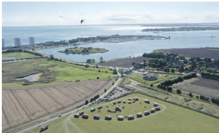
Alle zehn Freiwilligen Feuerwehren und die hauptamtliche Wache bereiteten dem neuen Teleskopgelenkmast im September 2025 einen gebührenden Empfang.