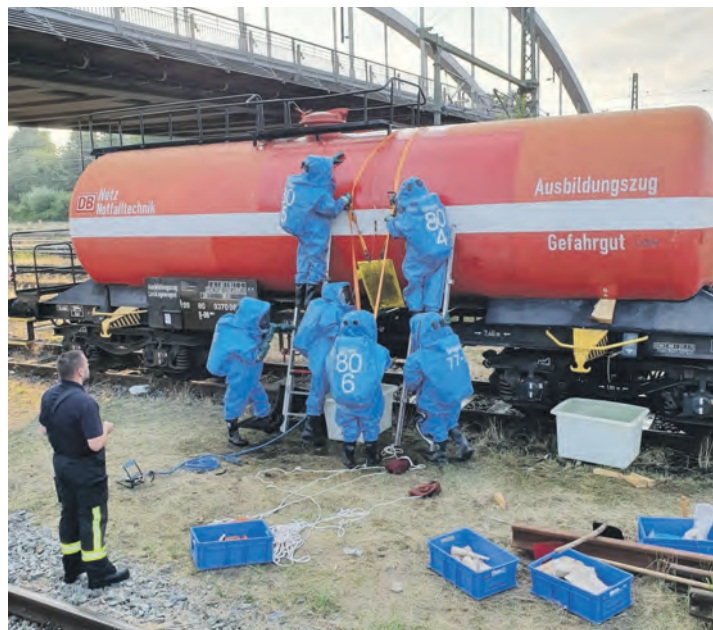
Um für komplexe Schadenslagen bestens gerüstet zu sein, absolviert die Einheit regelmäßig praktische Übungen – wie hier am speziellen Ausbildungszug Gefahrgut der Deutschen Bahn.