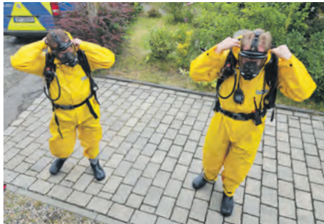
Amtshilfe für die Polizei erforderte Spezialausrüstung und Atemschutz.