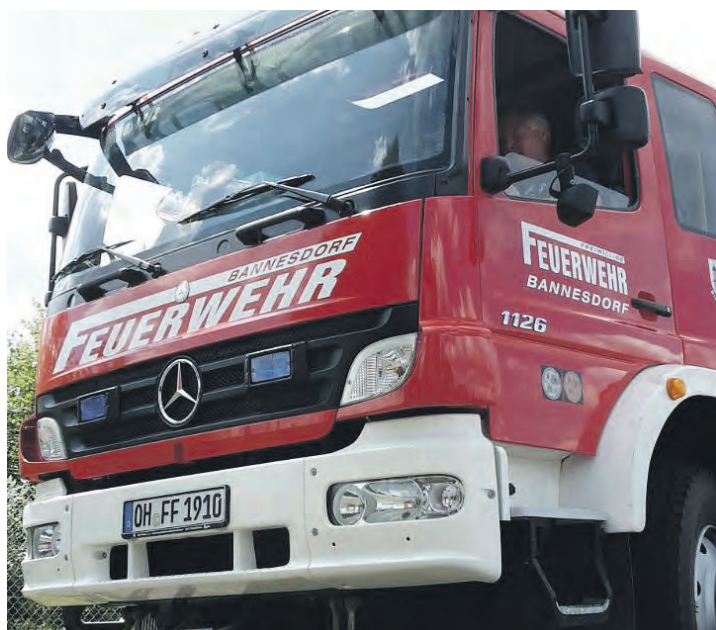
Mit ihrem Löschfahrzeug rückt die Freiwillige Feuerwehr Bannesdorf zu kleinen und großen Schadenslagen aus.

gute Koordination und Durchhaltevermögen können solche Einsätze erfolgreich gemeistert werden. Dafür steht die Feuerwehr Bannesdorf – engagiert, verlässlich und als starker Partner im Verbund der Inselwehren.