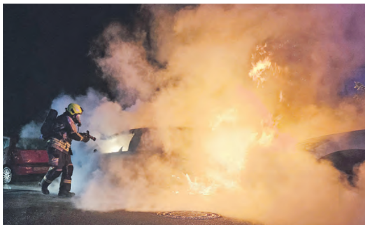
3 Uhr nachts, Pkw-Brand in voller Ausdehnung in der Theodor-Storm-Straße. Drei Stunden vorher piepte ein Rauchmelder in Burgtiefe.

» Die Atemschutzgeräteträger (AGT) mussten sich im Januar zur jährlichen Jahresübung im „Käfig“ beweisen – zum letzten Mal in gewohnter Umgebung. Bereits im Januar 2026 konnten die AGTler die nagelneue Atemschutzübungsstrecke der Feuerwehrtechnischen Zentrale testen und durchlaufen, wobei zuvor an fünf Sportgeräten die körperliche Fitness nachzuweisen war. Auch an Seminaren, Lehrgängen und Workshops nahmen wieder viele Kameraden teil. Dazu zählten unter anderem Technische Hilfeleistung an Landmaschinen, Absturzsicherung, ein Workshop zur Einsatzstellenfotografie, Fahrsicherheitstrainings für Lkw-Maschinisten sowie Motorsägenführung und Fortbildungen für Atemschutzgeräteträger, Jugendwehrbetreuer und Führungskräfte – alles zusätzlich zum regulären Lehrgangsgeschehen.