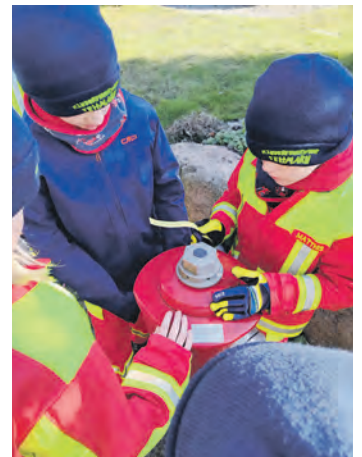
Gemeinsam stark: Lernen bei der Kinderfeuerwehr Fehmarn.

Partizipation, also das Mitentscheiden der Kinder, ist ein elementarer Bestandteil der Dienstplangestaltung. Die Wünsche und Ideen der Kinder sind dem Team – das derzeit aus neun Betreuern aus den unterschiedlichen Wehren der Insel besteht – sehr wichtig. Zusätzlich erhält das Team regelmäßige Unterstützung von den aktiven Kameraden der Feuerwehren der Insel. Interessierte Kinder im Alter zwischen sechs und zehn Jahren sowie ihre Famili-