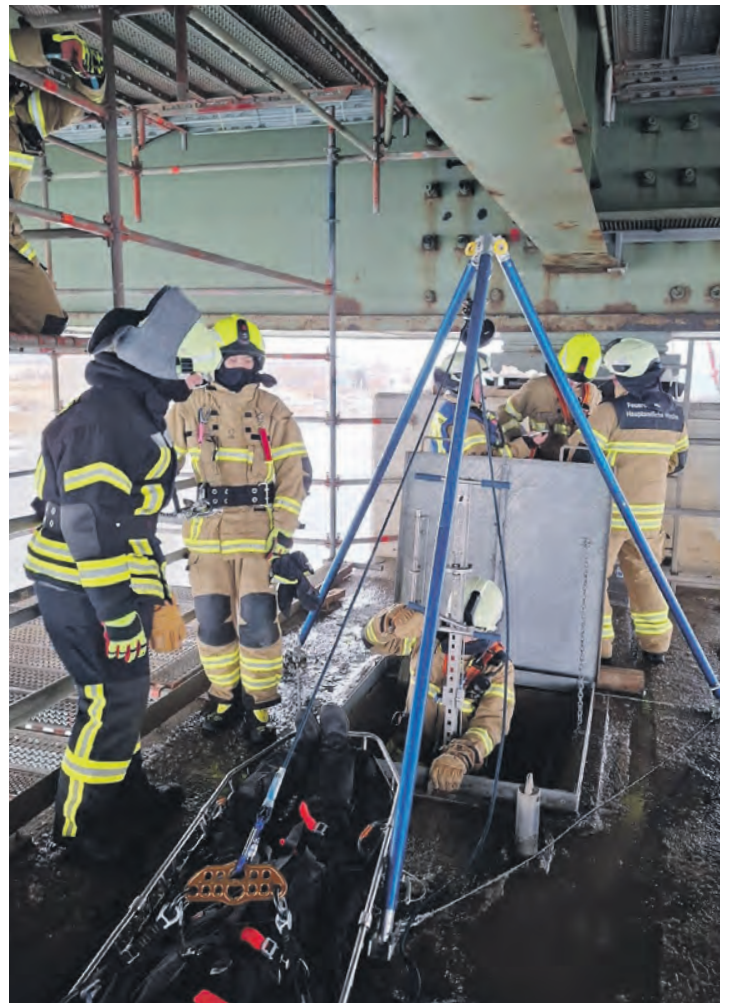
Die Mannschaft trainiert regelmäßig spezialisierte Rettungsmethoden, um im Ernstfall schnell handeln zu können.