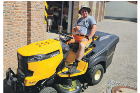
Wenn beim Rasenmähen der Pieper geht, kommt man mit dem Traktor zum Einsatz.