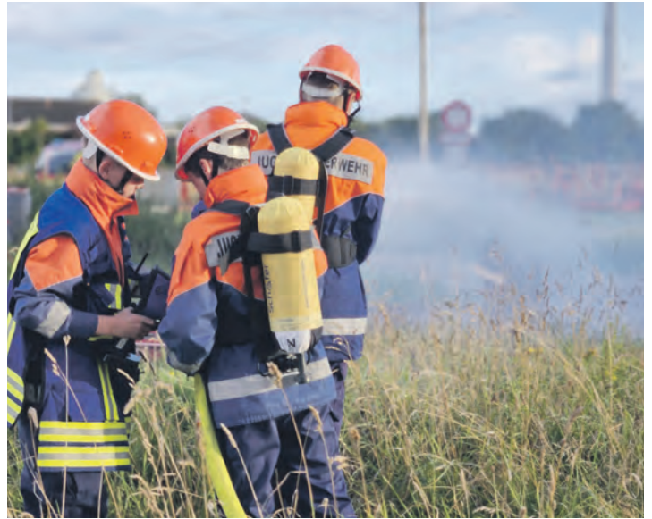
Die Jugendfeuerwehr Burg simulierte im Rahmen eines 24-stündigen „Berufsfeuerwehrtages“ realitätsnahe Einsätze zur Brandbekämpfung.

Das Ausbildungsspektrum in der Jugendfeuerwehr ist breit gefächert. Es umfasst sowohl theoretische als auch praktische Inhalte zum Brenn- und Löschvorgang, Fahrzeug- und Gerätekunde sowie Funkübungen. Auch Grundlagen der Technischen Hilfeleistung, Personenrettung und Erste Hilfe stehen regelmäßig auf dem Programm. Exkursionen zur Polizei, zum Rettungsdienst, zum THW oder zur feuerwehrtechnischen Zentrale in Lensahn ergänzen die Ausbildung und fördern das Verständnis für den Bevölkerungsschutz. Das Angebot der Jugendfeuerwehr richtet sich an Jugendliche im Alter zwischen zehn und 16 Jahren. Die Übungsdienste finden jeden Montag von 18 bis 20 Uhr statt (außerhalb der Ferien). Die Mitgliedschaft ist kostenlos, die benötigte Dienstbekleidung wird gestellt. Während der Aktivitäten sowie auf dem direkten Weg zum Dienst besteht Versicherungsschutz. Interessierte Jugendliche können an den Übungsabenden unverbindlich teilnehmen, um einen Einblick in die Arbeit der Feuerwehr zu gewinnen.