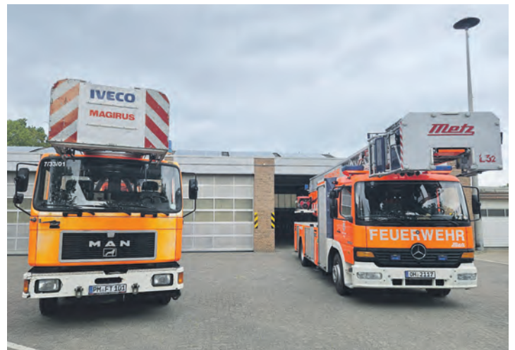
Leihleiter „Betsy“ und die alte Burger Drehleiter.