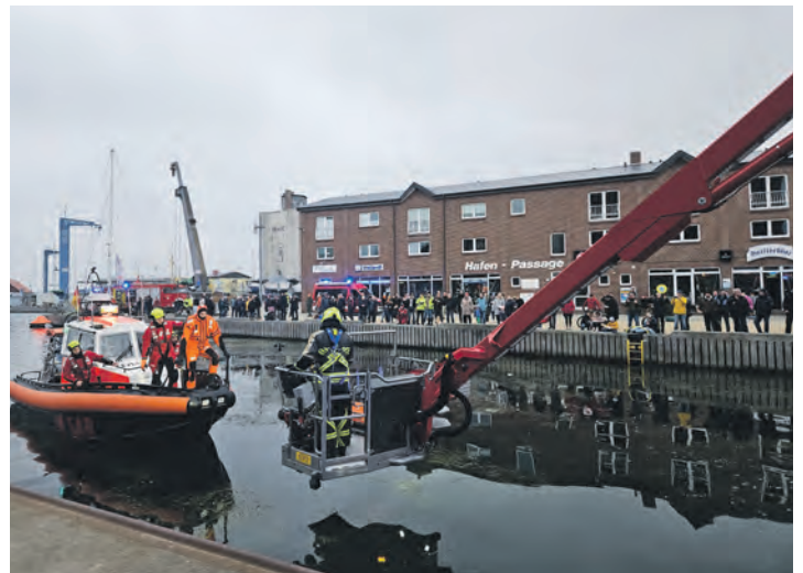
Zusammenarbeit der DGzRS-Station Fehmarn mit dem SRB HELENE bei der Abschlussübung der Feuerwehr Burg.