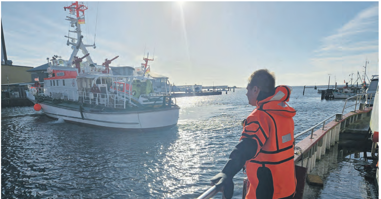
Lenzeinsatz auf einem Schiff in Burgstaaken; die Zusammenarbeit mit den Seenotrettern soll 2026 weiter vertieft werden.

» Doch es gab auch wieder tragische Momente, in denen trotz aller Schnelligkeit und Professionalität nichts mehr für die Betroffenen getan werden konnte – Momente, die nicht vergessen werden. Eines aber bleibt unveränderlich: Die Freiwillige Feuerwehr Burg ist jederzeit 24 Stunden am Tag, sieben Tage die Woche und 365 Tage im Jahr einsatzbereit. Möglich ist das nur, weil Arbeitgeber, Partner und Fa-