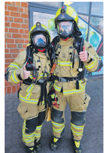
Gerade noch am Einkaufen, einige Minuten später im Einsatz.