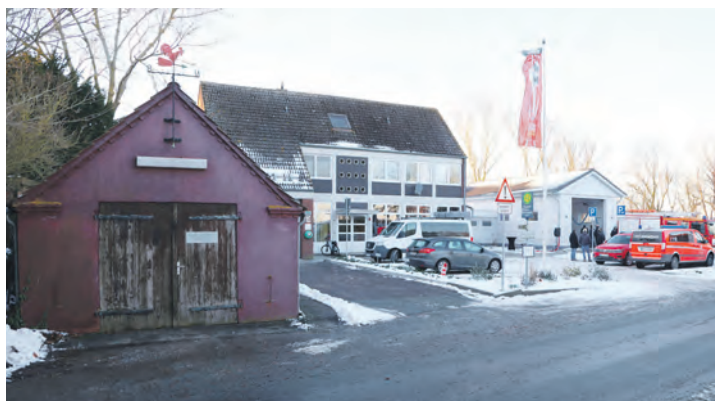
Neben dem alten Gebäude erstrahlt die neu fertiggestellte Fahrzeughalle, die am 10. Januar feierlich eingeweiht wurde.