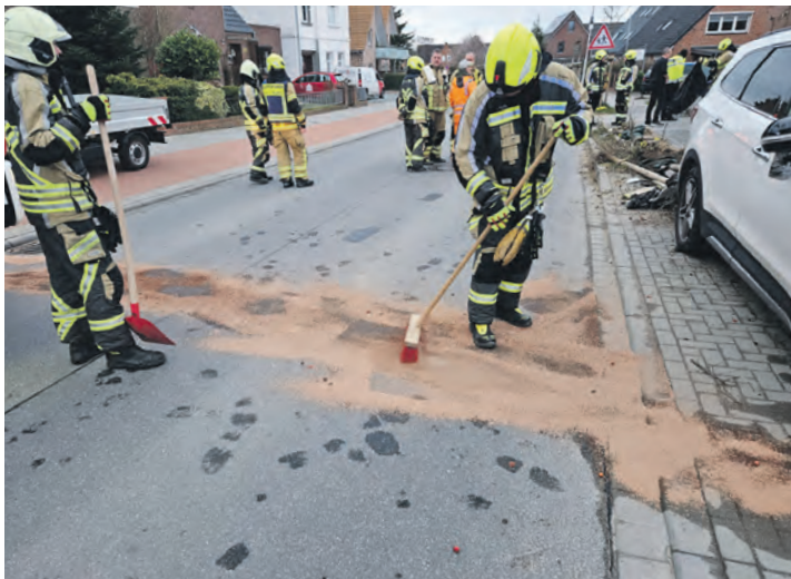
Auslaufende Betriebsstoffe nach einem Verkehrsunfall mit mehreren Verletzten in der Mathildenstraße im Burger Stadtgebiet.