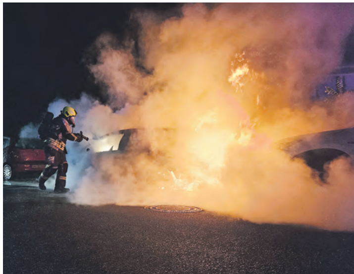
Ein Fahrzeug brannte vollständig aus, wobei die Flammen auf ein dahinter parkendes Auto übergriffen und dieses erheblich beschädigten.