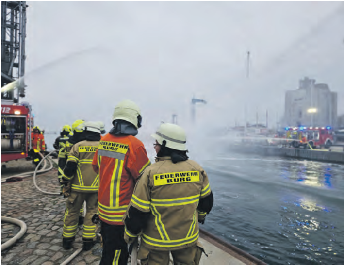
Aus allen Rohren hieß es „Wasser marsch!“