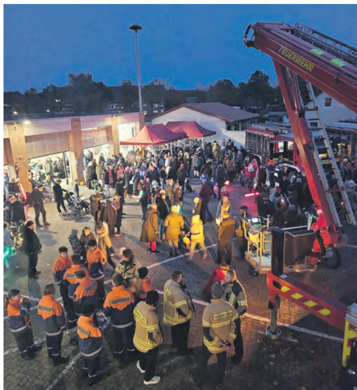
Großer Ansturm auf den Feuerwehrhof.

Die Burger Jugendfeuerwehr zeigt sich überwältigt von der positiven Resonanz und der großen Unterstützung aus der Gemeinschaft. Nach diesem gelungenen Auftakt steht fest: Der Halloween-Laternenumzug hat das Potenzial, zu einer neuen Tradition auf Fehmarn zu werden. Die Vorfreude auf eine Wiederholung ist bereits jetzt groß, die Vorbereitungen laufen bereits. Am 31. Oktober (Sonntag) geht es in eine neue Runde.