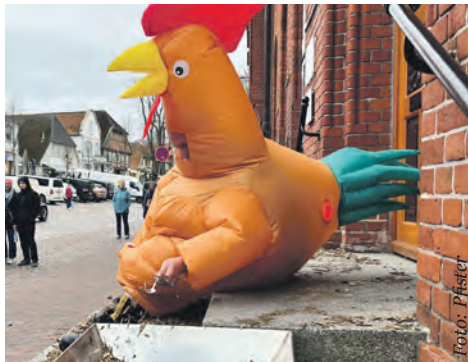
30 Jahre und noch ledig: Kamerad Marvin Siwek musste die Treppe am Rathaus fegen.