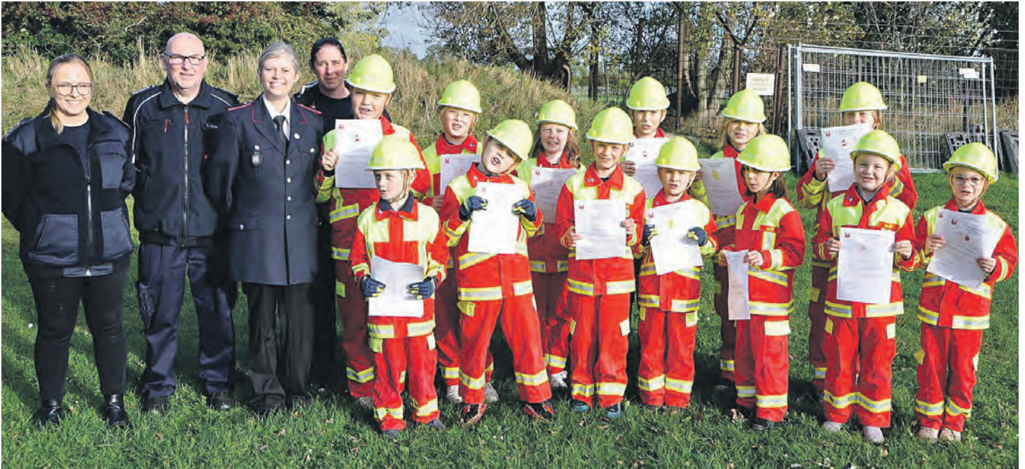
Bei der Kinderfeuerwehr Fehmarn lernen Mädchen und Jungen im Alter zwischen sechs und zehn Jahren spielerisch die Grundlagen des Brand-schutzes. Begleitet von einem engagierten Betreuersteam steht dabei das aktive Mitgestalten im Vordergrund.