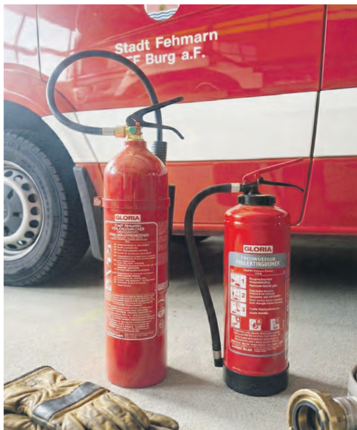
Ein Feuerlöscher im Haushalt kann in der Anfangsphase eines Brandes wertvolle Minuten gewinnen und größere Schäden verhindern.

Ein Feuerlöscher ersetzt nicht die Feuerwehr, kann aber wertvolle Minuten gewinnen und größere Schäden verhindern. Wer ein passendes Gerät hat, es regelmäßig warten lässt und im Ernstfall korrekt einsetzt, erhöht die Sicherheit in den eigenen vier Wänden deutlich. Trotzdem gilt immer: Die Feuerwehr unter 112 alarmieren – auch wenn das Feuer bereits gelöscht scheint.