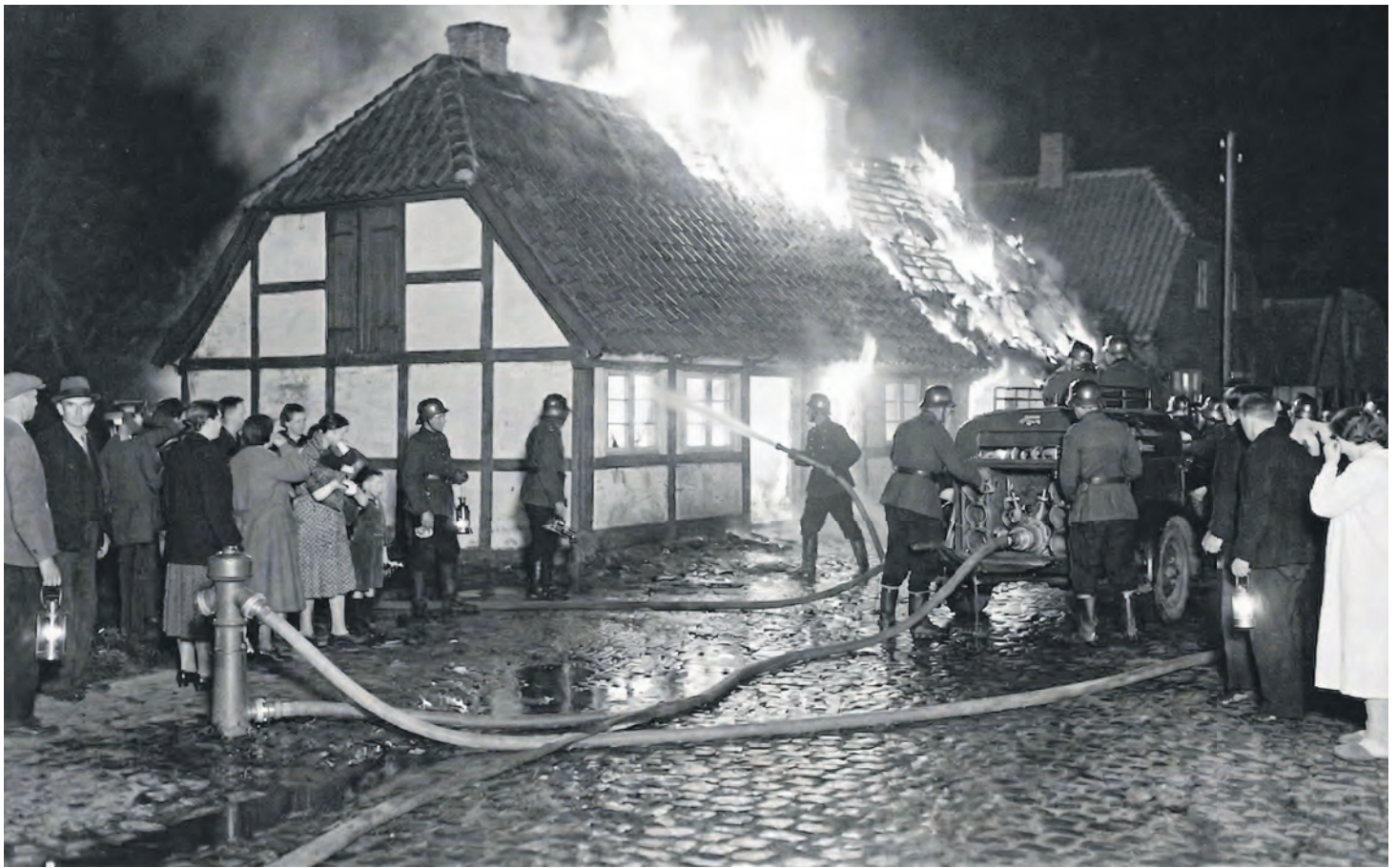
Die Bewohner konnten sich nur knapp retten, während ihr Hab und Gut größtenteils von den Flammen vernichtet wurde. Foto: KI-generiert