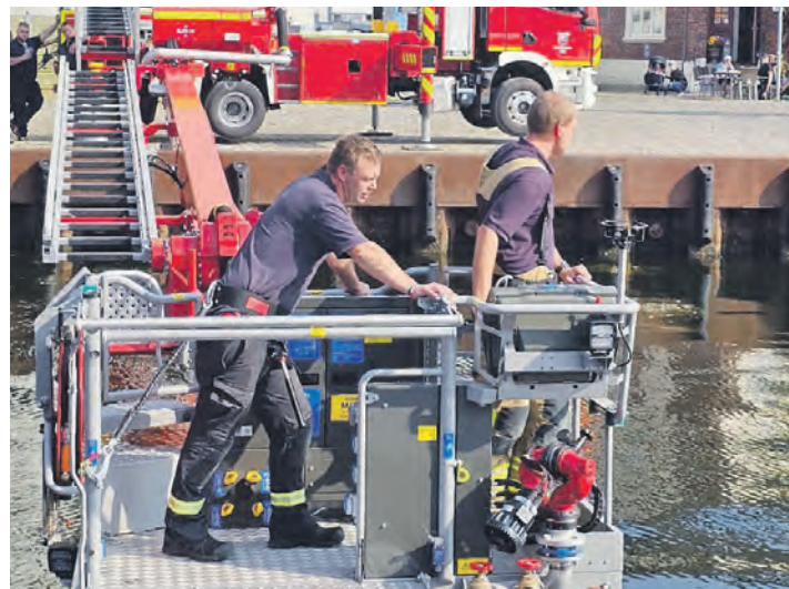
Im Kommunalhafen wurde der Teleskopgelenkmast auch auf dem Wasser auf Herz und Nieren getestet.