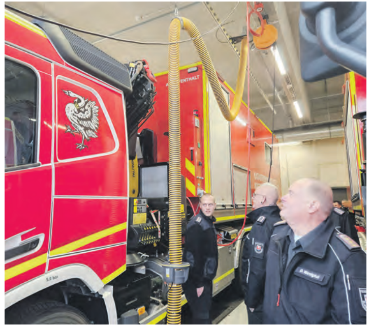
Am KatS-Zentrum Hammoor, das als Modell für künftige Katastrophenschutz-Zentren konzipiert ist, stellt die 4. Brandschutzbereitschaft Schleswig-Holstein ihre Erfolge in den Bereichen Übungen, Fuhrpark und Führungsfähigkeit dar.