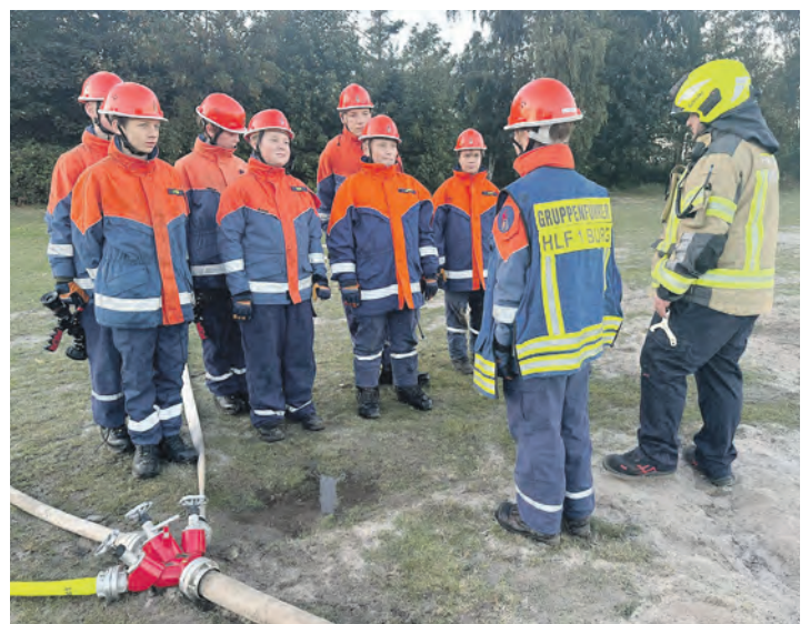
Der Feuerwehrynachwuchs bei einer praktischen Übung zur Wasserförderung und zum Löschangriff.