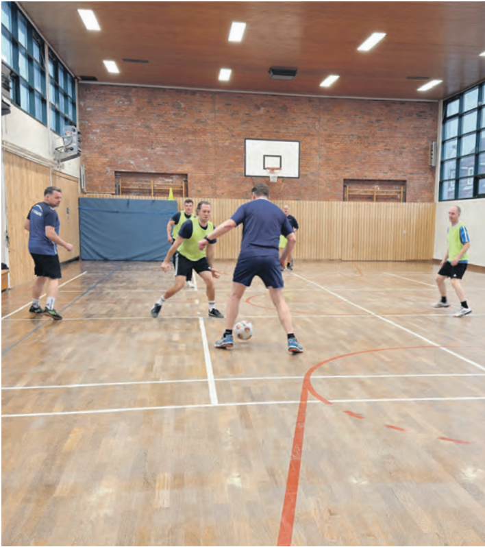
Dienstsport am Nachmittag: Fitness und Teamgeist werden beim Fußball oder Badminton gestärkt.

» Ein besonderer Bestandteil des Dienstsports ist das zweimal wöchentlich stattfindende Training „Fit for Fire“, das gemeinsam mit den Freiwilligen Feuerwehren der Stadt Fehmarn durchgeführt wird. Dieses Training ist auf die körperlichen Anforderungen des Feuerwehrdienstes ausgerichtet und fördert neben Kraft, Ausdauer und Beweglichkeit auch die Zusammenarbeit zwischen haupt- und ehrenamtlichen Feuerwehrangehörigen. Der Sport trägt somit nicht nur zur Fitness bei, sondern stärkt nachhaltig den Teamgeist und die Kameradschaft über Abteilungsgrenzen hinweg.