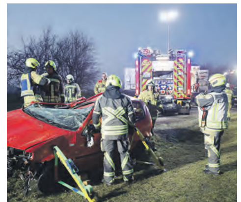
Einsatzkräfte der Feuerwehr Fehmarn und des Rettungsdienstes Holstein bei der technischen Rettung einer eingeklemmten Person.