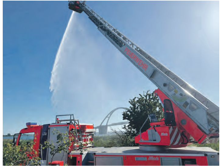
Servus, Fehmann! Die alte DLK 23/12 zum Abschied an der Sundbrücke.