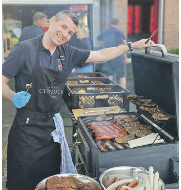
Die Sommerpause wurde 2025 mit einem rustikalen Abschluss mit Grillen und Geselligkeit bei bestem Sommerwetter eingeläutet.

» Im Juni gab es abermals ein Fest für fördernde und passive Mitglieder bei einem zünftigen Frühschoppen mit deftigem Essen sowie einem späteren Kaffee- und Kuchenbüfett. Auch die Zahl der passiven Mitglieder ist weiterhin hoch – worauf die Wehr sehr stolz ist.