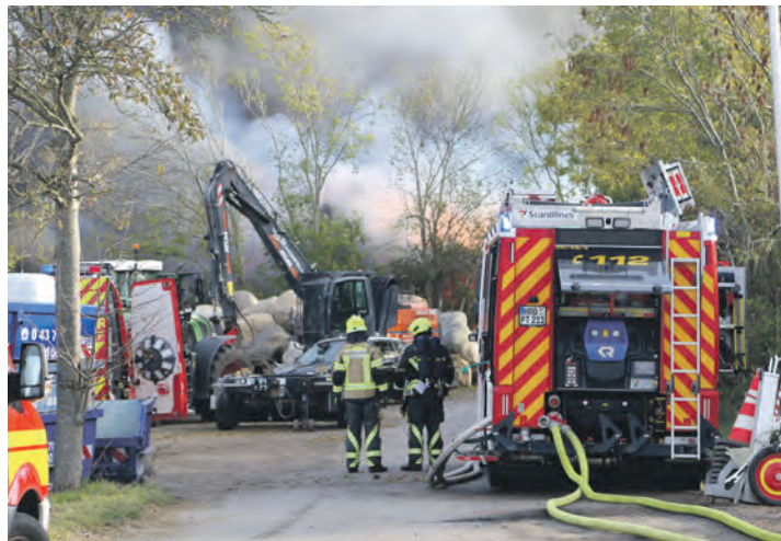
Rund 100 Feuerwehrfrauen und -männer waren im Einsatz, teilweise unter Atemschutz.

Ein Großbrand auf dem Betriebsgelände des Recyclinghofs der „Von Schönfels GmbH“ in Puttgarden hat am 20. Oktober die Feuerwehren von Fehmarn und des Umlands in Atem gehalten. Eine etwa 60 mal 35 Meter große Lagerhalle brannte trotz eines massiven Löscheinsatzes komplett nieder. Glücklicherweise wurde niemand verletzt. Kurz nach 9.30 Uhr bemerkten Mitarbeiter der Recyclingfirma auf dem Gelände in der Straße Westerdor in Puttgarden eine Rauchentwicklung in der Lagerhalle und alarmierten die Rettungskräfte. Aufgrund der sofortigen Stichworterhöhung auf FEU 4 (Großbrand) rückten zahlreiche Feuerwehren an. Bereits aus Richtung Heiligenhafen war die massive, schwarze Rauchwolke auf dem Festland über der Insel deutlich zu sehen. Als die ersten Einheiten eintrafen, stand die Halle, in der sich