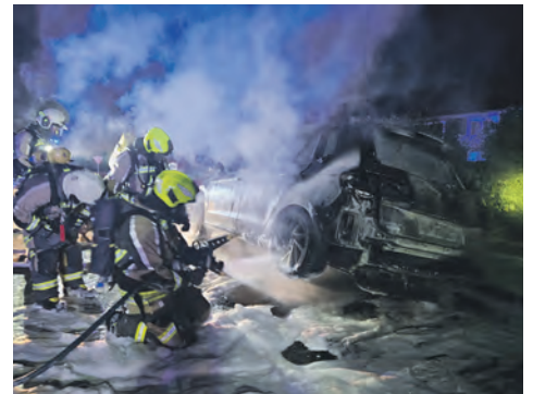
Fahrzeug mittels Spreizer aufgebockt, um auch unterm PKW löschen zu können.