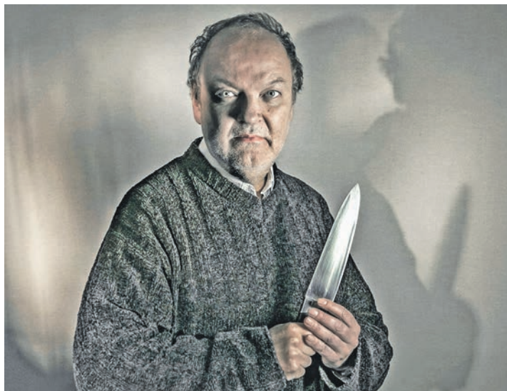
Präsentiert eine sehr atmosphärische Lesung: die Schauspieler und „Drei ???“-Sprecher Jens Wawrczeck.

Auch jüngere Krimi-Fans kommen auf ihre Kosten: Beim Fan-Event „Die drei ??? und das Gespensterschloss“ am 20. September im Schloss Eutin wird das