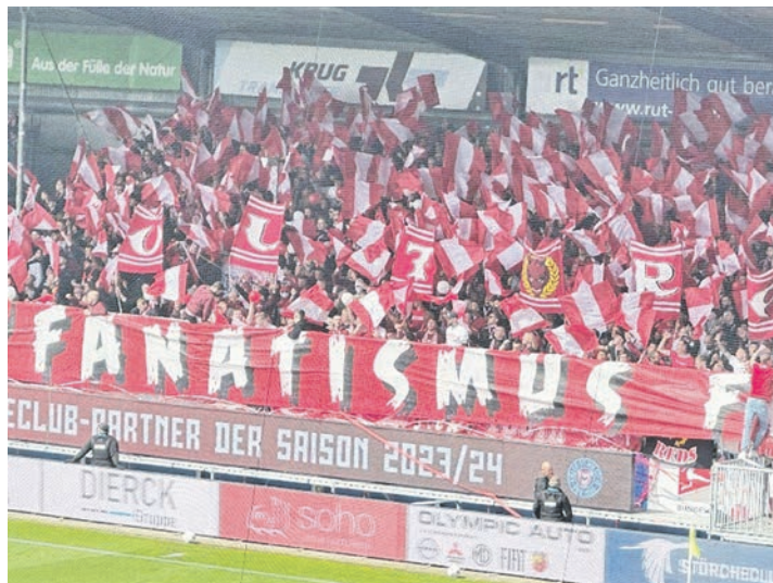
Auch heuer werden viele FCK-Fans in Kiel dabei sein ...

Kreis Plön (dif). Die KSV Holstein ist, wie schon eine Woche zuvor, erneut an einem Freitagabend in Sachen 2. Fußballbundesliga gefragt. Ab 18.30 Uhr wartet im Stadion am Mühlenweg der 1. FC Kaiserslautern auf die Störche. Ein Gegner aus dem gehobenen Tabellennittelfeld. Auch wenn die „Roten Teufel“ aktuell keine absolute Spitzenmannschaft sind, das Hinspiel hat klar gezeigt, welch starkes Team die Pfälzer haben. Hoch mit 1:4 wurde das Duell am Betzenberg verloren. Ein Match, in dem die Kieler komplett chancenlos waren und früh zurücklagen. Das soll und muss heute anders werden. Es erübrigt sich fast zu erwähnen, dass ein Heimsieg einmal mehr ganz oben auf der Agenda stehen muss. Kurz vor dem Aufstieg der KSV brachten die Lauterer den Kielern eine Heimmiederlage bei. Wir tippen aber diesmal auf einen 2:0-Gastgebererfolg der Walter-Elf, die mit sicherlich ordentlich Selbstvertrauen aus dem Düsseldorf-Spiel in diese neunzig Minuten gehen wird. Am