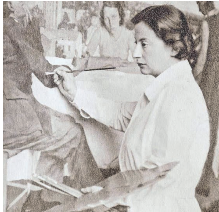
Ihre Bilder überzeugten durch große Realitätstreue: die Künstlerin Lotte Laserstein.

zahlen ermäßigt 10 Euro. Eine Anmeldung unter Telefon 04342-719863 oder per E-Mail an vhs-preetz@t-online.de ist möglich, die spontane Teilnahme über die Abendkasse aber auch.