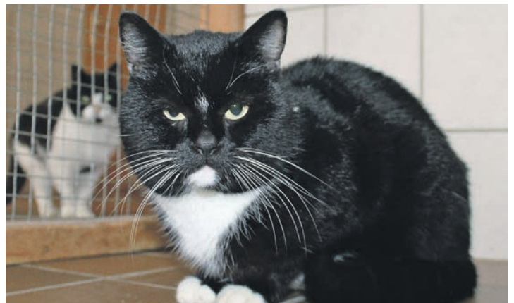
Eigentlich ein gutgelaunter Matz: der süße Momo.

harrliches Schnurren macht sich breit. Am liebsten möchte man mit schnurren ... So verlässt man ihn jedes Mal mit einem breiten Lächeln im Gesicht und denkt sich: „Der Matz ist genau richtig!“