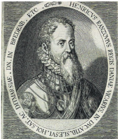
Heinrich Rantzau nach Goltzius aus „Dominicus Custos: Atrium heroicum Teil 3“, Augsburg 1600. Auf der Umschrift ist zu lesen: „Heinrich Rantzau, Stellvertreter des Königs der Dänen, in den Herzogtümern Schleswig, Holstein und Dithmarschen, Herr auf Breitenburg etc.“.