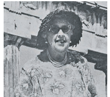
Sie ist die Queen of Crime: Krimiautorin Agatha Christie.