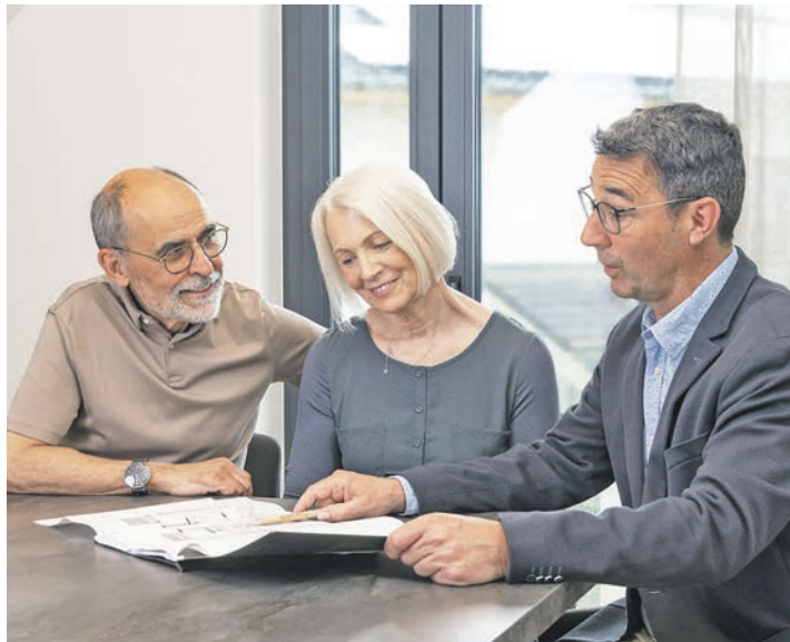
Wärmepumpen in größeren Gebäuden müssen regelmäßig geprüft werden.

Ostholstein/Kreis Plön (t). Nicht nur fossil betriebene Heizungen in größeren Gebäuden müssen regelmäßig geprüft werden – die Pflicht gilt auch für Wärmepumpen. Die ersten Anlagen sind im Januar 2026 unter die Prüfpflicht gefallen. Darauf weist das vom Umweltministerium Baden-Württemberg geförderte Informationsprogramm Zukunft Altbau hin. Gebäudeeigentümerinnen und Gebäudeeigentümer müssen die Anlagen nach einer vollständigen Heizperiode, spätestens aber zwei Jahre nach der Inbetriebnahme, untersuchen lassen. Die Regelung betrifft wassergeführte Luft-, Wasser- und Erreichwärmepumpen, die nach dem 31. Dezember 2023 in größeren Gebäuden ab sechs Wohnungen eingebaut wurden. Sie gilt auch für Gebäudenetze mit mindestens sechs angeschlossenen Wohneinheiten. Gesetzliche Grundlage ist der