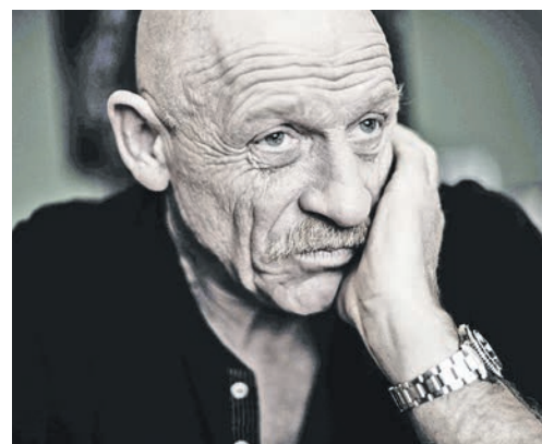
Joe Bausch ist bekannt aus Funk und Fernsehen. Er serviert dem Eutiner Publikum einen True-Crime-Abend.

Weitere Infos zum Programm sowie zum Kartenvorverkauf sind online auf www.hitchcock-days.de erhältlich. Unterstützt werden