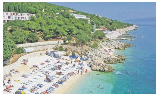
Traumhafte Strände und warmes Klima erwarten die Leser bei der großen Sonderfahrt nach Kroatien.

Höhepunkten sowie malerischen Altstädten mit großer Geschichte freuen. Residieren werden sie im Vier-Sterne-Komfort-Bade-Hotel mit zwei großzügigen Pools (Innen- und Außenpool)