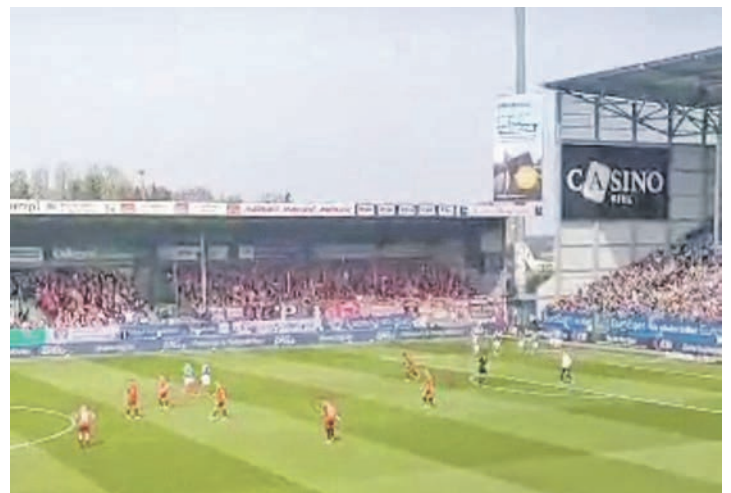
... die beim letzten Vergleich drei Punkte mitnahmen.

über die SG Oldenburg/Göhl immer weiter aus dem Abstiegsog frei, die Probsteier mussten beim 2:3 in Suchsdorf einen herben Rückschlag im Kampf um Platz zwei hinnehmen. Um 16.30 Uhr beendet die Spielgemeinschaft Sarau/Bosau mit dem Duell in Gremersdorf den Spieltag. Erst am Dienstag, 21. April, spielt ab 19.30 Uhr der Preetzer TSV seine Partie gegen die SG Oldenburg/Göhl; und noch einen Tag später geht das Spiel der SG Sarau/Bosau gegen den Suchsdorfer SV um 19.30 Uhr über die Bühne. In der VL Ost blickt man vor dieser Begegnung auf diesen aktuellen Stand: Siege für den SVG Pönitz und den Heikendorfer SV (2:1 gegen Eidertal/Molfsee). Damit