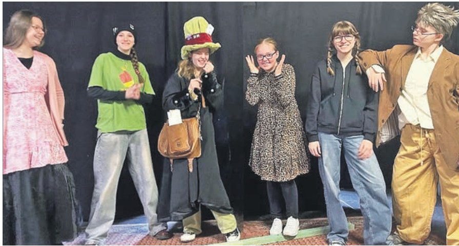
Die 2025 gegründete Jugendbühne präsentiert sich mit einer Neuinterpretation von „Alice im Wonderland“.