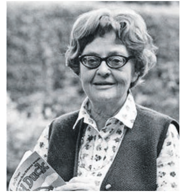
Comic-Übersetzerin Dr. Erika Fuchs ist die Erfinderin von Entenhausen.

restage haben. So ist Mary Shelley vor 175 Jahren gestorben und der Todestag von Agatha Christie jährt sich zum 50. Mal – und die große deutsche Carl Barks-Übersetzerin Dr. Erika Fuchs, die Erfinderin von Entenhausen, würde in diesem Jahr ihren 120. Ge-