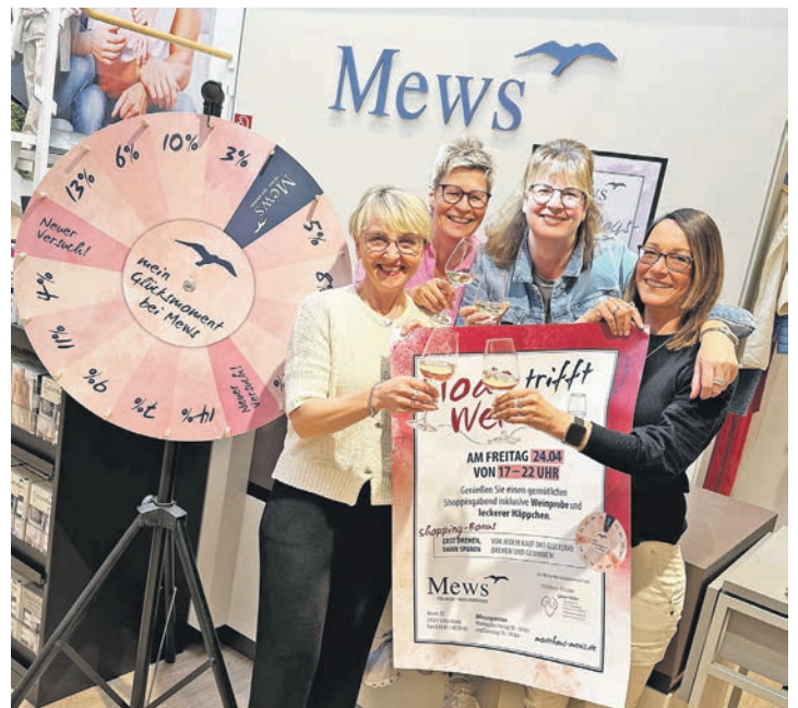
Das Team vom Modehaus Mews freut sich auf die Aktion „Mode trifft Wein“.