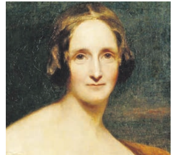
Mary Shelley ist die Autorin des Gruselromans „Frankenstein“.

Collaborate on new ideas Jetzt bewerben – schnell & unkompliziert!