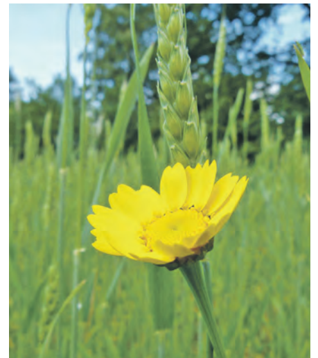
Auch für die Wucherblume gibt es Saatgut.

Seitdem hat sich die Idee zu einer Erfolgsgeschichte für den Erhalt der einheimischen Pflanzenvielfalt entwickelt. 7.000 Saat-Karten werden inzwischen vom Landesamt für Umwelt und der beteiligten Stiftung Naturschutz Schleswig-Holstein verteilt – 2024 waren es sogar 12.000!