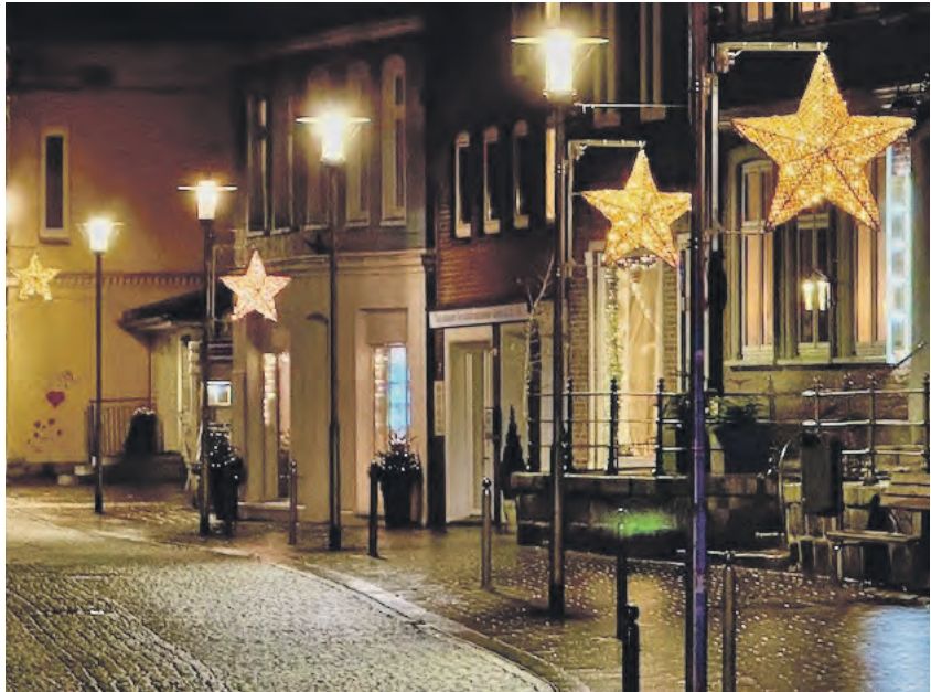
Die Stadtmarketing-Weihnachtsbeleuchtung war mit Hilfe durch die Stadt Plön eingeworbener Fördermittel beschafft worden.

Was also tun? Ob im Falle der Vereinsauflösung die Stadt Plön auch die Stadtmarketing-Weihnachtsbeleuchtung übernehmen will, steht erst einmal in den Sternen. „Das muss politisch diskutiert werden“, stellte die Bürgermeisterin klar. Auch mit Blick auf das, was die Stadt in dem Bereich bereits tue. Und „ob das im Verhältnis zum Haushalt möglich ist“, da die Stadt bereits viel Geld für die Weihnachtsbeleuchtung ausgeben. „Wir stehen ja auch so ziemlich mit dem Rücken an der Wand finanziell, das