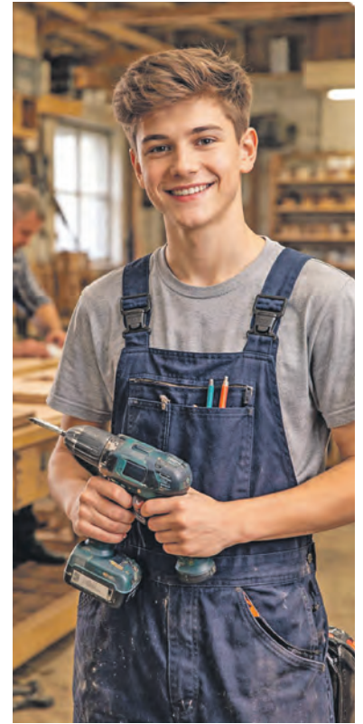
Über ein Praktikum zum Ausbildungsplatz: So findet das Handwerk Nachwuchs.

Schülerinnen und Schüler können sich in den Lehrstellenbörsen der Handwerkskammern Lübeck und Flensburg einen Überblick über mögliche Praktikumsbetriebe verschaffen oder sich auch direkt an die Beraterinnen der Passgenauen Besetzung wenden. Informationen und eine Weiterleitung zum Online-Antrag sind auf www.praktikumspraemie.de zu finden.