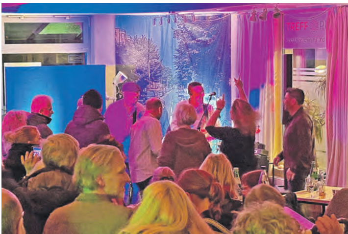
Bei der Kulturnacht im Februar herrschte im „Treff Preetz“ fast Ausnahmezustand. Die Livemusik zog viele Gäste an.

Nähere Informationen zu Projekt und Programm sind online auf www.treffpreetz.de im Internet zu finden.