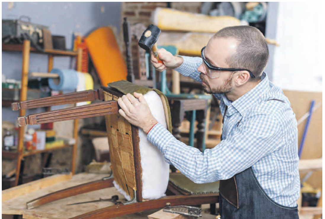
Die Polsterei Grau aus Erfde im Kreis Schleswig-Flensburg setzt auf traditionelles Handwerk. Weitere Bilder aus der Werkstatt sind bei GoogleMaps zu finden.

Die Polsterei Grau in Erfde – das liegt zwischen Rendsburg und Friedrichstadt – hat sich auf die fachgerechte Aufarbeitung von Polstermöbeln spezialisiert. Alte Lieblingsstücke und Erbstücke werden durch Aufpolsterung, Reparatur und Neubezug wieder in einen komfortablen und optisch ansprechenden Zustand versetzt. Zum Leistungsspektrum gehören unter anderem Garnituren, Sofas, Sessel, Stühle und Kücheneckbänke. Auch Wohnwagenpolster sowie Polster für Boote und Yach-