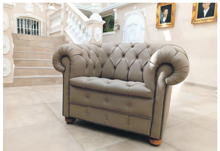
Von den Polster-Profis aufgearbeitete Möbel sind wirkliche Hingucker. Die Experten aus Erfde verstehen ihr Handwerk.

Kontakt zur Polsterei Grau, Süderende 9, in Erfde gibt es unter Telefon 04333-2970978 oder Handy 0176-30756195 sowie per E-Mail an polsterei-grau@gmx.de.