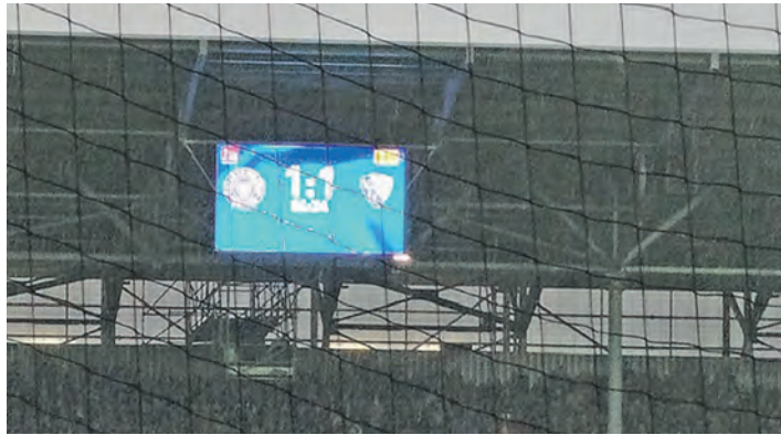
Sonntag wartet der VfL Bochum auf Holstein.

Kreis Plön (dif). „Bochum, ich komm´ aus dir“. Wenn am Sonntag, 22. März, kurz vor 13. 30 Uhr der Song von Herbert Grönemeyer aus den Stadionboxen für die KSV Holstein zu hören sein wird, weiß man, es geht gegen den VfL Bochum. Die Störche gastieren beim Bundesliga-Mitabsteiger, gegen den man in Kiel ein 1:1-Remis erreichte. Den Kieler Treffer erzielte damals der nun für die 2. VfL-Mannschaft aktive Louis Köster, der von Holstein bis zum Sommer ausgeliehen wurde. Hier geht es weiter um alles. Trotz einer guten ersten Halbzeit und einer Aufholjagd zum zwischenzeitlichen 2:2 reichte es auch gegen den 1. FC Nürnberg (2:3) erneut nicht zu Punkten. Die Lage wird immer bedrohlicher, zumal man auch unter Trainer Tim Walter kaum Besserung erkennen kann. Auch die sicherlich nicht allzu schlechte 2. Hälfte gegen den Club ist einfach in einer 2. Bundesliga zu wenig. So langsam verlieren auch die Treusten der Treuen, sprich die Anhänger in den Blöcken H und I die Geduld. Da macht es die Situation nicht besser, wenn nicht ein Spieler der KSV den Schneid besitzt nach Schlusspfeiff sich einmal mit den „Anhängern in der Kurve“ auszutauschen. Im-