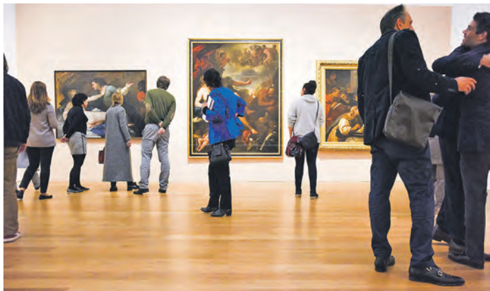
Europas spektakulärstes Kunstmuseum: Das „Barberini“ im Herzen von Potsdam ist sehr gefragt.

ges in Eutin – Montag bis Freitag von 9 bis 13 Uhr – unter Telefon 04521-701130 oder direkt online auf leserreisen.der-reporter.info möglich.