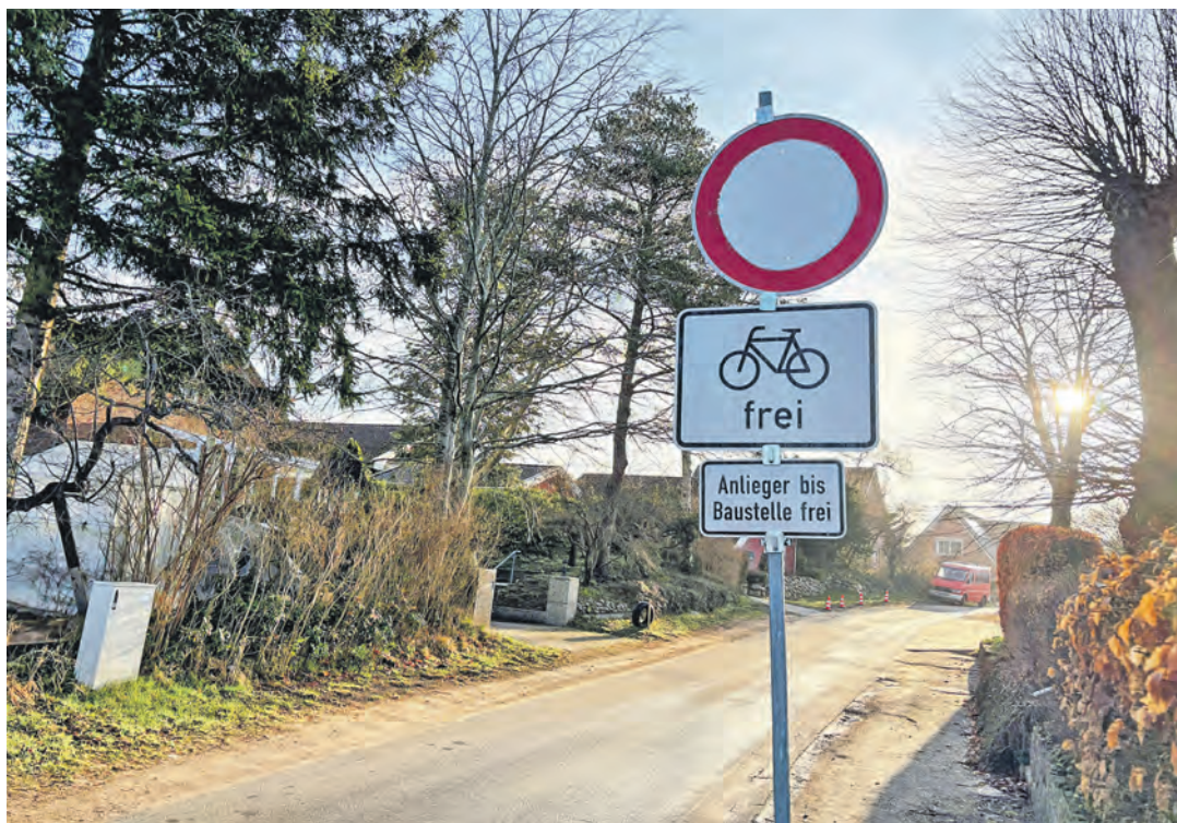
Seit Kurzem heißt es im Lassabeker Weg „Durchfahrt verboten“.