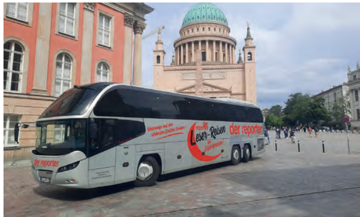
Welt-Kunst vom Feinsten erwartet die Leser in Potsdam und Berlin bei der großen Kunst-Sonderreise vom 27. bis 28. Juni.

Renoir, Degas, Cezanne sowie zahlreichen Werken von Max Liebermann. Bei beiden Museen gelangen die Leser*innen ohne Warteschlangen inklusive Eintritts zu festen Zeiten in die Ausstellungen. Residieren werden die Gäste der Sonderreise im internationalen First-Class-Hotel mit großzügigem Schlemmerfrühstück vom Buffet in der Schlösserstadt Potsdam in Best-Lage direkt am Templiner See mit Hallenbad