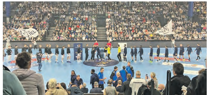
Wer wird der Gegner im Viertelfinale?

len. Mit dem THW kommt ein Gegner, den man an guten Tagen sicherlich schlagen kann. Stuttgart und der VfL Gummersbach sollten hier die Vorbilder sein. Für die Kieler ist klar: Einen weiteren Ausrutscher darf man sich nicht erlauben. In der Wunderino-Arena, die wegen eines neuen Sponsors ab April „Merkur Ostseehalle“ heißen wird und damit Erinnerungen an alte Zeiten weckt, spielt der THW