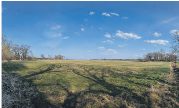
Landschaftspanorama mit den Resten einer alten Buranlage, einer Wallburg in der Gemeinde Blekendorf.

Kaum Herzog von Sachsen geworden, bot sich durch den plötzlichen Tod des Grafen Gottfried von Hamburg am 2. November 1110 für Lothar von Süpplingburg die Möglichkeit zur machtpolitischen Neuordnung Nordelbingens. Der ohne Erben verschiedene Gottfried hatte als Graf auf der herzoglichen Burg in Hamburg residiert. Lothar setzte im Jahr 1111 Adolf I. von Schauenburg als neuen Grafen ein. Dieser Adolf stand am – durchaus stot-