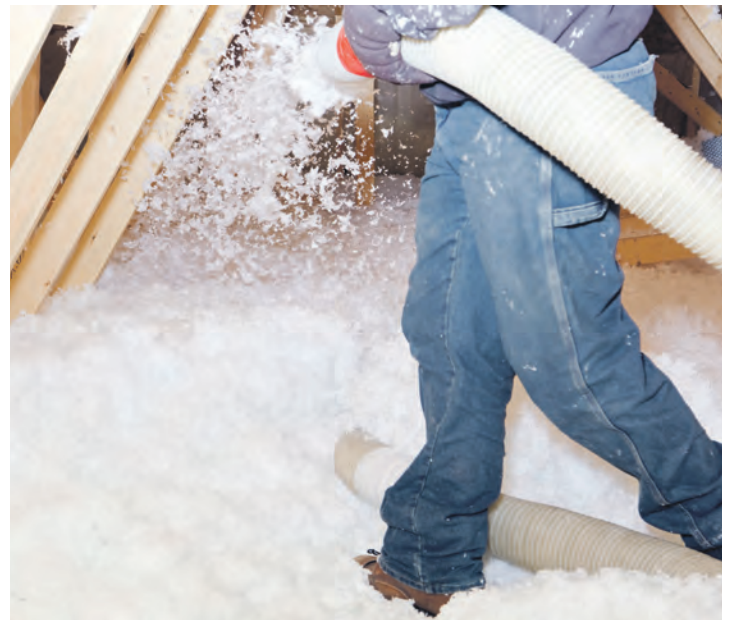
Für schwer zugängliche Bereiche wie zweischaliges Mauerwerk, Dachschrägen oder Hohlräume empfiehlt sich eine professionelle Einblasdämmung: Fachbetriebe füllen die Bauteile über kleine Öffnungen mit losen Dämmflocken aus Glas- oder Steinwolle schnell und lückenlos aus.

Hier kommt die sogenannte Einblasdämmung aus Glas- oder Steinwolle ins Spiel: Ein Fachbetrieb bringt dabei lose Dämmflocken aus Mineralwolle über kleine Öffnungen in die Bauteile ein. Die Flocken verteilen sich gleichmäßig in den Hohlräumen und füllen diese lückenlos aus. „Die Einblasdämmung mit Glas- oder Steinwolle ist zudem meist zeitsparend. Je nach Größe der zu dämmenden Fläche