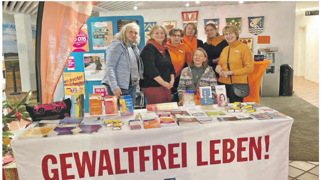
Die Gleichstellungsbeauftragten aus dem Kreis Plön sind auch wieder mit einem Infostand bei der Abschlussveranstaltung dabei.