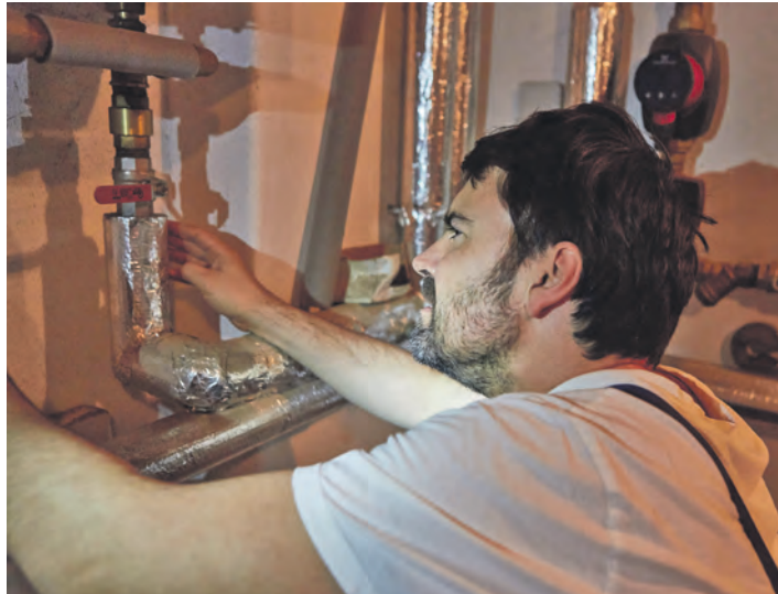
Heizungsrohre und Warmwasserleitungen lassen sich mit vorgefertigten Dämmschalen aus Mineralwolle schnell und einfach selbst isolieren – ideal für alle mit etwas handwerklicher Erfahrung.

Wer handwerklich etwas Erfahrung mitbringt, kann Heizungsrohre oder Warmwasserleitungen in unbeheizten Räumen mit