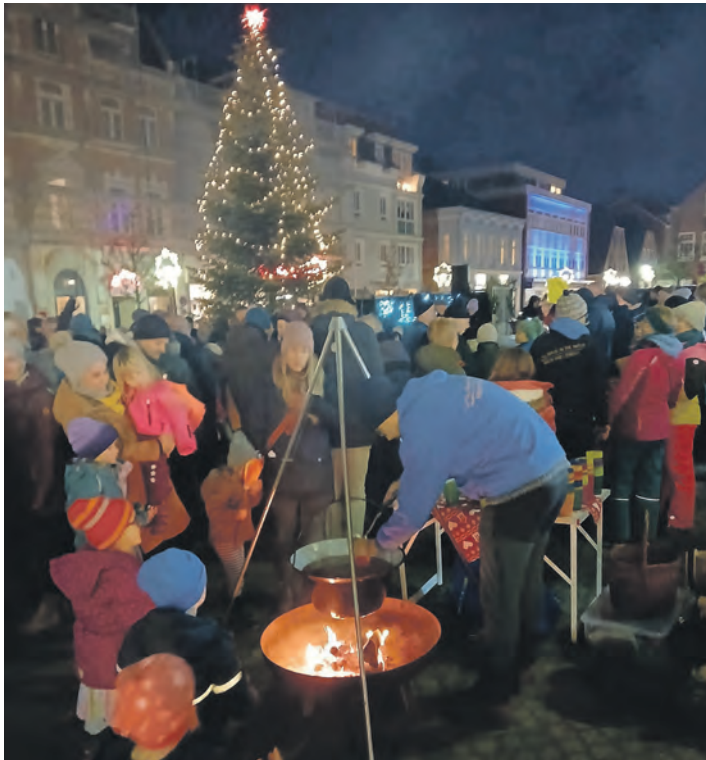
Rund um den Baum auf dem Preetzer Markt sorgen die „Wühlmäuse“ für Programm.