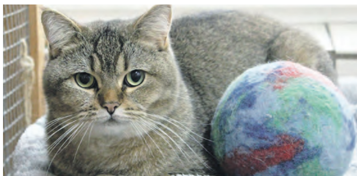
Kein Bösewicht: Kater Dr. No sucht ein neues, liebevolles Zuhause.

würde sich Dr. No auf jeden Fall freuen, doch noch wichtiger sind ihm eine große Couch, auf der er von seinen Dosenöffnern gestreichelt wird und natürlich ein gemütlicher Beobachtungs-Platz am Fenster. Wenn der verträum-