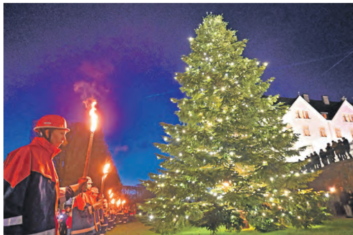
Die Fackelträger der Jugendfeuerwehr begleiteten die Aktion.