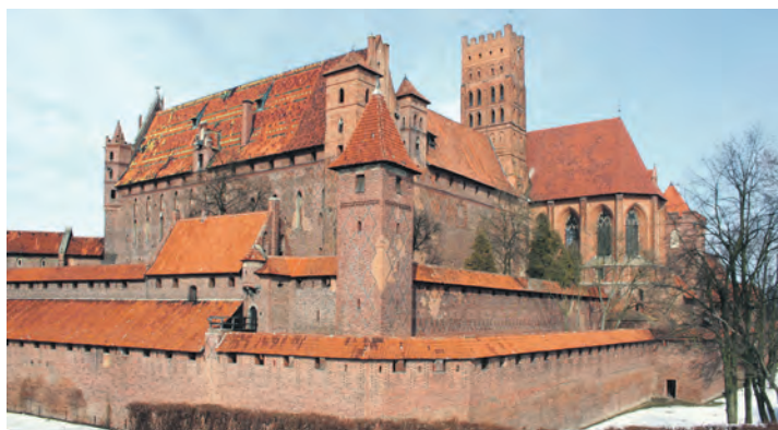
Die Marienburg des deutschen Ordens in Maribor bei Danzig.