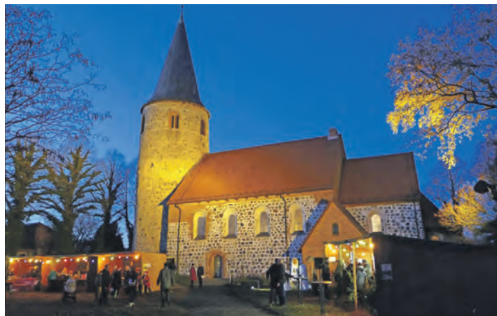
Weihnachtsidylle in Neukirchen: Die Feldsteinkirche St. Johannis wurde zu Vicelins Zeiten im 12. Jahrhundert erbaut.

Neukirchen (t/los). Mit einem Nikolausmarkt rund um die malerische alte Feldsteinkirche St. Johannis beginnt in Neukirchen, Gemeinde Malente, die Adventszeit. Es ist die 28. Auflage der Veranstaltung.