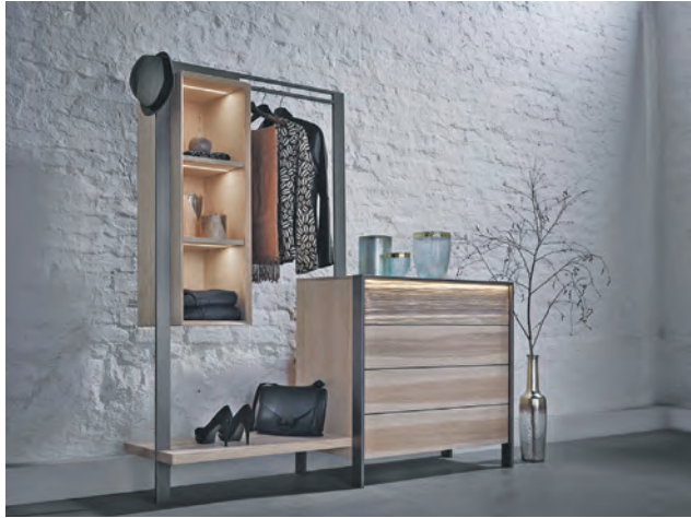
Dekorative Elemente sorgen für eine einladende Atmosphäre rund um die Massivholz-Garderobe.

Gerade im Winter müssen Garderoben und Schuhschränke einiges aushalten: Dicke Mäntel, Schals und Taschen bringen schnell 10 bis 15 Kilogramm Gewicht zusammen. Auch der Schuhschrank wird in der kalten Jahreszeit stärker beansprucht, wenn schwere Stiefel und Winteraccessoires verstaut werden. „Wer hier auf geprüfte Qualität setzt, hat langfristig Freude an seinen Möbeln, denn hochwertige Garderoben und Schränke halten auch intensiver Nutzung stand“,