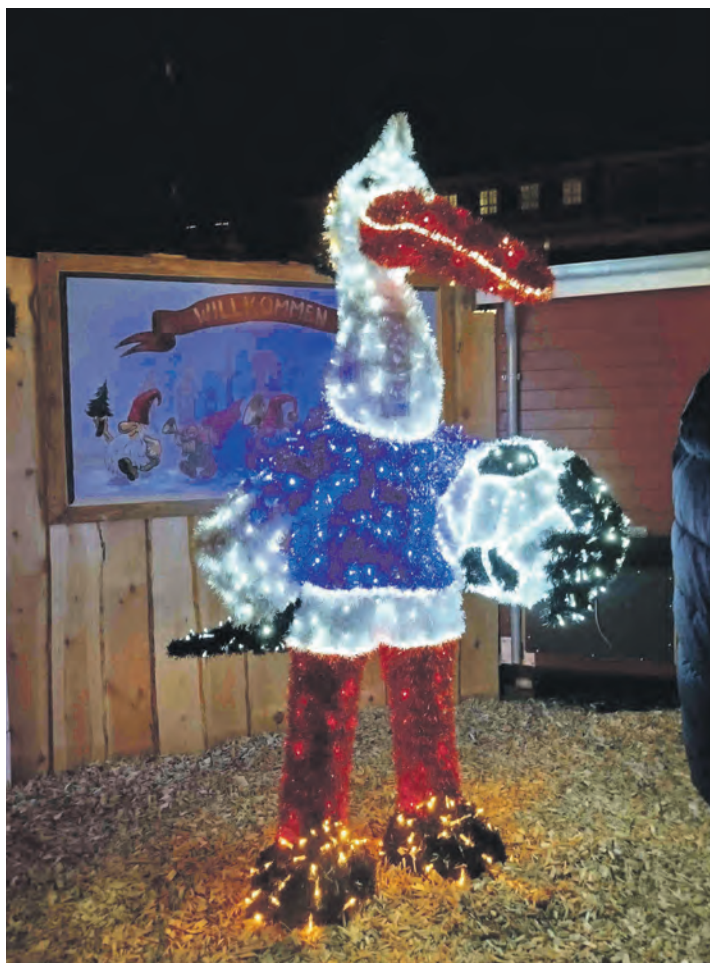
Nur Maskottchen „Stolle“ versprüht aktuell Glanz.

steigerränge eingreifen. Wir hoffen auf eine große Leistungssteigerung der Kieler und tippen für 29. November (13 Uhr) auf einen 1:0-Heimsieg. Was erwartet unsere Vereine in der Verbandsliga Ost? Hier macht der Preetzer TSV am Freitag, 18. November um 19.30 Uhr den Anfang mit einem Heimspiel gegen den MTV Dä-