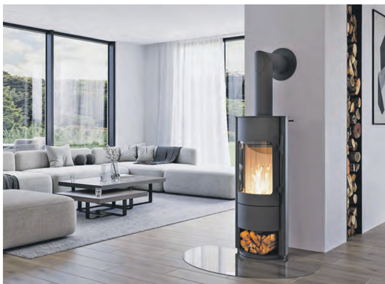
Die Basis für eine umweltschonende Verbrennung ist trockenes, unbehandeltes Holz.

Die Basis für eine saubere Verbrennung ist trockenes, unbehandeltes Holz. Frisch geschlagenes Holz enthält noch zu viel Feuchtigkeit und muss gespalten und anschließend an einem regensicheren Ort gelagert werden,