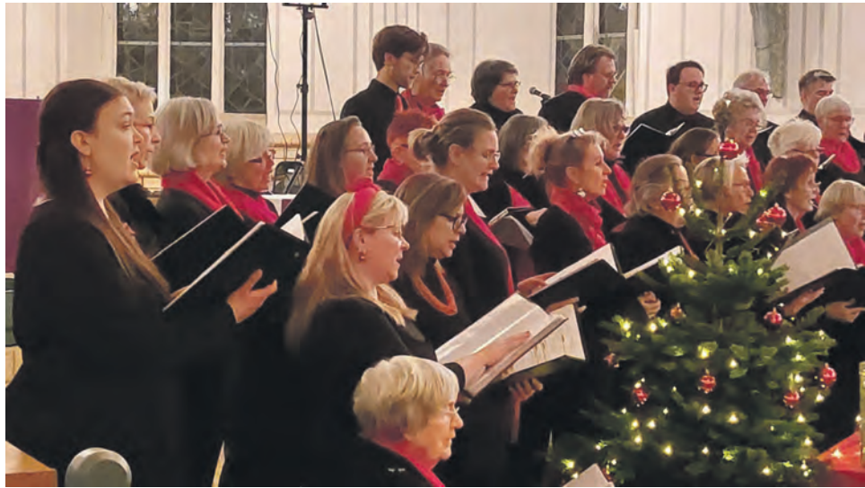
Der Gemischte Chor bittet zum vorweihnachtlichen Konzert.