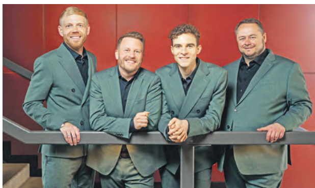
„Quartonal“ tritt in der Malenter Kirche auf.

Malente (t). Am Sonntag, 30. November, um 17 Uhr, gastiert das renommierte Männer-Vokalensemble „Quartonal“ in der Malenter Maria-Magdalenen-Kirche. Unter dem Motto „Das Jahr geht zu Ende“, verbunden mit Advents- und Weihnachtsliedern ist eine unterhaltsame Adventsmusik zu erwarten, die besinnlich und verschmitzt auf Weihnachten und den Jahreswechsel einstimmt. Der Eintritt ist frei, um vielen Menschen den Zugang zum Konzert zu ermöglichen. Um eine Spende am