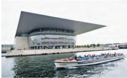
In Traumlage direkt am Hafen genießen die Leser eines der schönsten Opernhäuser der Welt.

Zum großen Leistungspaket der Leser-Reise gehören neben der Busfahrt die Fährpassagen mit den Scandlines-Großfähren auf der Vogelfluglinie von Puttgarden nach Rödby und zurück sowie