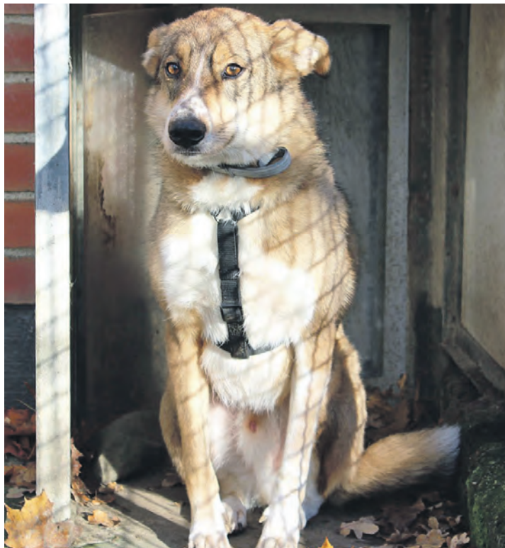
Ein süßer Knuddel: Mix-Rüde Hermann.

in die Länge, verharrte still und hob eine Pfote hoch. Kaum eine Sekunde später flatterte ein Fasan entrüstet in die Höhe. Anstatt hinterher laufen zu wollen, schaute Hermann nur triumphierend zu einem hoch und wartete, bis man sagte: „Komm, wir gehen weiter.“ Toll, wie sich der sympathische Kerl entwickelt hat! Nur manchmal, wenn er jemanden nicht kommen sieht, wirft er sich in alter Gewohnheit vorsichtshalber auf den Boden. Aber nur, um schnell wieder aufzuspringen, das Fell zu schütteln und nach vorne zu blicken. Herrman hat die beste Zukunft verdient – man sollte viel Zeit für ihn haben und ihm immer beistehen, damit sein Selbstbewusstsein weiter wachsen kann. Er ist ein toller Bursche und ein wahrer Herzenswärmer! Auch Katze Dr. No möchte endlich in ein neues Zuhause ziehen. Die Samtpfote ist ein Britisch Kurzhaarkater mit dichtem, graubraunem Fell. Er ist ebenfalls