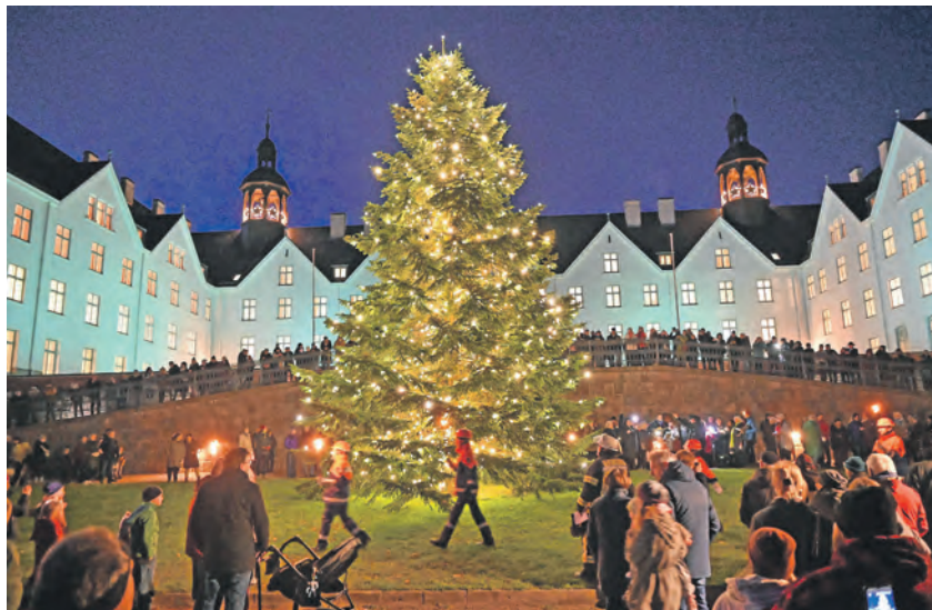
Stimmungsvolles Anleuchten 2024 am Plöner Schloss.

Das Anleuchten um 17 Uhr wird von den Chören Zwischentöne und dem Gemischten Chor Plön begleitet, die zum Mitsingen einladen – es liegen Liederzettel bereit, damit sich alle textsicher beteiligen können. Dann folgt ab 17.20 Uhr der allgemeine Aufbruch. Die Jugendfeuerwehr steht mit Fackeln bereit, um dem Umzug von der Schlossterrasse in die Innenstadt heimzuleuchten. Die Organisatoren regen an, sich für den Abend mit kleinen Laternen zu präparieren, um auch als