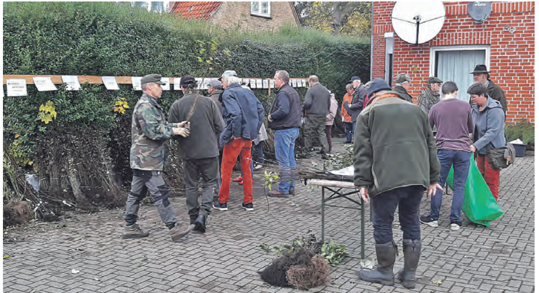
Auf dem Gelände des Plöner Autohauses Estorff können Interessierte wieder Sträucher und Bäume zu kleinen Preisen erworben werden.

Nicht fehlen darf natürlich der „Baum des Jahres 2025“: die Amerikanische Roteiche, gekürt insbesondere wegen ihrer Klimaresilienz. Der Baum ist für seine Schnellwüchsigkeit, Anpassungsfähigkeit an den Klimawandel und seine auffällige rote Herbstfärbung bekannt. Er wird als Ergänzung zu heimischen Baumarten insbesondere in der Forstwirtschaft diskutiert, ist aber aufgrund seiner Konkurrenzfähigkeit zu heimischen Eichen auch umstritten. Untersuchungen zeigen, dass sich die im Stammbereich lebenden Insektengemeinschaften kaum von denen der Stieleiche unterscheiden. Sie gilt als bedeutendste eingeführte Laubbaumart. Das weitere Angebot stammt aus heimischer Produktion und umfasst „Renner“ wie Hainbuche, Liguster, Hasel und Feldahorn aber auch seltenere Arten wie Wildrosen, Wildobst