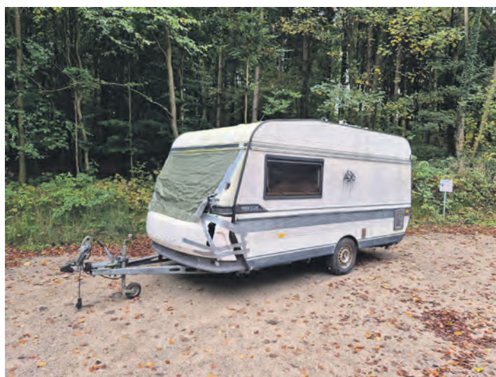
Abfallentsorgung im Ruheforst: einer der beiden schrottreifen Wohnwagen.

lizeireviere Plön fertigten eine Anzeige wegen unerlaubter Abfallentsorgung. Die Fahndung sowohl nach den Verursachern als auch nach den letzten Besitzern