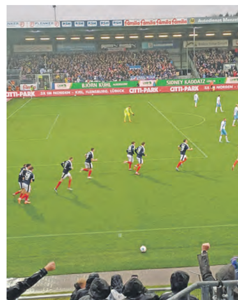
Eine starke Choreo der Holstein-Fans.

Verbandsliga Ost geht es weiter. Hier ist die Staffel beim 15. Spieltag angekommen. Unsere Vereine haben folgende Aufgaben vor sich: Am Freitag, 31. Oktober, geht es um 19.30 Uhr mit der Partie Preetzer TSV gegen den TSV Plön in der Schusterstadt los. Zu gleicher Zeit muss die SG Sarau/Bosau nach Eidertal reisen. Hier sind die Favoritenrollen deutlich an Preetz und die Spielgemeinschaft vergeben. Am Samstag ist kurioserweise kein Verein aus