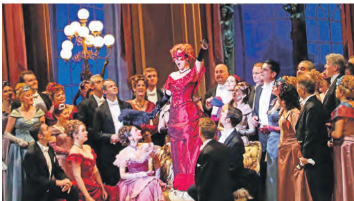
Mit der „Fledermaus“ erwartet die Leser ein opulentes Musikvergnügen mit großartiger Ausstattung und der Sächsischen Staatskapelle.

Zum großen Leistungspaket der Weekend-Sonderreisen gehören neben der Fahrt im erstklassigen Fernreisebus ab Preetz und Plön zwei Übernachtungen im Komfort-Hotel in Best-Lage direkt an der Altstadt und damit in der Nähe der Semperoper, zweimal großes Schlemmerfrühstück vom Buffet sowie eine große Stadtführung/Stadtrundfahrt Dresden mit perfekter Reiseleitung und die Eintrittskarte für die „Fledermaus“ (Höherwertige Karten in allen Kategorien buchbar). Am