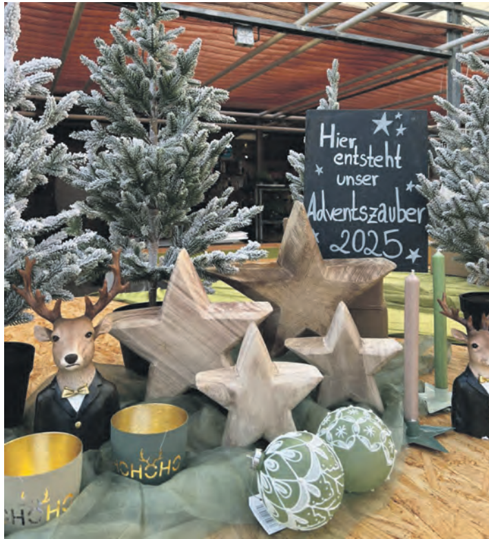
Die Gärtnerei Langfeldt in Lütjenburg lädt ein zum stimmungsvollen Lichterfest.