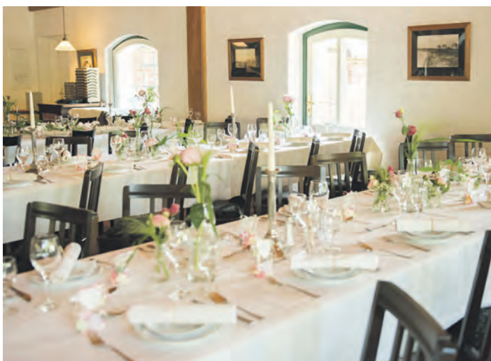
Ab November stehen Räumlichkeiten im Landgasthof Kasch als Veranstaltungsort für Kaffeetafeln, Trauerfeiern, Familienfeiern und Seminare zur Verfügung.

Weiterhin geöffnet ist das Gasthaus aber für Übernachtungen mit Frühstück, die weiterhin gebucht werden können. Montags bis donnerstags von 8 bis 10 Uhr sowie freitags bis sonntags von 8 bis 11 Uhr ist ein Frühstücksbuffet angerichtet. Hierfür werden gern Reservierung entgegen genommen. Ab dem 1. November stehen Räumlichkeiten als Veranstaltungsort für Kaffeetafeln, Trauerfeiern, Familienfeiern und Seminare zur Verfügung. Für Beratung und Planung wendet man sich einfach direkt an das Kasch-Team. Für die festlichen Tage hat der Familienbetrieb ein tolles Angebot aufgelegt: „Weihnachten außer Haus“ wird zum kulinarischen Erfolg, wenn man auf Kasch-Qualität setzt: „Wir haben für Sie gekocht und mit nur wenigen Handgriffen können Sie Ihr Weihnachtsessen zu Hause servieren“, erklärt Anja Kasch. Natürlich kann man das Fest auch direkt vor Ort im idyllischen Landgasthof genießen. Am 25. und 26. Dezember lockt eine kleine weihnachtliche Karte. Für Inspiration in Sachen Ernährung sorgen die Gesundheitstage, vollwertige Weihnachtsbäckerei- und Brotbackkurse, Kochabende, Fastenwochen, Urlaube mit Vollpension Plus (inklusive vitalstoffreiche