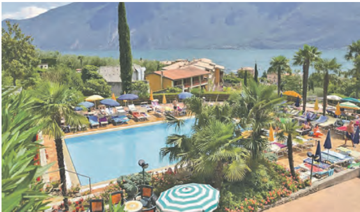
In traumhafter Lage in Limone am Gardasee erwartet das First-Class-Hotel unsere Leser*innen.

Anmeldungen sind ab sofort möglich bei den Leser-Reisen des Burg-Verlages in Eutin, täglich von 9 bis 13 Uhr, unter Telefon 04521-7011-30 oder direkt im Internet unter „leserreisen.der-reporter.info“.