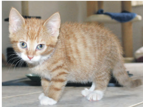
Wer nimmt diese Kätzchen im Doppelpack: Balu ...

Kleinen über Wochen, kommt man aus dem Staunen nicht mehr heraus. Unglaublich, wie früh sie auf die Katzenttoilette gegangen sind, obwohl sie noch nicht mal über den Klorand schauen konnten. Wie kleine Bergsteiger hieften sie sich nach oben, um ihre Geschäfte zu erledigen. Um danach erleichtert und voll motiviert wieder ihren Flausen nachzugehen. Selbst die gute Muttermilch wurde schon nach kurzer Zeit verschmäht. Extrem früh saßen Luna und Balu am großen Napf mit Katzenfutter und hauten sich laut schmatzend das Essen rein. Erstaunlich, wie viel Futter in so einen kleinen Zwerg passt! Wahrscheinlich wachsen sie deshalb so schnell ... Luna, Balu und die anderen Kleinen sind schon zu sehr unternehmungslustigen Minitigern geworden. Zum Glück haben sie viele Kratzbäume, Tonnen, Höhlen und andere interessante Bauten in ihrem Zimmer, so dass es nie langweilig wird. Als sich Luna und