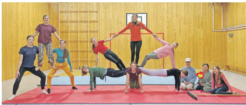
Die Jugendlichen sind bereit für ihren großen Auftritt.

im Sommer und Herbst erlernt und vertieft. Akrobatik, Diabolo, Einrad, Seiltanz, Jonglage, Schauspiel – das sind nur einige der Zirkuskünste, die in den Gruppen trainiert werden. Die Vielfalt des Könnens wird jetzt bei der Jahresaufführung deutlich. Der Eintritt zum Zirkusspaß ist auf Spendenbasis, in der Pause werden unter anderem Getränke, Kuchen und Zuckerwatte verkauft. Die Show dauert ungefähr zweieinhalb