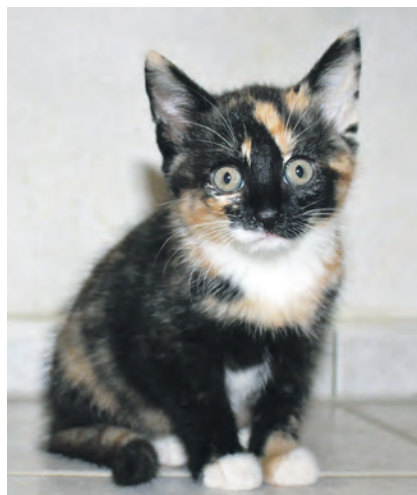
... und Luna suchen ein Zuhause mit Garten.

Wer sich nun für Luna und Balu im Doppelpack interessiert, ruft einfach unter Telefon 04522-2389 an. Auf der Internetseite www.tierheim-kossau-ploen.de findet man weitere Infos rund um das Tierheim und seine putzigen Bewohner