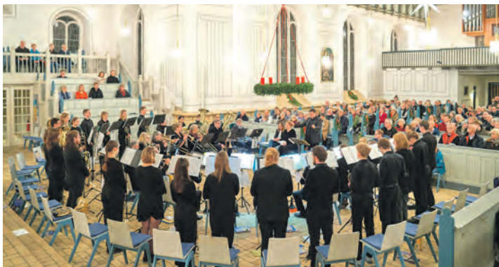
In der Nikolaikirche Plön treffen sich die Bläserinnen und Bläser der Nordkirche.