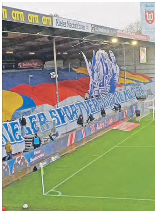
Louis Köster traf zum Remis.