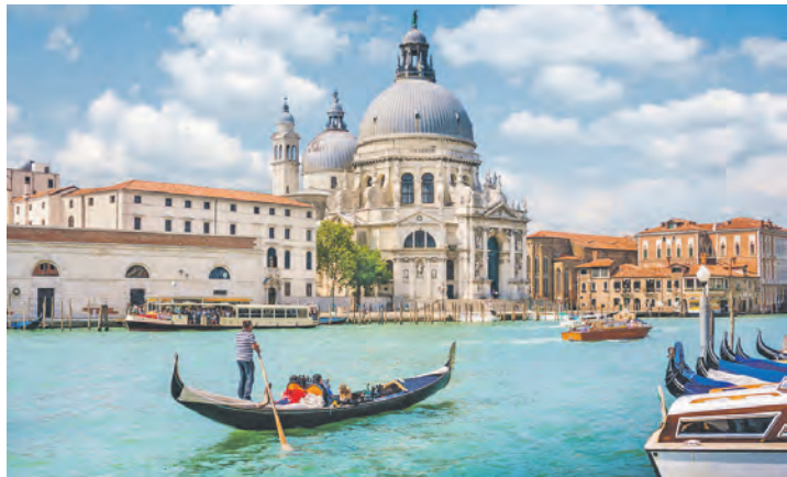
Eines der attraktiven Ausflugsziele der Gardasee-Reise ist die weltberühmte Lagunenstadt Venedig.

Zum großen Leistungspaket der Sonderreise gehören neben der Fahrt im erstklassigen Fernreisebus direkt ab Eutin ohne weitere Einsammeltour je eine Zwischenübernachtung/Halbpension in Bayern auf der Hin- und Rückreise, vier Übernachtungen im First-