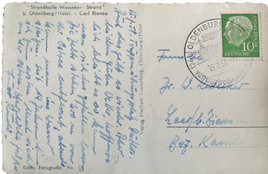
Echte Fotografie. Nr. 18

Lesen Sie den reporter auch auf www.derreporter.com