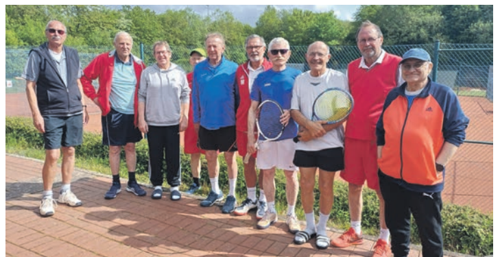
Die Herren 70 aus Lütjenburg mit ihren Gästen aus Garstedt.

Gerade noch rechtzeitig konnte die Begegnung beendet werden, bevor ein heftiger Platzregen die Tennisplätze unter Wasser setzte. Nach dem sportlichen Teil klang der Tag in geselliger Runde aus. Bei einem ausgezeichneten Grillbuffet wurde noch lange über die einzelnen Matches diskutiert, ehe sich die Gäste am frühen Abend verabschiedeten. Die nächste Gelegenheit für einen stimmungsvollen Tennistag auf der Anlage in der Kieler Straße gibt es am Samstag, 30. Mai, ab 14 Uhr. Dann bestreiten die Lütjenburger Damen 30 und die Damen 40 ihre nächsten Heimspiele.