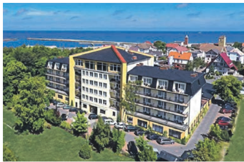
In Top-Lage am Meer befindet sich das exklusive Verwöhn-Hotel „Lidia“ an der Pommerschen Bernsteinküste.

paket gehören neben der Fahrt im erstklassigen Fernreisebusdirekt ab Oldenburg, Lütjenburg und Lensahn vier Übernachtungen im 4-Sterne-Top-Hotel Lidia mit sehr großzügigen und reichhaltigen Schlemmer-Buffets zum Frühstück und Abendessen, die kostenlose Benutzung der großen Wellness-Abteilung mit zwei Schwimmbädern, Whirlpool, Dampfbad & Außen-Whirlpool sowie einer Flasche Wasser zur Begrüßung auf dem Zimmer, eine große Panorama-Rundfahrt mit Reiseleitung „Auf den Spuren des Bernstein“ mit Abstecher in