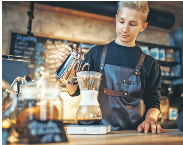
Kaffee – in welcher Variante auch immer - gehört in Deutschland zu den beliebtesten Getränken. Es gibt zudem einige Hinweise auf positive Wirkungen für die Gesundheit.

Für alle, die sich gerne bewegen, gilt allerdings: Sport belastet das Herzkreislaufsystem, und Koffein kann diese Belastung erhöhen. Deshalb ist es besser, Koffein beim Sporttreiben vorsichtig zu dosieren. Weitere Infos zum Thema zuckerfreie Ernährung im Gesundheitsmagazin unter aok.de Stichwort ‚Ernährung‘.