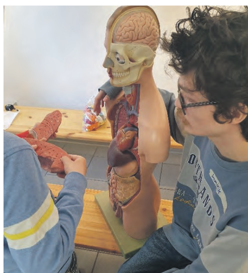
Eine Organnachbildung in fast Lebensgröße einmal in der Hand zu haben war für jeden Schüler möglich.