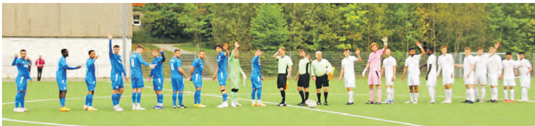
Der TSV Lensahn ging optimistisch in das Match gegen den TSV Lütjenburg.