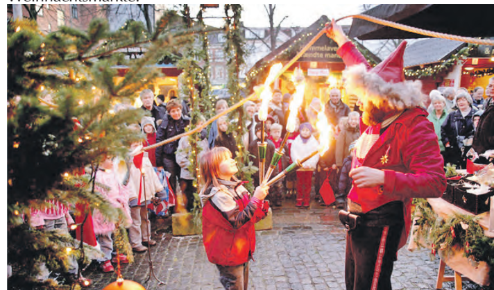
Skandinavische Weihnachtsmärkte mit viel „Hygge“ erwarten unsere Leser:innen in Malmö und Kopenhagen.

Am 2. Tag haben die Leser:innen sodann drei Stunden Zeit zum Shopping-Bummel oder zum Besuch der Weihnachtsmärkte auf der dänischen Seite des Öresunds in der prachtvoll geschmückten