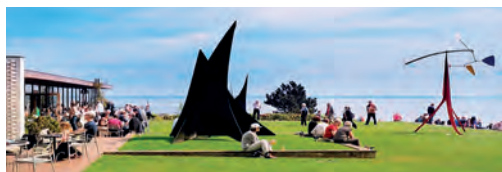
Kunst-Museum „Louisiana“ in einmaliger Lage am Öresund