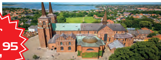
Wikinger-Dom Roskilde: UNESCO-Welt-Kulturerbe & Königsgräber