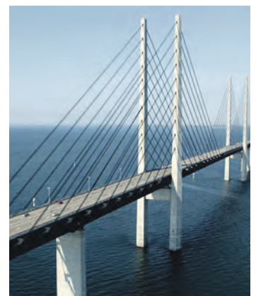
Top-Erlebnis der Reise: Die zweimalige Passage der weltbekannten Öresund-Brücke zwischen Schweden und Dänemark.

Hauptstadt Kopenhagen, bevor die Rückreise am Nachmittag in die Heimatorte erfolgt. Anmeldungen sind ab sofort möglich bei den Reporter-Leser-Reisen des Burg-Verlages in Eutin, täglich von 9 bis