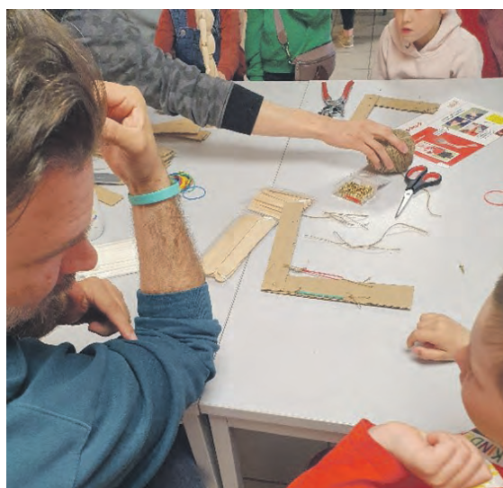
Ein angehender Erzieher erklärt einem Kursteilnehmer an einer einfachen Pappkonstruktion die Wirkungsweise von Beugern und Streckern.