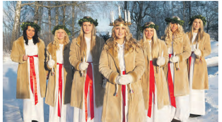
Den großen Lucia-Festumzug in Malmö genießen unsere Leser:innen zum traditionellen schwedischen Lichterfest.

Großfahrten der Vogelfluglinie von Puttgarden nach Rödby und zurück sowie die zweimalige Passage der gewaltigen 16 kilometerlangen Öresund-Brücke zwischen Kopenhagen und Malmö auf der Hin- und Rückreise, sodann eine Übernachtung im superzentralen Komfort-Class-Hotel in Malmö im Herzen der Altstadt mit großem skandinavischem Schlemmer-Frühstück vom Buffet und das Komplett-Programm zum Lucia-Fest in Malmö sowie viel Freizeit zum Stadt- und Shopping-Bummel in Malmö und zum Besuch der Weihnachtsmärkte.