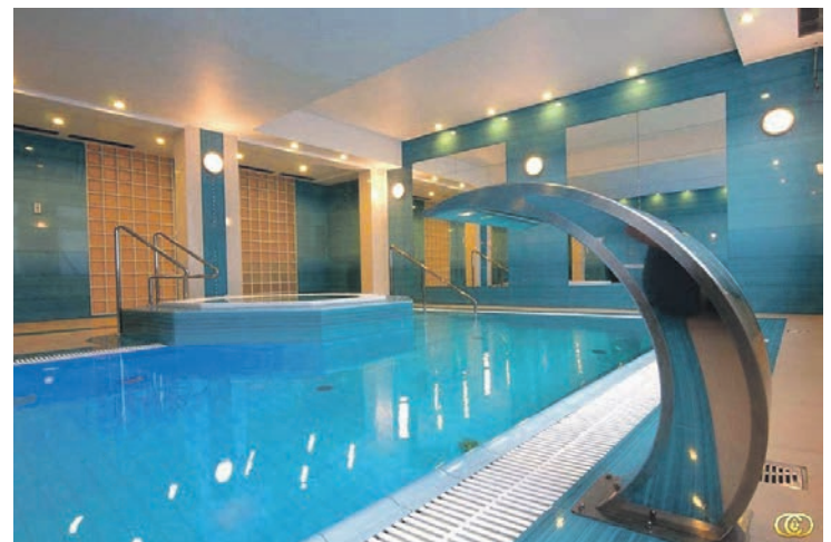
Herrliche Entspannung bietet das sehr schöne Hallenbad im Hotel.