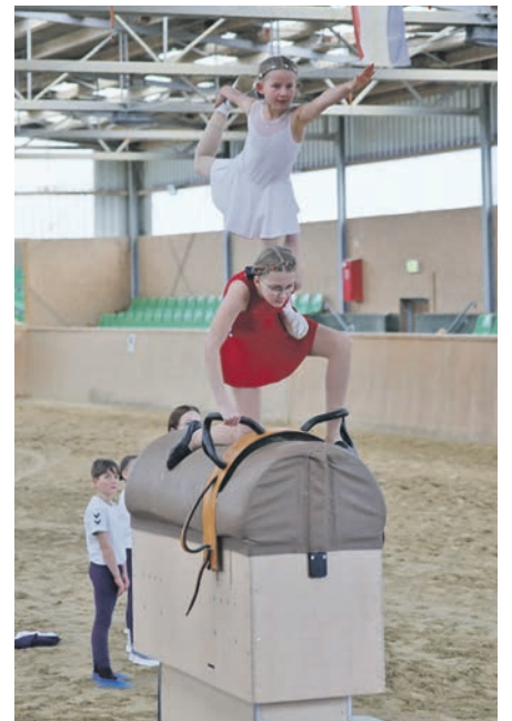
Die Voltigiergruppe faszinierte das Publikum am Samstag mit Vorführungen auf dem Voltigiersimulator.