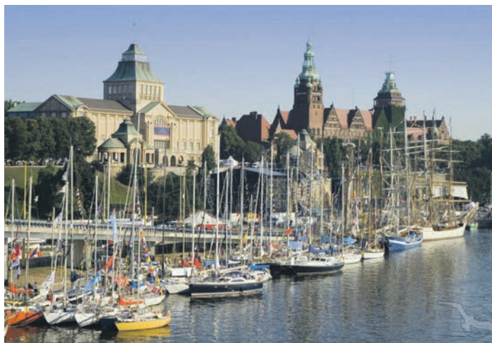
Die alte Hansestadt Stettin entdecken unsere Leser:innen mit Freizeit zum Bummeln.

Lesen Sie den reporter auch auf www.derreporter.com