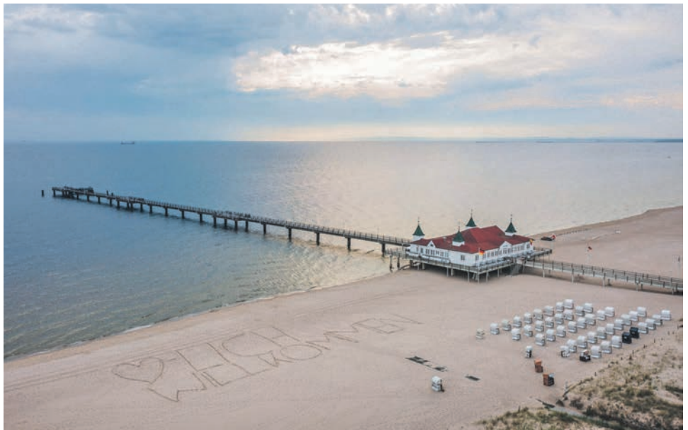
Deutschlands sonnenreichste Ostsee-Insel erwartet die Leser:innen zum Top-Termin des Jahres im zum einmaligen Jubiläumspreis.

Oldenburg/Lensahn/Lütjenburg (t). Grenzenlos schlemmen und genießen können unsere Leser:innen bei der großen Jubiläums-Verlags-Sonder-Reise direkt ab Oldenburg, Lensahn und Lütjenburg zum Top-Sommer-Termin vom 11. bis 14. Juli 2026 auf Deutschlands sonnenreichsten Ostsee-Insel Usedom mit den schönsten Stränden im Ostseeraum für vier Tage zum einmaligen Superpreis von nur 299,90 Euro (Einzelzimmer + 99,00 Euro) inklusive Unterkunft im zentralen Komfort-Hotel mit Hallenbad in Swinemünde mit reichhaltiger Halbpension mit Buffets zum Frühstück und Abendessen und unserem großen Entdecker- und Genießer-Programm, das im Reisepreis bereits mit enthalten ist. Zum großen Leistungspaket der Sonder-Reise gehören neben der Fahrt im erstklassigen Fernreisebus ab Oldenburg, Lensahn und Lütjenburg drei Übernachtungen im komfortablen Kur-Hotel mit großem Hallenbad und Whirlpool mit stilvollen Komfort-Zimmern mit DU/WC, TV etc., 3x großes Schlemmer-Frühstück vom Buffet sowie 3x Abendessen im Hotel als Buffet. Zum großen Leistungspaket gehört am 2. Tag eine große Insel-Rundfahrt Usedom unter dem Motto „Noble Kaiserbäder“ mit Ahlbeck, Heringsdorf, Bansin. Am 3. Tag entdecken unsere Gäste bei einer großen Panorama-Fahrt gegen Aufpreis von 19,90 Euro die weltbekannte Bernstein-Insel Wollin als