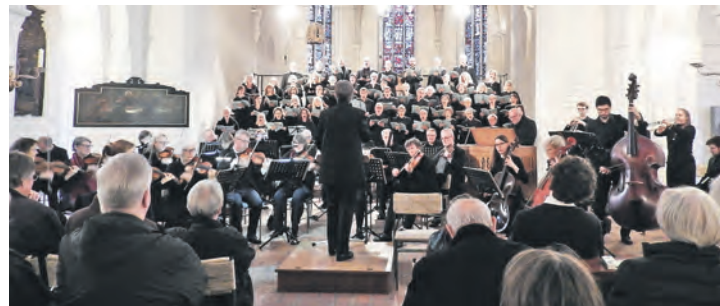
Die großen Aufführungen mit Solisten und Orchester sind für die Kantorei und Publikum Höhepunkte des Chorjahres.

der Einstieg ist jederzeit möglich. Termine für Nordic-Walking und Radfahren werden gesondert festgelegt, ein Schwimmnachweis muss von jedem Teilnehmer erbracht werden. Die Teilnahme am Sportabzeichentraining ist kostenlos und nicht von einer Mitgliedschaft im Sportverein abhängig. Menschen mit und ohne Behinderung können das Deutsche Sportabzeichen ablegen und auch für Gruppen oder Firmensport kann es ein Anreiz sein. Nähere Informationen bekommen Interessierte beim PSV Eutin oder per E-Mail an elke.kock@gmx.de