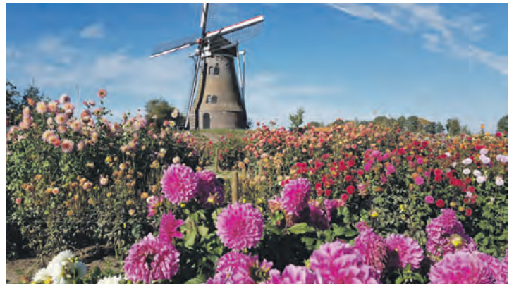
Europas größtes Blüten-Fest im Spätsommer erwartet die Gäste mit dem Dahlien-Fest in Holland.

ein weltweit einmaliges Dorf ohne Straßen mit nur Grachten und historischen Bauernhöfen auf 170 Torfinseln. Am zweiten Tag geht es weiter mit einer Fahrt durch die blühenden Dahlien-Landschaften mit Besuch und Führung beim Dahlienzüchter inklusive Eintritt mit mehr als 600 Dahlienarten mit einmaliger Arten- und Farbvielfalt und der