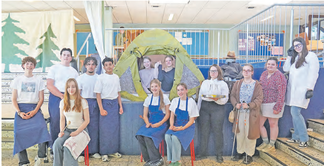
Das Team der Schule an den Auewiesen wird einen köstlichen Krimi servieren – und leckeres Essen gibt es auch.

Während hinter der Bühne die Schauspieler schwitzen, dürfen im Restaurant die Gäste feine Speisen genießen, die der Abschlussjahrgang kredenzt. Die Vor- und Nachspeise wird dabei ausschließlich von den Schüler*innen zubereitet, das Kochen der Hauptspeise über-