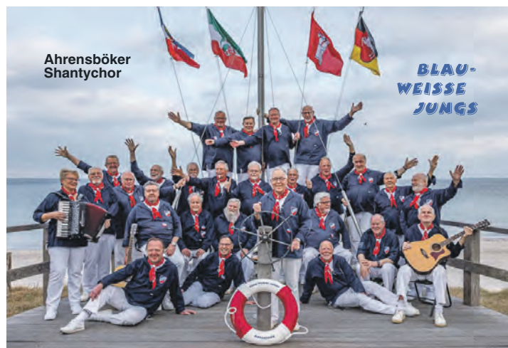
Die „Blau-weißen Jungs“ treten in Timmendorfer Strand auf.