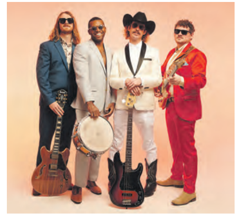
Einer der renommierten Acts ist die Band „Deltaphonic Press“.

So werden insgesamt 13 Programmpunkte verschiedenster Stilrichtungen angeboten, wobei die namhaften Künstler aus neun Nationen kommen. Inhaltlich wird Blues und bluesverwandtes zwischen Tradition und Moderne geboten. Insbesondere die jungen, frischen und modernen Crossover dürften nicht nur Bluesliebhaber begeistern