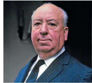
Krimi-Altmeister Alfred Hitchcock.

Weitere Infos zum Programm sowie zum Kartenvorverkauf, der unter anderem bei der Tourist-Info Eutin erfolgt, sind online auf www.hitchcock-days.de erhältlich. Unterstützt werden die Hitchcock-Days erneut von der Sparkasse Holstein und ihren Stiftungen, den Stadtwerken Eutin sowie dem KulturOrtNord