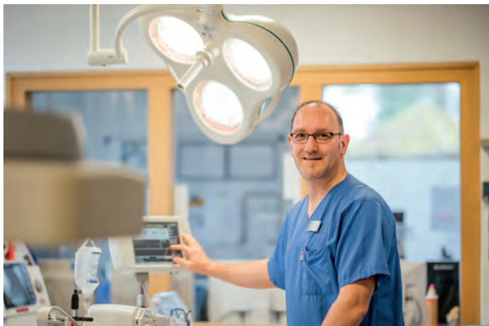
Das AMEOS Klinikum Eutin wirbt gezielt um Medizinische Fachangestellte.

Das AMEOS Klinikum Eutin in der Hospitalstraße lädt alle Interessierten ein, sich ein eigenes Bild zu machen, neue berufliche Wege zu entdecken und die Arbeit im Krankenhaus live zu erleben.