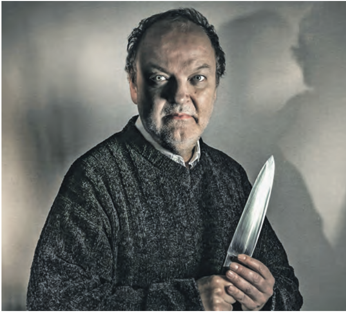
Präsentiert eine sehr atmosphärische Lesung: Schauspieler und „Drei ???“-Sprecher Jens Wawrczeck

Ein zentraler Bestandteil der Hitchcock-Days sind die Spielfilmabende im Binchen-Kino. Gezeigt werden die vier Spätwerke des Regisseurs: „Der zerrissene Vorhang“, „Topas“, „Frenzy“ und „Familiengrab“. Darüber hinaus setzt das Festival auf kreative Formate jenseits der klassischen Filmvorführung. Bei „Jazz & Crime“ am 12. September im Kulturbahnhof verbinden sich Livemusik und kriminelle Kurzgeschichten zu einem