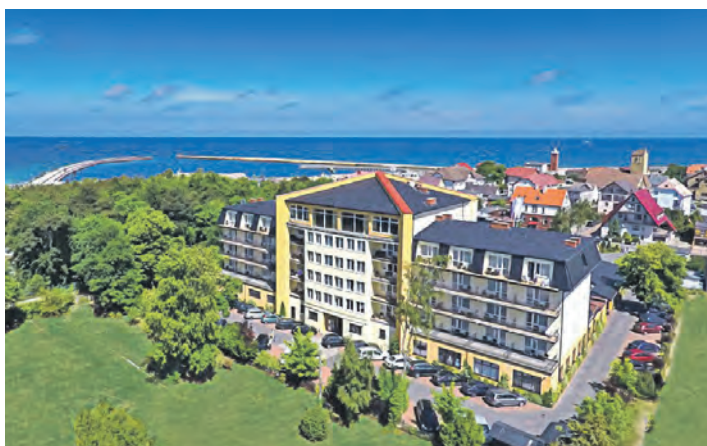
In Top-Lage am Meer befindet sich das exklusive Verwöhn-Hotel „Lidia“ an der Pommerschen Bernsteinküste.

Zum großen Leistungspaket gehören neben der Fahrt im erstklassigen Fernreisebusdirekt ab Eutin ohne weitere Einsammeltour vier Übernachtungen im Vier-Sterne-Top-Hotel „Lidia“ mit sehr großzügigen und reichhaltigen Schlemmerbuffets zum Frühstück und Abendessen, die kostenlose Benutzung der großen Wellness-Abteilung mit zwei Schwimmbädern, Whirlpool, Dampfbad und Außen-Whirlpool sowie einer Flasche Wasser zur Begrüßung auf dem Zimmer,