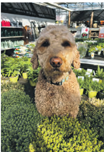
Goldendoodle Kalle nimmt im Pflanzencenter neugierig das Kräuterangebot unter die Lupe – jetzt beginnt endlich die Gartensaison.

gelten als sogenannte Starkzehrer und benötigen eine besonders nährstoffreiche Versorgung, um sich gut zu entwickeln. Geöffnet ist montags bis freitags von 9 bis 18 Uhr sowie am Sonntag von 11 bis 16 Uhr und am Wochenende ist das „Café Orchidee“ von 11 bis 16 Uhr geöffnet und lädt mit frischen Waffeln zu einer kleinen Pause ein.