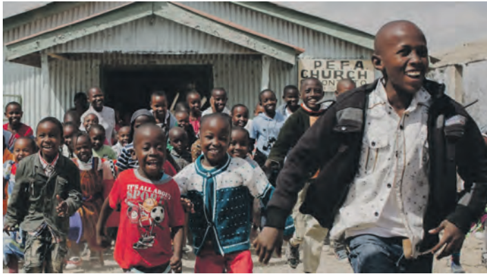
Die Spenden werden für Projekte in Südafrika gesammelt.

Unter dem Motto „Gutes tun, für sich und andere!“ sind Walker, Läufer und Fußgänger eingeladen, eine rund 6 Kilometer lange Strecke über Kies- und Waldwege zu absolvieren. Start und Ziel liegen vor dem Gemeindehaus der Christlichen Gemeinschaft Malente in der Königsberger Straße 38, der gemeinsame Start ist für 11 Uhr angesetzt. Eine vorherige Anmeldung ist nicht erforderlich; es genügt am Veranstaltungstag in entsprechender Kleidung vor Ort zu sein, um gemeinsam auf die ausgewiesene Route zu gehen. Das Startgeld beträgt mindestens 10 Euro pro Person, auf Wunsch kann auch mehr gegeben werden. Wie die Christliche Gemeinschaft Malente mitteilt, fließt der