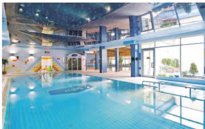
Herrliche Entspannung bietet die große Wellness- und Schwimmbad-Abteilung des Hotels Lidia.

eine große Panorama-Rundfahrt mit Reiseleitung „Auf den Spuren des Bernstein“ mit Abstecher in den bekannten Slowinski-Nationalpark sowie gegen Aufpreis von nur 15 Euro eine Ostseeküsten-Rundfahrt mit fachkundiger Reiseleitung mit Besuch im weltbekanntesten Seebad Kolberg und in der historischen Perle Köslin mit großer Geschichte. Als Höhepunkt des Ausflugsprogrammes kann gegen Aufpreis von nur 29,90 Euro ein großer Tagesausflug mit fachkundiger Reiseleitung „Auf den Spuren der Hanse“ mit fachkundiger Reiseleitung in die Hansestadt Danzig mit Stadtführung und Freizeit