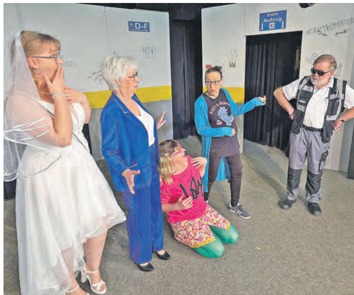
Auch die Niederdeutsche Bühne Süsel beteiligt sich am Theaterfestival. Ihr aktuelles Stück heißt „Tussipark“.

spielen vom Theater Lübeck. Unter der Moderation von Carina Dawert (NDR 1 Welle Nord) erwartet das Publikum ein bunter Mix aus Sketchen, Musik und exklusiven Einblicken in die Festival-Produktionen. Als besonderes Highlight ist auch Stargast Werner Momsen wieder mit von der Partie. Tickets für die Gala gibt es online auf www.theaterluebeck.de . Karten für alle weiteren Termine sind direkt bei den jeweiligen Bühnen erhältlich. Unter anderem beteiligen sich auch die Niederdeutschen Bühnen aus Kiel, Preetz und Süsel an dem Festival. Infos zum Programm sind auf www.theaterfestival-op-platt.de zu finden.