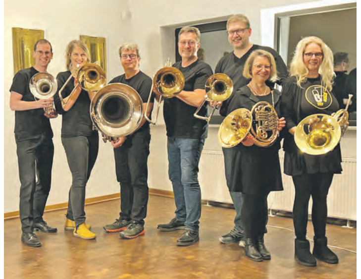
Die Ensemble-Mitglieder von „Tiefblech“ sind in Vorfreude auf die kommende Abendmusik in der Lutherkirche.

die Lutherkirche jedoch gern gesehen. Dafür gibt es einen musikalischen Abend der Extraklasse, denn das musikalische Programm „Swinging Europe“ mit Auftakt um 18 Uhr gestaltet die Lübecker Gruppe „Tiefblech“.