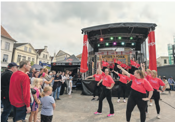
Bereits beim Reporter-Jubiläumfest 2025 hatte die Zumba-Sparte des BSG Eutin einen vielumjubelten Auftritt.

ehemaligen Gelände der Landesgartenschau. Fußgängerinnen und Fußgänger gelangen über die Wache in der Oldenburger Landstraße auf das Kasernengelände. Gäste sollten für eine eventuelle Einlasskontrolle ihren Personalausweis oder Reisepass bereithalten.