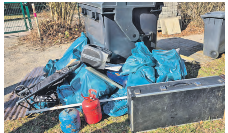
Ein großes Berg Müll kam dieses Jahr zusammen.

bunt aussehen und Kinder, Eltern, Lehrer und Nachbarn erfreuen. Mit dieser Aktion möchte die Stadt Eutin den Einsatz der Kinder für die Umwelt sichtbar machen. Der Standort Blaue Stadt folgt im April. An allen drei Standorten der Gustav-Peters-Schule werden Blühwiesen für die Insekten angelegt, natürlich werden sie auch wunderschön