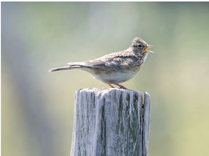
Die Feldlerche gehört zu den gefährdeten Bodenbrütern.

Freilaufende Hunde – selbst freundliche, gut erzogene Tiere – lösen bei Wildtieren Fluchtreaktionen aus. Für sie macht es keinen Unterschied, ob ein Hund „nur spielen“ will. Die Energie, die bei der Flucht verloren geht, fehlt für Brut, Aufzucht oder das eigene Überleben. Nicht nur Vögel leiden unter Störungen. Rehkitze und junge Hasen liegen oft regungslos im hohen Gras – ihre Tarnung ist ihr einziger Schutz. Werden sie aufgescheucht oder verfolgt bedeutet es enormen Stress. Ein Hund nutzt Instinkte – auch dann, wenn seine Besitzer*innen ihn als harmlos einschätzen.