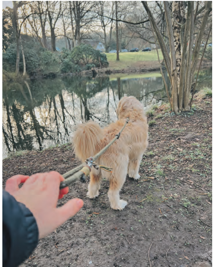
Jetzt gehören Hunde an die kurze Leine.