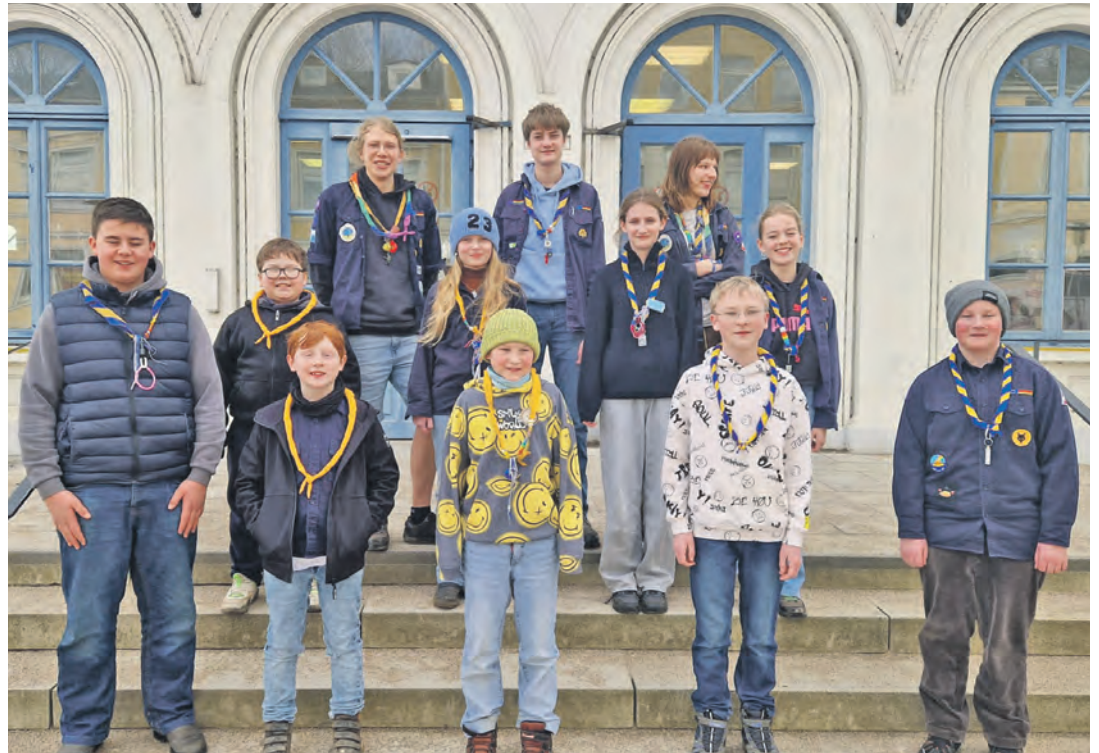
Die Eutiner Pfadis vom Stamm Möwe gestalten den Thinking Day im Februar gemeinsam mit den Itzehoer Störvögeln.

Besonders macht dieses Treffen jedoch die Altersstruktur der Begleitung. Von den 16