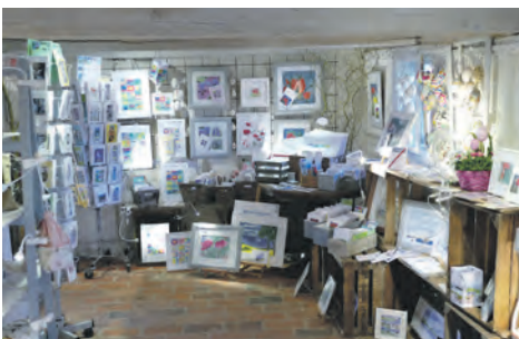
Der Frühlingsmarkt verströmt alle Jahre wieder österliches Flair.