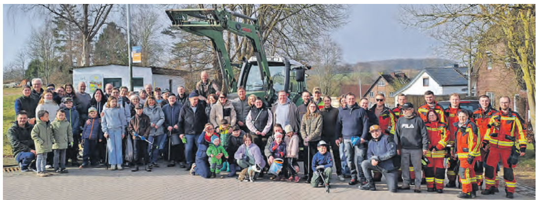
Die Sieversdorfer waren voller Tatendrang und bestens ausgerüstet bei der Sache.

„Es war wieder ein toller und wichtiger Einsatz für den Gemeinschaftssinn und das Um-