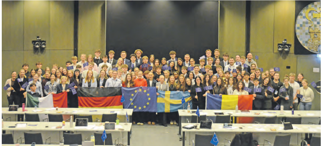
Einen lebendigen Eindruck europäischer Vielfalt und Kooperation nehmen die jungen Menschen von dem EVE-Wochenende mit.

Am letzten Tag wurden die erarbeiteten Lösungen, die Resolutions, bei der General Assembly im großen Saal des Kreishauses in Eutin vorgestellt und diskutiert. Aufregung und auch leichte Anspannung lagen vor allem zu Beginn der Sitzung in der Luft. Viele Rednerinnen und Redner, die die Position ihres Ausschusses vorstellten und vertraten, waren zunächst nervös, aber danach erleichtert, stolz und sehr glücklich. Die Tatsache, dass alle formell gekleidet waren, verließ der Veranstaltung eine professionelle Atmosphäre. Das Hospitality-Team sorgte für die Verpflegung der 115