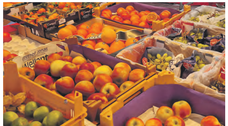
Obst und Gemüse sollten auf dem täglichen Speiseplan nicht fehlen.

Text und Foto: Matti Schmüser, Schüler-Praktikant Wilhelm-Wisser-Schule Eutin