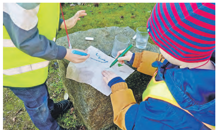
„Wandernde Farben“: Zwei kleine Künstler staunen beim Experiment.

Wieviel Arbeit hinter einer Tüte Mehl steckt, erfuhren die Kinder, als es galt, mit alten Hand-Kaffeemöhlern und Mörsern Getreidekörner von Dinkel und Hafer