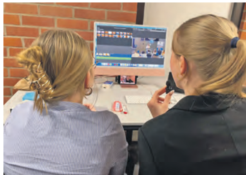
Das Media-Team sorgte für den Informationsfluss.