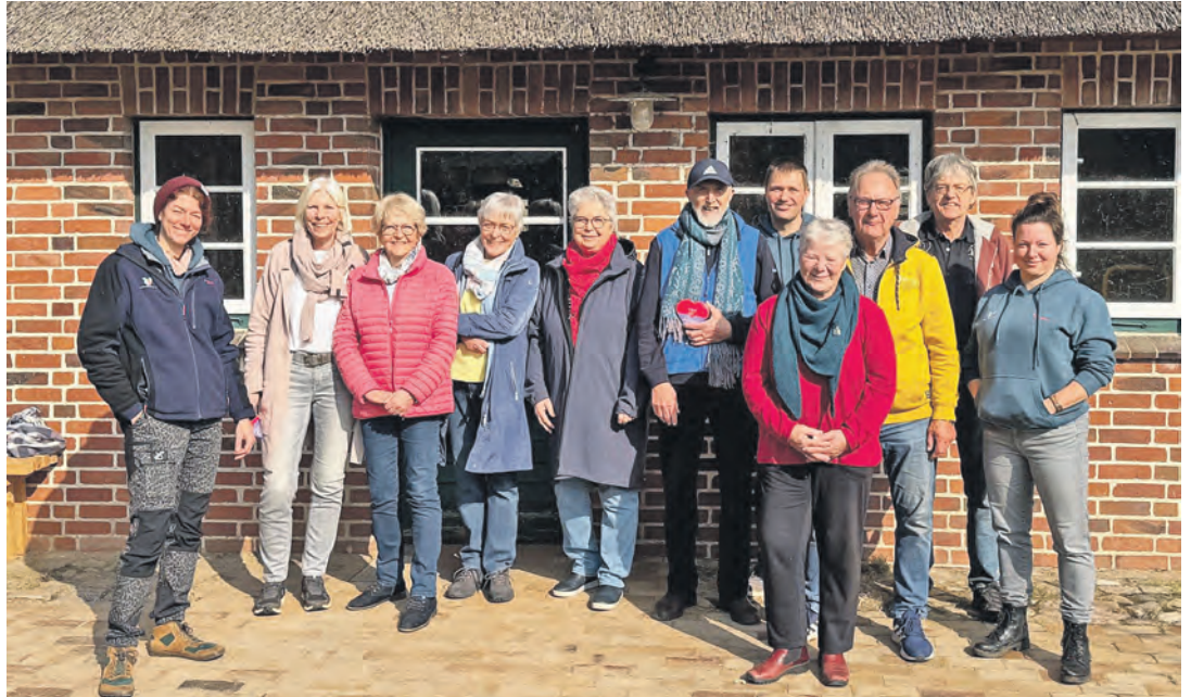
Das gemeinsame Team der Bürgerstiftung Eutin und des Erlebnisses Küchengarten Schloss Eutin.

Das eingespielte pädagogische Küchengarten-Team hatte exklusiv für die Bürgerstiftung Eutin ein buntes Programm für neugierige Forscherinnen und Forscher an zehn spannenden Stationen entwickelt: So waren unter an-