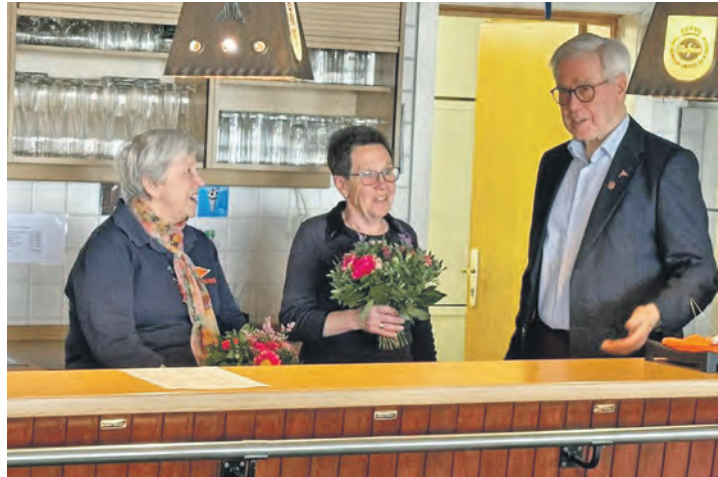
Ein Dank ging an die Kantinencrew.

Nach dem Tag der offenen Tür am Freitag, der Jubiläumsfeier am Samstag und der Jubiläumsregatta am Sonntag gingen die drei Feiertage zu Ende. Ab sofort gilt es den Blick nach vorn zu richten. Und so kamen die Mitglieder der SVMG zu Ihrer Jahresmitgliederversammlung 2026