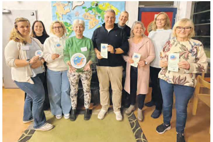
Ein Netzwerk wächst in Ahrensböök, damit Kinder sicher groß werden können.

Um eine Schutzinsel zu sein, braucht es keine pädagogische Ausbildung. Empathie, Aufmerksamkeit und ein respektvoller Umgang reichen aus. Wichtig ist, dem Kind zuzuhören, seine Sorgen ernst zu nehmen und gemeinsam abzuwarten, bis Eltern oder andere Unterstützung erreicht sind. Betriebe und Einrichtungen erhalten dafür ein Starterpaket mit wichtigen Kontaktnummern und Informationen.