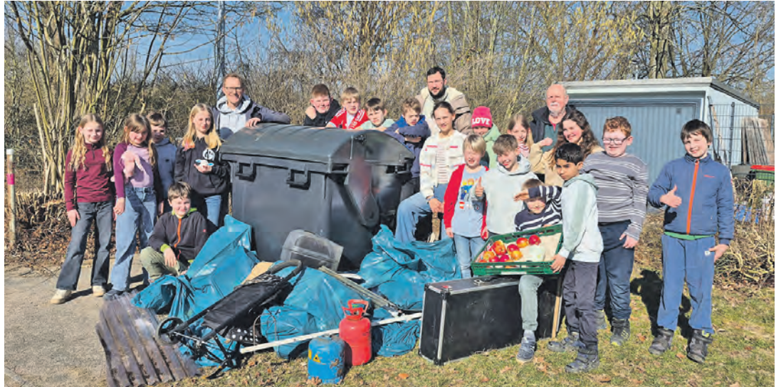
Die fleißigen Kinder freuten sich über ihren Sammelerfolg und die Anerkennung der Erwachsenen.

Eutin (hs). Alle Jahre wieder. Schon 32 Jahre sind vergangen, seit die Welle Nord die Aktion „Unser sauberes Schleswig-Holstein“ unterstützt vom Holsteinischen Gemeindetag, dem Städtetag Schleswig-Holstein und der Provinzial ins Leben rief. Wie in jedem Jahr beteiligten sich die Eutiner Schulen am 6. März an dem Tag der sauberen Landschaft. Großräumig wurde um die Gustav-Peter-Schule das Gebiet zwischen Regenbogenbrücke und Anny Trapp Straße von Müll befreit. Die Grundschüler waren mit Eifer dabei und freuten sich auch über spektakuläre Funde. Ein Schüler hielt vier Pfandflaschen hoch und freute sich schon auf den einen Euro, den er da-