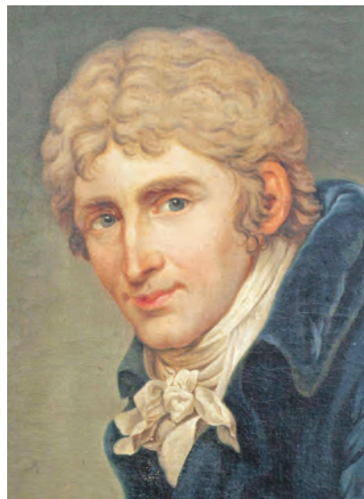
Johannes Falk ist heute nahezu verges- sen