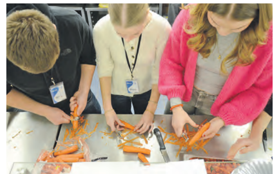
Gesunde Verpflegung kam vom Hospitality-Team.

Teilnehmenden. Dafür wurden Großeinkäufe erledigt, mehrere Buffets aufgebaut und natürlich mit viel Liebe und Freude gekocht. Außerdem waren sie für die Social Activities verantwortlich. Ein abwechslungsreiches Programm sorgte dafür, dass sich alle schnell kennenlernen und gemeinsam schöne Momente erleben konnten. Es gab eine Stadtrallye und besonders das Dancebattle hat gezeigt, wie gut die verschiedenen Schüler nach so kurzer Zeit zusammenarbeiten konnten und wie der Teamgeist gestärkt wurde.