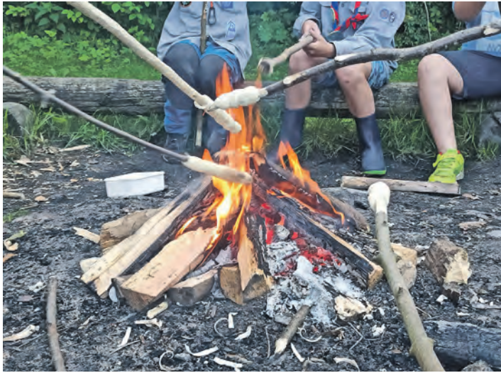
Wer hat Lust, in die Pfadfinderei hineinzuschnuppern?

Im Mittelpunkt stehen praktische Aktivitäten, wie sie typisch für die Pfadfinder sind. Dazu gehören gemeinsames Spielen, kleine Aufgaben in der Natur sowie erste Erfahrungen mit einfachen pfadfinderischen Fähigkeiten. Zudem wird der Küchergarten des Schloss Eutin erkundet. Am Abend kommen alle Teilneh-