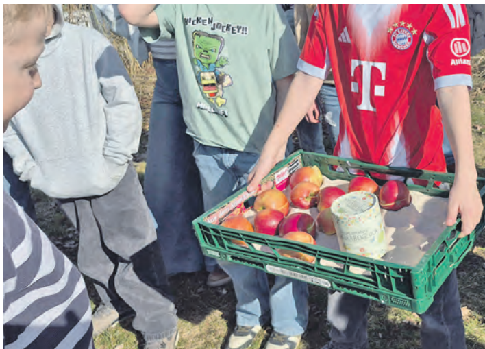
Die Äpfel waren schnell verspeist, die Saat wird Blüte tragen.

für bekommen wird. Sehr viele Zigarettenkippen wurden leider immer noch gefunden, unzählige Verpackungen von Süßigkeiten, Silvesterböller und auch viel Plastikmüll.