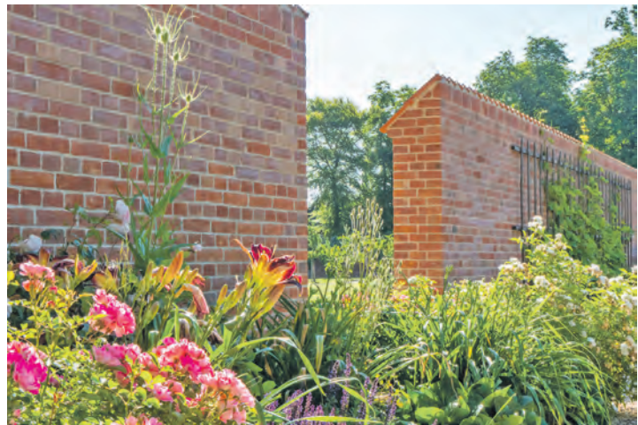
Die Klimamauer im Küchengarten Schloss Eutin.

und Natur: Küchengarten-Leiterin Kerstin Imogen Vieth geht mit Gästen quer durch den einstigen Nutzgarten von Schloss Eutin und zeigt, wie die Klimamauer hier die Artenvielfalt fördert. Im Garten des Vereins zur Erhaltung der Nutzpflanzenvielfalt können Kräuterschilder aus Stein gestaltet werden und die Sparkassenstiftung Ostholstein bietet für Kinder Sonnenfänger-Basteln aus Pflanzen an. Die Gartentüren