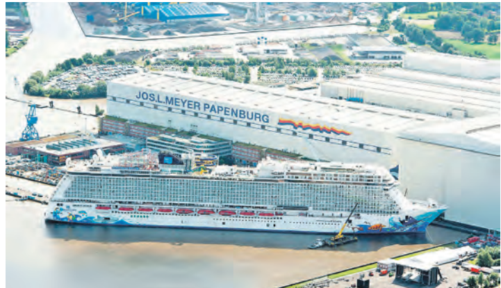
Die größten Kreuzfahrtschiffe der Welt werden mitten im Land in der berühmten Meyer-Werft gebaut, wo unsere Leser*innen zur Werftführung erwartet werden.

Film-Vortrag in der Kreuzfahrt-Ausstellung genießen. Zum großen Leistungspaket der Sonder-Reise gehören neben der Fahrt im erstklassigen Fernreisebus direkt ab Eutin ohne Einsammeltour eine Übernachtung im Landhaus-Mittelklasse-Hotel mit Frühstück vom Buffet und ein reichhaltiges ostfriesisches Bauern-Buffet zum Abendessen im Hotel sowie das Komplett-Paket Meyer-Werft inklusive Eintrittsgeld laut Beschreibung und am zweiten Tag ein Ostfriesland-Ausflug unter dem Motto „Land & Leute“ mit Besuch der „Tee-Hauptstadt“ Leer mit der romantischen Altstadt und Hafen. Auskünfte und Buchungen sind ab sofort möglich bei den Reporter-Leser-Reisen in Eutin, Montag