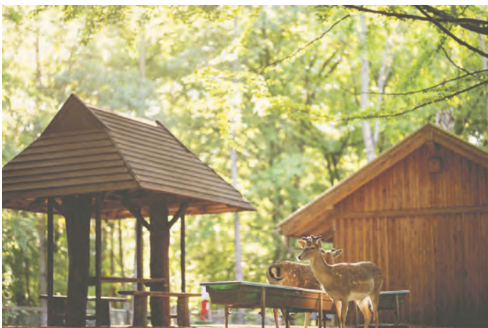
Im warmen Abendlicht kann man die Tiere des Wildparks Malente bei der Fütterung beobachten.

erfahrenen älteren Tiere ohne Scheu zu den Futterstellen und freuen sich über mitgebrachtes heimisches Obst und Gemüse. Die nächste Führung durch den Wildpark findet am Donnerstag, 12. Juni, statt und startet um 17 Uhr. Treffpunkt ist der Haupteingang am Parkplatz an der Kreisstraße 2. Erwachsene zahlen 5 Euro, Kinder ab 9 Jahren nur 3 Euro. Für jüngere Kids ist die Führung kostenlos. Die Termine finden in der Regel zweimal im Monat statt, das nächste Mal wieder am 26. Juni.