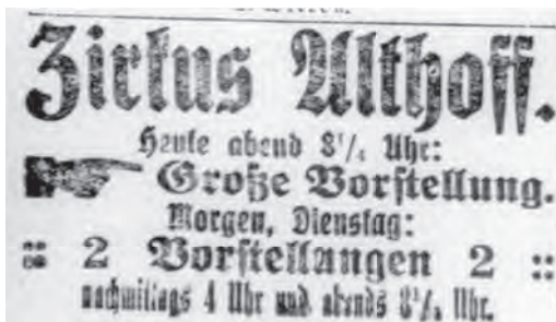
Zirkus Althoff gastiert im Mai 1925 in Eutin

meine Lage gefunden: „Schulden zahllos, Regierung ratlos, Steuern endlos, Politik charakterlos, Sitten schamlos, Aufklärung gehirnlos, Schwindel grenzenlos, Aussicht trostlos, Volk gottlos, Wahlen zwecklos.“ Bis in die Mitte der 1920er Jahre