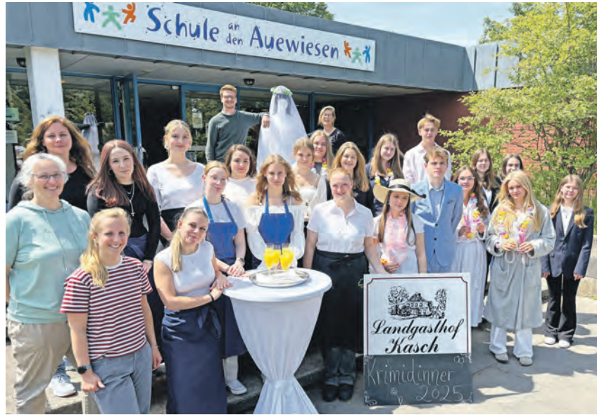
Kochen, Service, Theater und Technik: Die Schülerinnen und Schüler der Malente Gemeinschaftsschule stellen mit Unterstützung aus Lehrerkollegium und Wirtschaft wieder ein Krimidinner auf die Beine.