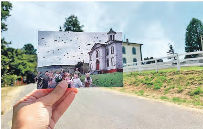
So geht Filmtourismus: Realen Drehort aufsuchen und mit der Filmszene vergleichen.

Detaillierte Infos und Auskünfte zum Kartenvorverkauf sind online auf www.hitchcock-days.de zu finden. Unterstützt werden die „Hitchcock-Days“ von der Sparkasse Holstein und ihren Stiftungen, den Stadtwerken Eutin sowie vom „reporter“ und dem Verein „KulturOrt Nord“