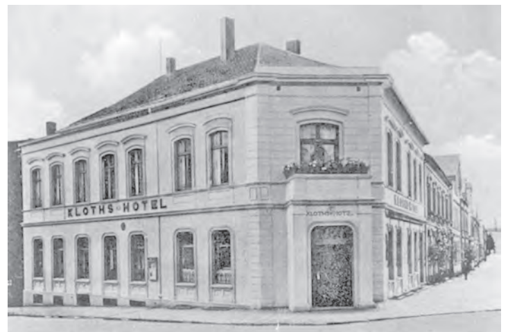
Kloths Hotel – hier gründet sich die NSDAP