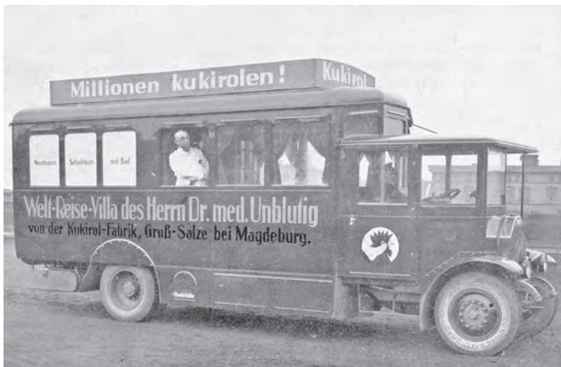
Die „Kukirol Welt-Reise-Villa“