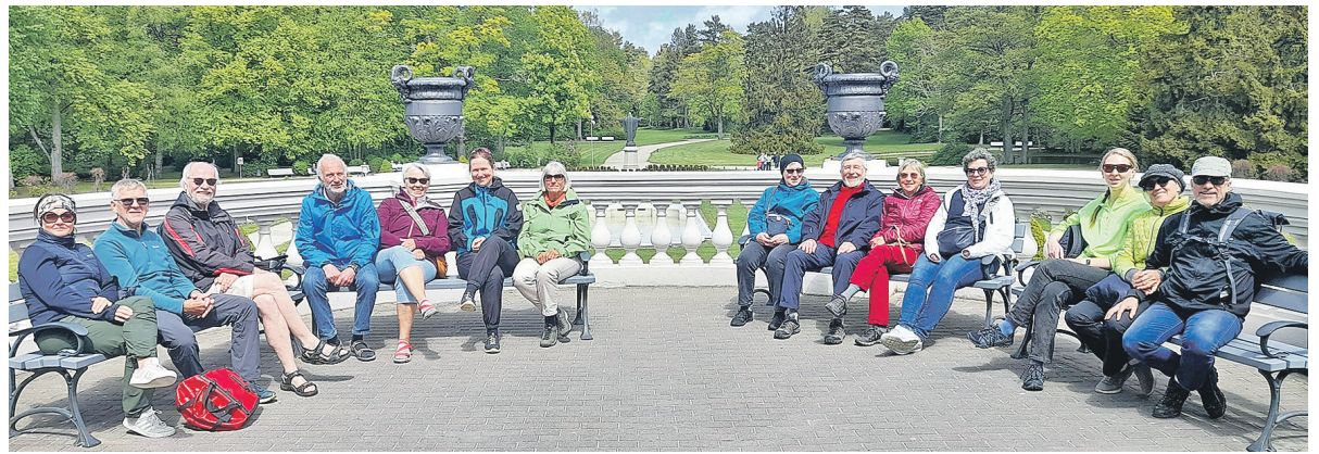
Futura Baltica steht für gelebte Völkerverständigung.

Malente (t). Vor einer Woche machte sich die Malenter Gruppe Futura Baltica auf zu einem Besuch bei Freunden in Klaipėda – mit dem Fahrrad nach Kiel und auf die Fähre nach Litauen: Mit großem „Hallo“ wurden die zehn Mitglieder und Mitgliederinnen in Klaipėda von der Leiterin des dortigen Kirchenchores Karalienės empfangen. Diese Reise war ein