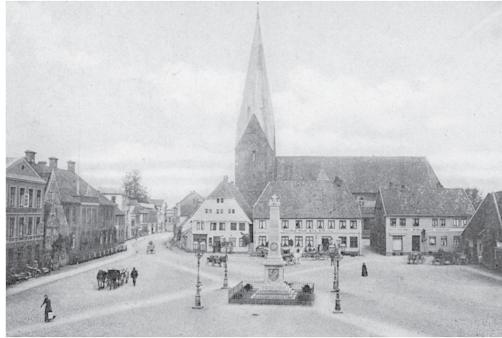
Ein Blick über den Marktplatz um 1900

Immer wieder erwähnt Gustav in seinen Briefen die Casino- (oder Theater-) Gesellschaft. Dabei handelt es sich um einen seit längeren Jahren bestehenden gesellschaftlichen Zusammenschluss, der keine politischen Zwecke verfolgt. Der Verein besteht ausschließlich aus Akademikern oder aus wirtschaftlich besonders gutsituierten Kreisen der hiesigen Bevölkerung. Seine Mitglieder kommen in gewissen Abständen zu gesellschaftlichen Veranstaltungen zu-