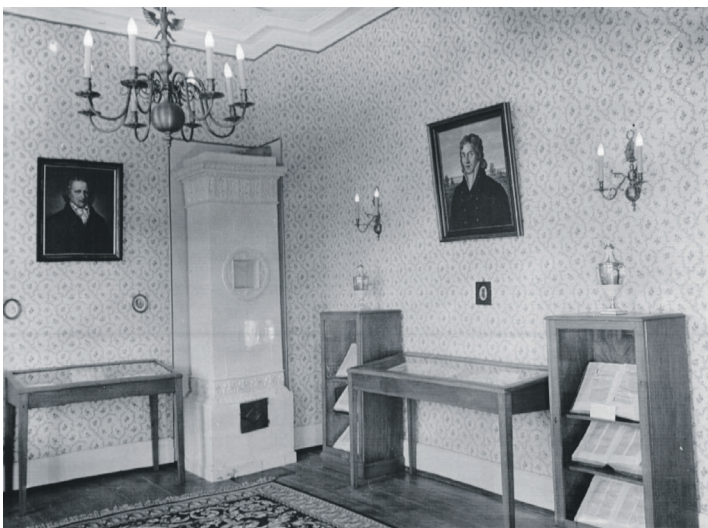
Autografensammlung im Kavalierhaus, hierüber diskutiert die Literarische Gesellschaft