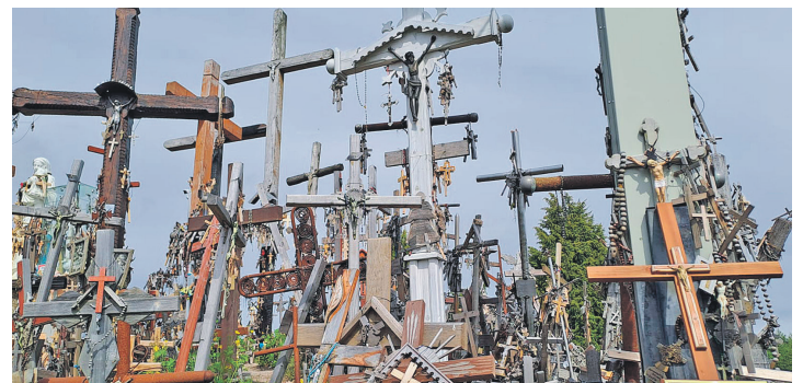
Beeindruckend war der Besuch beim Berg der Kreuze.

Der Abschied von den Sängerinnen und Sängern fiel schwer. So wurde eine herzliche Einladung nach Malente ausgesprochen, vielleicht schon im nächsten Jahr.