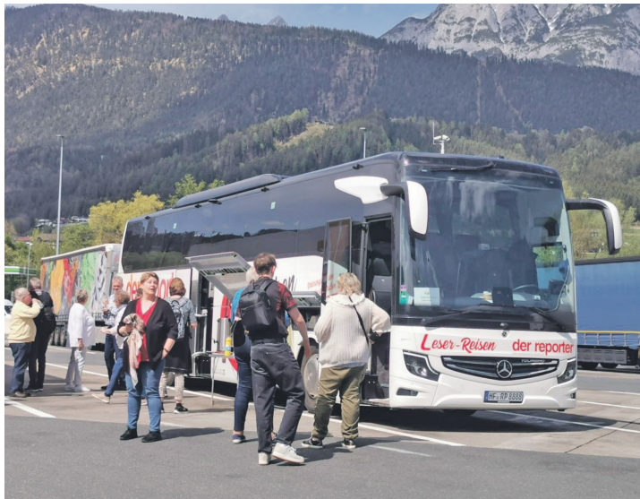
Der nagelneue Reporter-Reisebus „Mercedes Tourismo“ wird auf dem Fest vorgestellt.

bis 17 Uhr fröhlich und mit großem Aufwand gefeiert – mit dabei sind ganz viele Vereine und Verbände aus der Region von Oldenburg bis Lütjenburg, von Preetz bis Eutin. Die Vorfreude bei allen Aktiven ist riesengroß und die monatelangen Vorbereitungen für ein ganz besonderes Geburtstags-Fest in der Kreisstadt sind abgeschlossen. Das Angebot wird komplettiert durch eine große Blaulicht-Meile