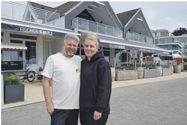
Köstlichkeiten aus dem Seecontainer: „Fischer und Fritz“ bereiten feinstes Streetfood zu.