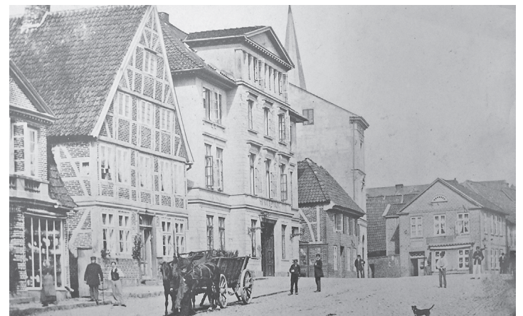
Das Hotel „Stadt Hamburg“ in der Lübecker Straße, auch hier finden Aufführungen der Casino-Gesellschaft statt