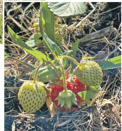
Nicht nur Erdbeeren gedeihen im Schulgarten.