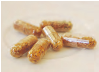
Diese Gewürzmi- schungen wurden bei der „StartUp Challenge“ ausgezeichnet.

schungen und sind in einer umweltfreundlichen Zellulosehülle verpackt. Sie lassen sich an persönliche Vorlieben – etwa weniger Salz oder den Verzicht auf bestimmte Zutaten – anpassen.