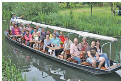
Unterwegs im Spreewald mit dem stakenden Fährmann sind unsere Leser*innen im Sommer 2025.

Anmeldungen sind ab sofort bei den Reporter-Leser-Reisen des Burg-Verlages in Eutin, Montag bis