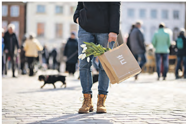
Shoppern kann man auch in diesem Jahr in Eutin wieder an verschiedenen Einkaufssonntagen.

„Wir nehmen bei allen Akteuren den Wunsch wahr, den gegenseitigen Informationsaustausch zu verstärken sowie mehr Transparenz zu gewährleisten, um vereint Eutins Innenstadt attraktiver zu gestalten und nach vorne zu