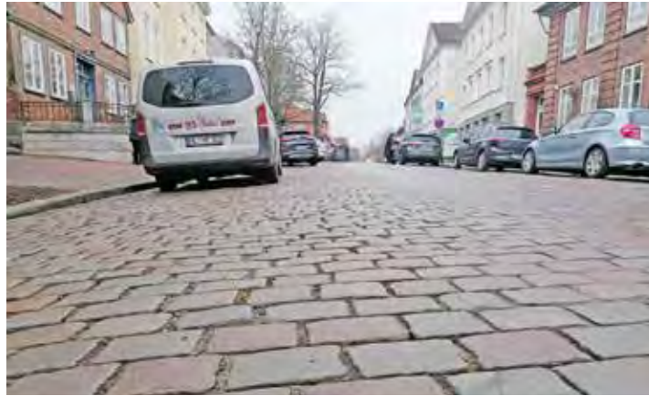
Mit der Freigabe der Fördermittel steht die Sanierung des historischen Pflasters wieder auf der Tagesordnung.

Kiel (t). Die umfassende Umgestaltung der historischen Eutiner Innenstadt kann fortgesetzt werden. Das Innenministerium hat dafür im Rahmen der städtebaulichen Gesamtmaßnahme „Historischer Stadtkern“ der Stadt Eutin rund 3,9 Millionen Euro Städtebauförderungsmittel freigegeben. Vorgesehen ist die Sanierung des östlichen Teils der Schlossstraße, der sich anschließenden Stolbergstraße sowie der Lübecker Straße bis zum Kreuzungsbereich Carl-Maria-von-Weber-Straße/Weidestraße. Ziel der Stadt Eutin ist eine umfassende Neugestaltung, die die Straßen und Gehwege besser zugänglich und möglichst barrierearm machen soll. Dabei wird auf die enge Bebauung und den Denkmalschutz Rücksicht genommen. Die Gehwege werden überwiegend mit einem roten Klinkerbe-