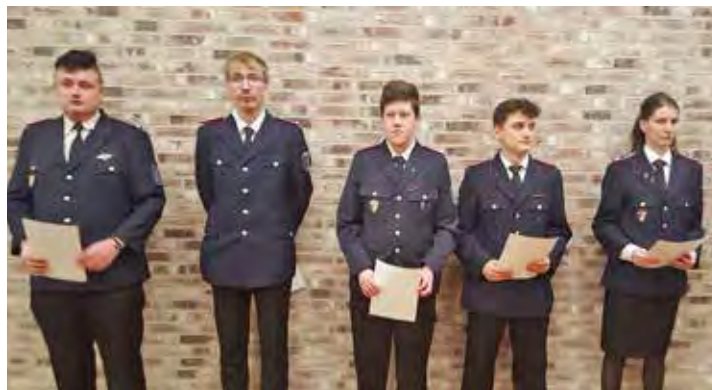
Die Beförderten nahmen die entsprechenden Urkunden entgegen.

Auch der Kreis hätte einen großen Teil zur Anschaffung des 614.000 Euro teuren Fahrzeugs beigetragen, da zu den Rüstwagenstandorten in Ostholstein na-