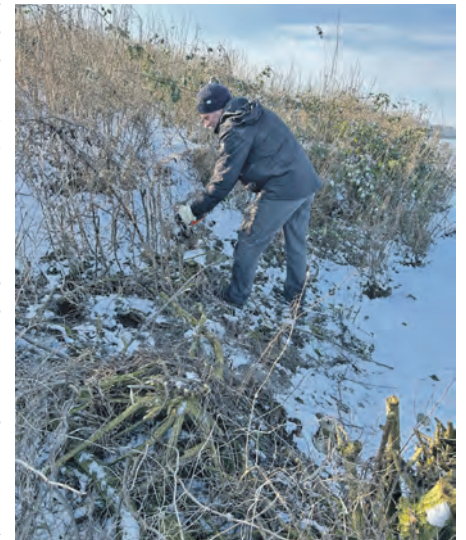
Den Brombeeren ging es an den Kragen, damit die Möwen brüten können.

Auch die Jüngsten packten an. (dazu die beiden Kinderfotos)