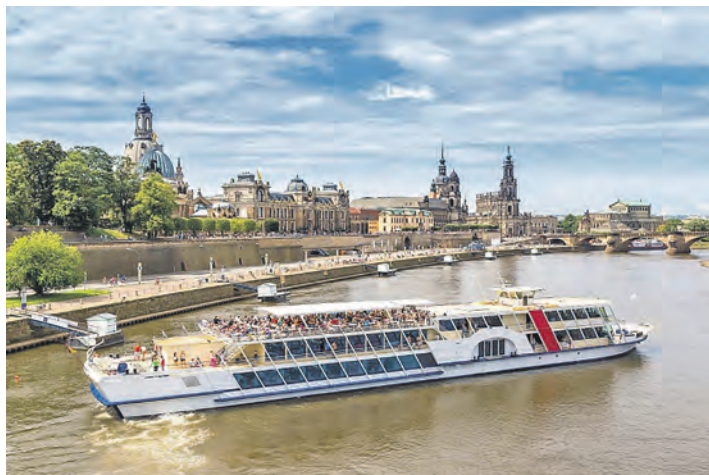
Elbflorenz im Sommerkleid: Das weltberühmte Dresden erkunden unsere Gäste beim großen Tagesausflug mit viel Freizeit.

Die Gäste werden zudem preisinklusive mit einem sehr umfangreichen Erlebnisprogramm rundum verwöhnt – bitte vergleichen Sie unsere Leistungen mit dem Wettbewerb! Residieren werden die Teilnehmer*innen im großzügigen Komfort-Hotel mit Hallenbad und Sauna mit sehr reichhaltiger Halbpension bei den großen Schlemmerbuffets zum Frühstück und Abendessen sowie zusätzlich „All