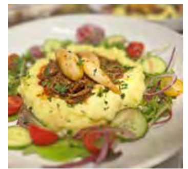
Ein Herbstleckerbissen: Stifado