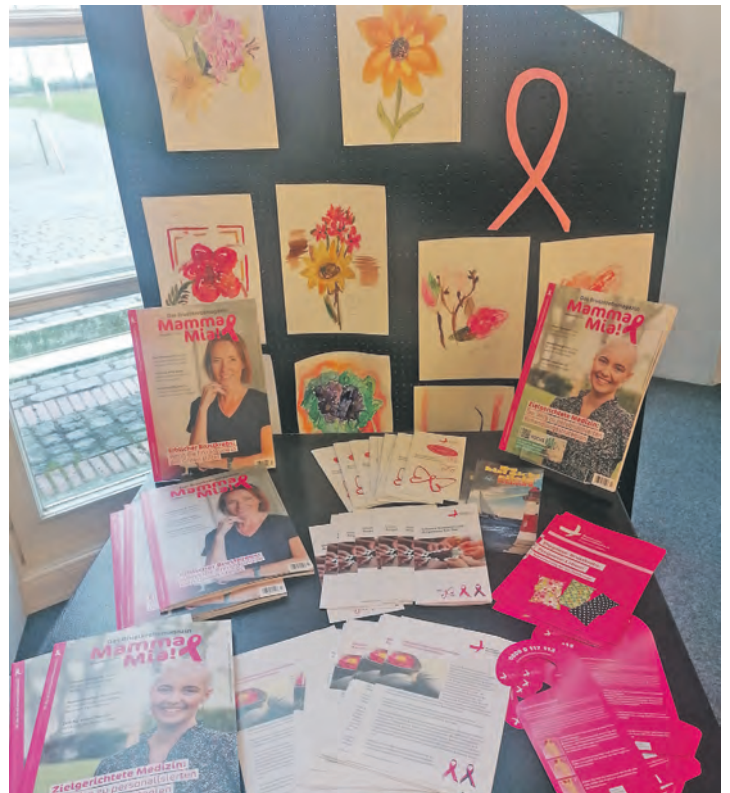
Im Foyer sind die Ergebnisse des Workshops zu sehen und es liegt Infomaterial bereit.