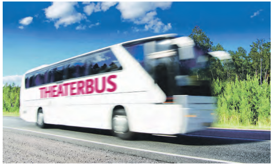
Bequem und entspannt kommt man mit dem „inkultur“-Theaterbus zu den Aufführungen nach Hamburg.

sierte direkt bei „inkultur“. Das kulturbegeisterte und freundliche Serviceteam beantwortet Fragen gerne unter Telefon 040-22700666 oder per E-Mail an theaterbus@inkultur.de. Auf Wunsch schickt „inkultur“ auch Informationsmaterial zu. Weitere Auskünfte sind online auf www.inkultur.de/eutin zu finden.