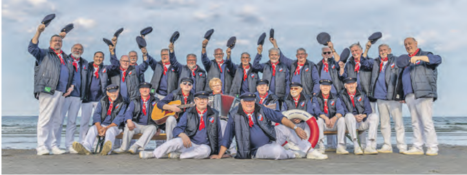
Die Blau-weißen Jungs suchen Verstärkung!

Ahrensböck (t). Wie schafft man es, neue Sänger für einen sehr aktiven und gut organisierten Shanty Chor zu gewinnen? Diese Frage stellen sich der Vorstand und die Sänger des Ahrensböcker Shantychores „Blau-weiße Jungs“ schon seit langem.