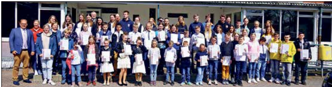
Insgesamt wurden 91 junge Sportlerinnen und Sportler für ihre herausragenden Leistungen im Jahr 2023 ausgezeichnet.