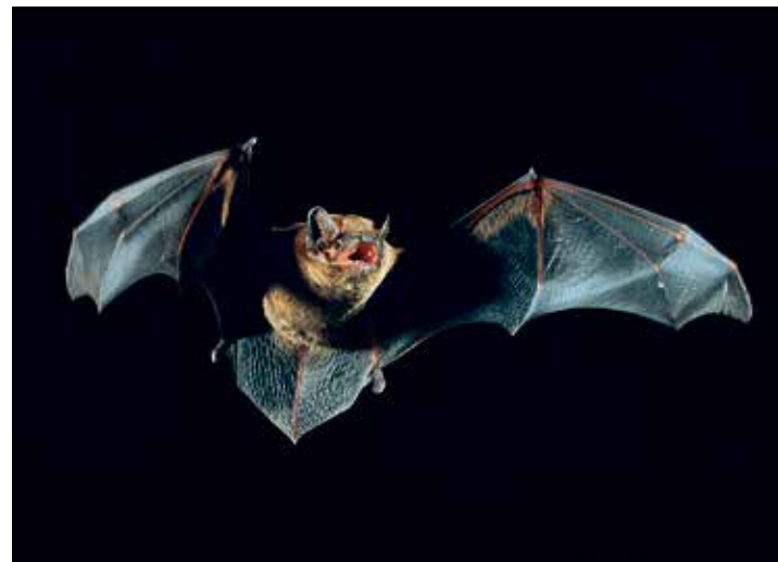
Der Große Abendsegler zählt zu den größeren Fledermausarten, die in der Region Holsteinische Schweiz heimisch sind.

Plön (t/los). Der Verein Naturpark Holsteinische Schweiz lädt zur nächsten Fledermaus-Safari ein. Die Veranstaltung findet am Freitag, 10. Mai in Plön statt. Treffpunkt ist die Schlossterrasse um 20.30 Uhr. Für die Teilnahme ist eine Anmeldung erforderlich, die wochentags telefonisch unter 04521 - 77 56 540 beim Natur-