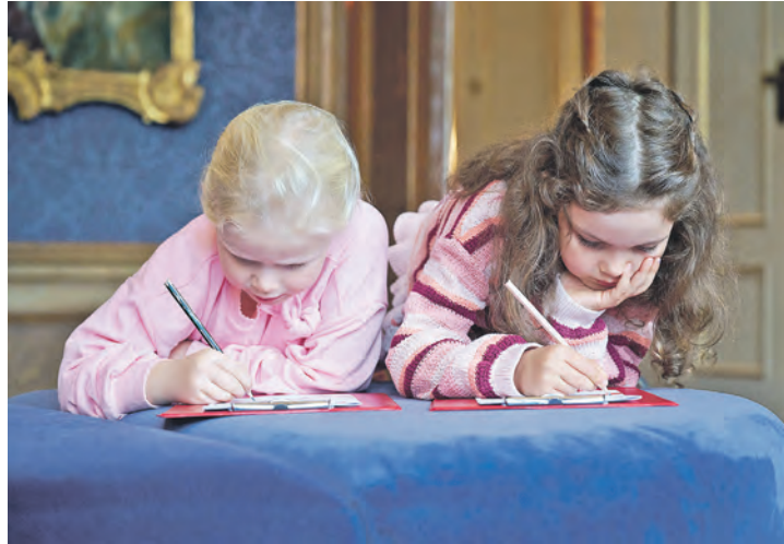
Mit der Rätsel-Rallye geht es durch Schloss Eutin.

Kinder dürfen sich am Museumstag die neue Rätsel-Rallye „Achtung, Antike!“ kostenfrei an der Kasse im Shop abholen. Mit