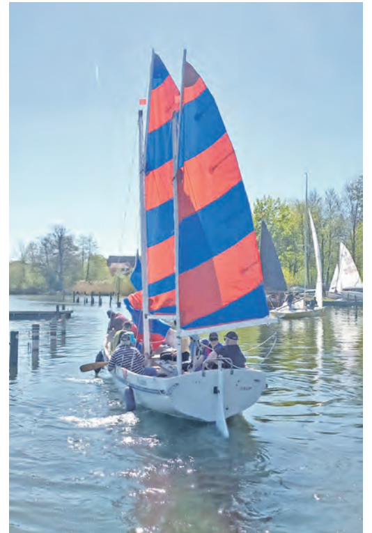
Ein gemeinschaftliches Vergnügen: Kutter „Kuddel“ war vollbesetzt.