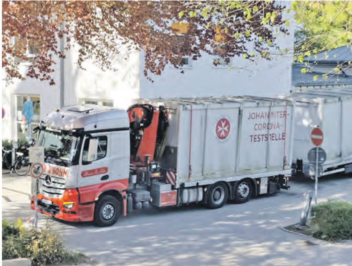
Die Teststationen vor dem SEK wird abtransportiert.

„Stell dir vor, du bist in einem Raum. Vielleicht ist er ganz schön eingerichtet. Es gibt ein Sofa, auf dem du liegst. Du wirst hier für unbestimmte Zeit sein müssen. Vielleicht für eine Woche. Vielleicht für viele Monate. Aber es gibt nichts zu tun. Kein Stift und Zettel, kein Buch, keinen Fernseher, keine Wolle zum Stricken, nichts. Du liegst da auf dem Sofa und hast Tatendrang, Ideen, Freude an der Sonne, die durchs Fenster strahlt, aber du kannst nichts tun. Du bist auch ein wenig einsam, weil nicht jeden Tag jemand zu Besuch kommt. Du bekommst Essen geliefert, manchmal darfst du dir in der Küche im Nebenzimmer etwas kochen. Aber manchmal musst du mitten im Gemüseschnippeln doch wieder in dein Zimmer auf das Sofa. Vielleicht darfst du erst in drei Stunden wieder in die Küche. Nach drei Wochen wird dir erlaubt, dass du draußen die Straße einmal auf- und ablaufen darfst. Du hast so viel Freude, du läufst sie zweimal auf und ab und bekommst Ärger. Eine Woche Hausarrest. Aber danach darfst du dir sogar selbst etwas einkau-