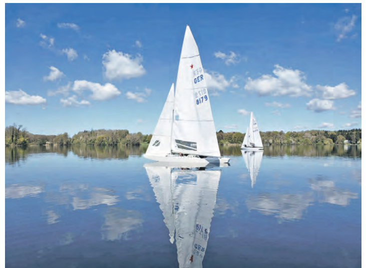
Schöner Anblick, aber keine Segelbedingungen.

Für den Sonnabend war stärkerer Wind angekündigt. Was dann allerdings kam, übertraf die Vorhersagen. Windgeschwindigkeiten von teilweise mehr als 20 Knoten ließen einen vertretbaren Segelsport mit diesen Booten nicht zu. Nach einem kurzweiligen Nachmittag im Clubhaus mit vielen Fachgesprächen über Vergangenes und Neues in der Szene traf man sich am Abend zum