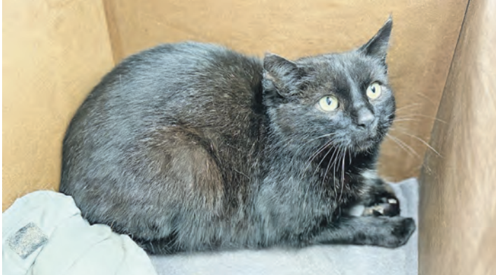
...und Sirius hoffen auf ein Zuhause.

eher zurück und geben sich ein bisschen scheu und schüchtern. Mit ein wenig Eingewöhnungshilfe wird sich das sicher bald ändern. Noch lieber allerdings würden die Kater, die als Fundtiere