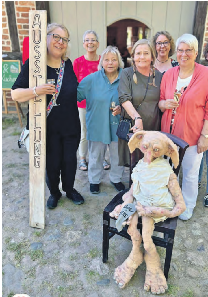
In der Dunkerschen Kate stellen kreative Köpfe aus.