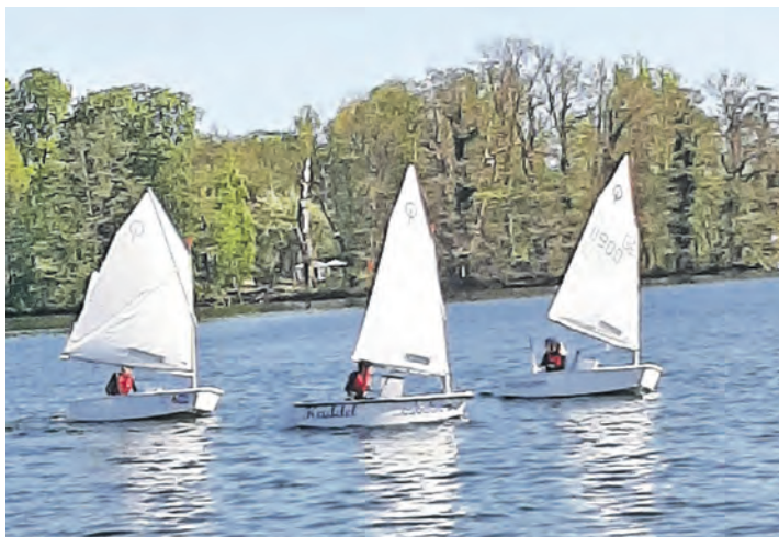
Der Nachwuchs segelte im Opti.