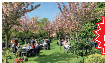
Foto-Motiven im pulsierenden Welthafen. Nach dem Altländer Mittagessen in Jork erwartet Sie das so beliebte Kirschen-Fest mit großem Kirschen-Markt direkt im Ort.

Schlemmen & Genießen zum romantischen Kirschen-Fest in Jork im Herzen des „Alten Landes“ inklusive Mittagessen und Obsthof-Besichtigung. Top-Erlebnis Elbeschiffahrt auf der Anreise von Hamburg bis Finkenwerder mit den modernen Hadag-Hafenfähren als kleine Stadtrundfahrt auf dem Wasser mit vielen spannenden