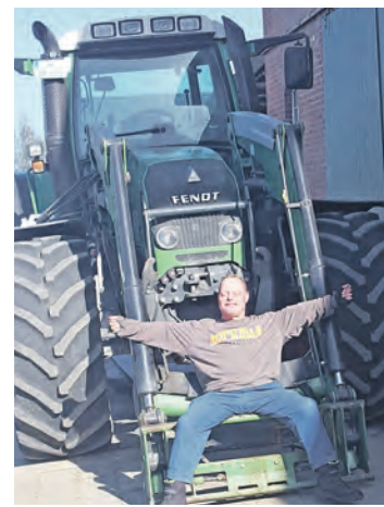
Der Traktor war ein Highlight.