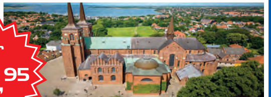
Wikinger-Dom Roskilde: UNESCO-Welt-Kulturerbe & Königsgräber