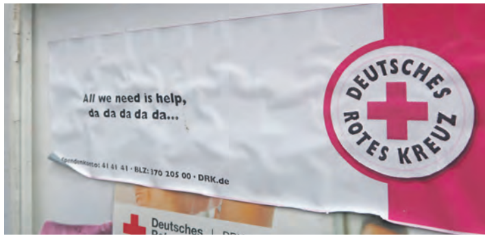
Wie es in Zukunft beim DRK weitergeht, ist bislang offen.

Schon zu Beginn der Versammlung erklärte Marc Brade, Beisitzer des Präsidiums des DRK-Kreisverbandes Ostholstein, deutlich, dass die ursprünglich angekündigte Tagesordnung nicht stattfinden werde. Wahlen? Verschoben. Entscheidungen? Vertagt. Konkrete Informationen? Fehlangezeige. Stattdessen erklärte Brade, die Lage müsse erst „rechtlich aufgearbeitet“ werden. Selbst das Präsidium habe angeblich „noch nicht alle Informationen“. Für viele Anwesende dürfte das nur schwer nachvollziehbar gewesen sein. Schließlich hatte das Präsidium selbst die Abberufung Menaths veranlasst und dem Ortsverein damit faktisch die Führung entzogen. Dennoch erklärte Brade mehrfach, man könne derzeit nichts Genaues sagen – auch nicht dazu, wie lange der Zustand andauern werde. Auf