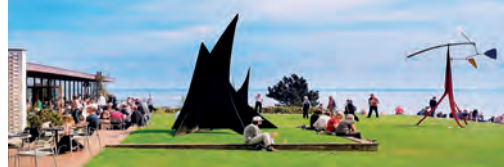
Kunst-Museum „Louisiana“ in einmaliger Lage am Öresund