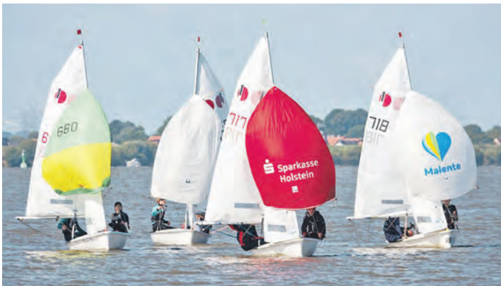
Toller Anblick: Der Nachwuchs auf dem Wasser.

Bevor es in die Wettfahrten geht, ist wie immer ein zweitägiges Trainingslager angesetzt. Hier werden nochmals Technik und Taktik von acht anwesenden Trainern aus verschiedenen Landesverbänden geschult, bzw. der Feinschliff vorgenommen. Am Freitagnachmittag wird es dann ernst. Für 16 Uhr hat Wettfahrleiter Günter Heppes die erste von sechs geplanten Wettfahrten angesetzt. Von da an sollte das Gelernte und Geübte in die Regattapraxis umgesetzt werden. Die weiteren Wettfahrten folgen jeweils am Sonnabend und Sonntag um 11 Uhr. Die Siegerehrung wird wahrscheinlich ab 14 Uhr vorm Clubhaus der SVMG vorgenommen. Gäste sind herzlich willkommen.