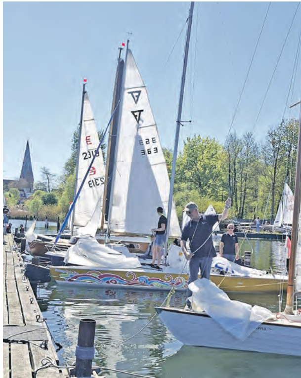
Kurz vor dem Start wurden auf den Booten letzte Vorbereitungen getroffen.

Malente (t). Traditionell wird beim Ostholsteinischen Seglerverein Eutin (OSVE) am 1. Mai angesegelt. Bei herrlichem Sonnenschein und leichter Brise ging es auch in diesem Jahr unter zahlreicher Beteiligung in die aufgetakelten Boote, als es hieß „Leinen los!“ Zunächst wurde vom Vereinsgelände die Stadtbucht angesteuert, wo sich viele Spaziergänger am Anblick der zahlreichen Segelboote erfreuten, darunter auch der vollbesetzte Kutter „Kuddel“ mit seinen rot-blauen Segeln. Anschließend ging es Richtung Redderkrug, wo das Startschiff des Vereins vor Anker lag. Kleine und große Segler gingen längsseits und holten sich eine Stärkung ab. Zurück im Hafen ging es dann zum gemütlichen Beisammensein auf dem schön gelegenen Gelände des