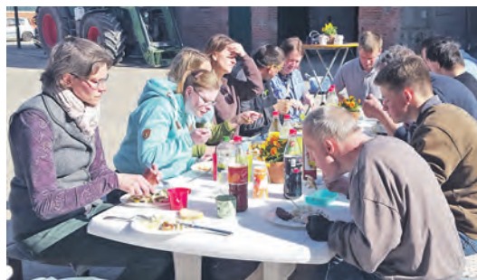
Lecker: Gemeinsames Genießen beim Grillen.