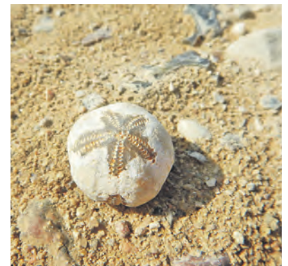
Ein fossiler Seeigel.

Malente (t). Fossilien bestimmen leicht gemacht! Die Kaltzeiten brachten riesige Mengen Steine, Geröll und Schutt aus Skandinavien nach Schleswig-Holstein. Beim Kiesabbau kommen diese eiszeitlichen Ablagerungen und mit ihnen Fossilien und Versteinerungen ans Tageslicht. Mit etwas Glück können fossile Seeigel, Kugelkoralen, Haizähne und andere Überbleibsel vergangener Tage am Sonntag, 17. Mai, von 10 bis ca. 12.30 Uhr aufgespürt werden. Der Geschlebesammler Lutz Förster steht mit Rat und Tat auf der Suche nach diesen Raritäten zur Verfügung und hilft beim Bestimmen der Funde. Um Anmeldung unter Telefon 04521-77 56 540 oder per E-Mail an info@naturpark-holsteinische-schweiz.de wegen der Nennung von Namen, E-Mail oder Telefonnummer. Die Kosten betragen für Erwachsene 7 Euro,