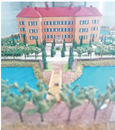
Das Modell zeigt Schloss Ahrensböök.

Ahrensböök (t). Am Sonntag, 17. Mai, öffnet das Heimatmuseum in Ahrensböök, Mößberg 3, von 14 bis 17 Uhr seine Türen. Anhand der Exponate wird die historische Entwicklung der Großgemeinde Ahrensböök, also von Ahrensböök und seinen 19 Dörfern, gezeigt und erläutert. Dazu gehören historische Flurkarten, Urkunden, Fundstücke, zu denen auch archäologischer Funde gehören, Postkarten, Heimatbücher, historische Zeitschriften und andere Dokumente.