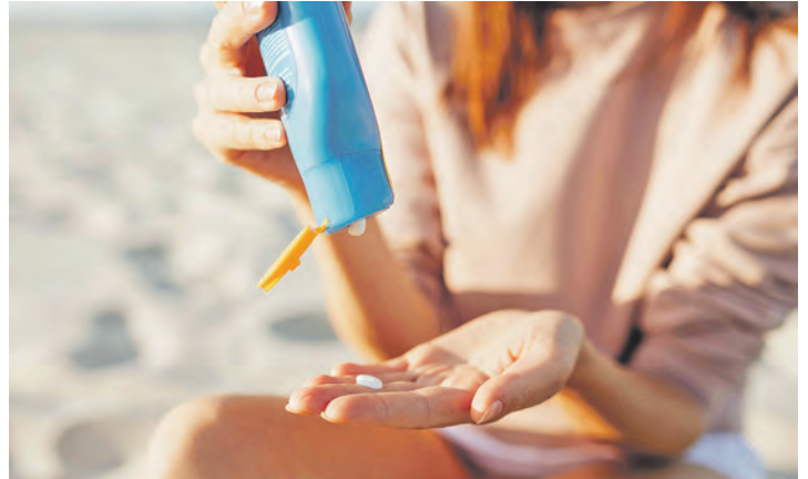
Nachcremen verlängert nicht die Schutzzeit.

Der Lichtschutzfaktor verlängert zwar die Eigenschutzzeit der Haut – ersetzt jedoch nicht das regelmäßige Nachcremen. „Nachcremen sorgt dafür, dass der Schutz aufrechterhalten wird, verlängert allerdings nicht die ursprüngliche Schutzzeit“, betont Liekfeldt. „Viele Menschen unterschätzen, wie