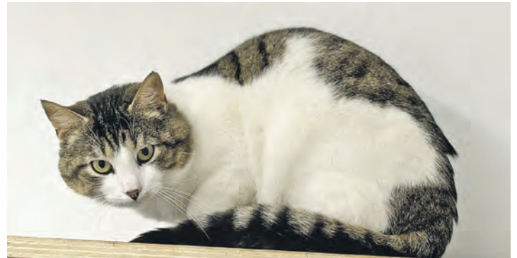
Ein bisschen schüchtern, aber sehr nett: Frodo...

ins Tierheim gekommen sind, ihre jetzige Unterkunft gegen ein echtes Zuhause eintauschen. Das Zeug, gute Mäusefänger zu werden, haben sie allemal.