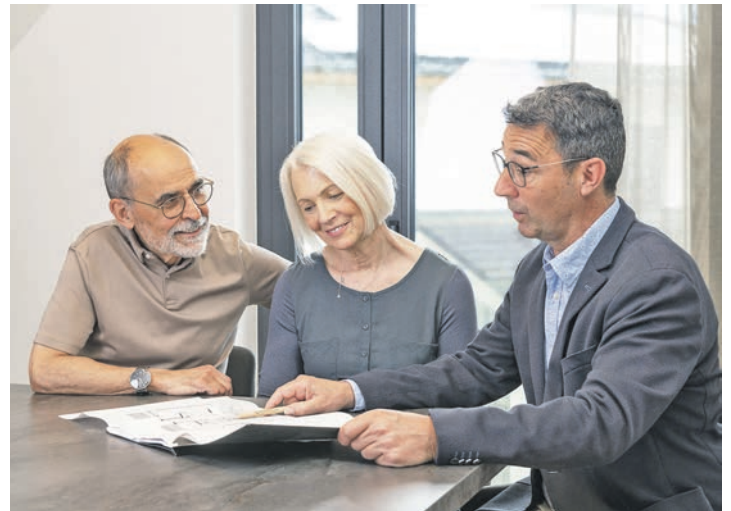
Wärmepumpen in größeren Gebäuden müssen regelmäßig geprüft werden.

Voraussetzung für einen erfolgreichen Wärmepumpenbetrieb in Mehrparteienhäusern ist jedoch eine sorgfältige Planung. Sie ist deshalb so wichtig, weil diese Gebäude aufgrund der größeren Anzahl an Wohnungen höhere Anforderungen an die Warmwasserbereitung haben. Zudem ist die Gewinnung der Umweltwärme für diese Gebäude komplexer als bei kleinen. Größere Gebäude haben einen höheren Heizbedarf, ent-