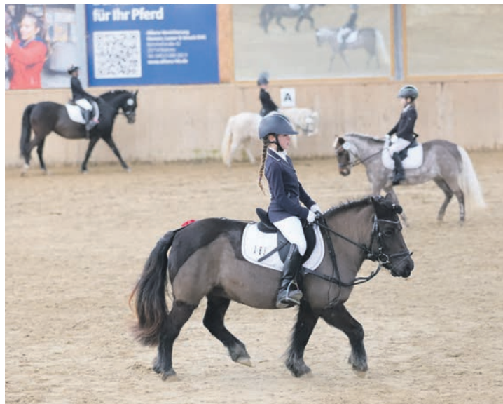
Im Reiterwettbewerb zeigten die Kleinen ihr Können.