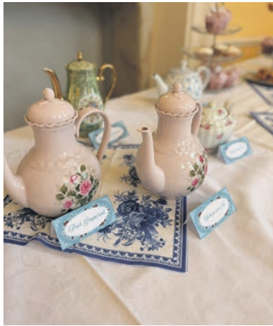
English Tea Time war das Motto der Versammlung.

Plön (t). Die Mitglieder des künftigen Vereins Ladies' Circle in Gründung 122 Holsteinische Schweiz haben auf dem Weg zur offiziellen Vereinsgründung einen Meilenstein erreicht. Unter dem Motto „English Tea Time“ kamen zahlreiche Gäste aus der Round-Table-Familie am 20. März im Prinzenhaus zu Plön zusammen, um diesen besonderen Anlass zu feiern.