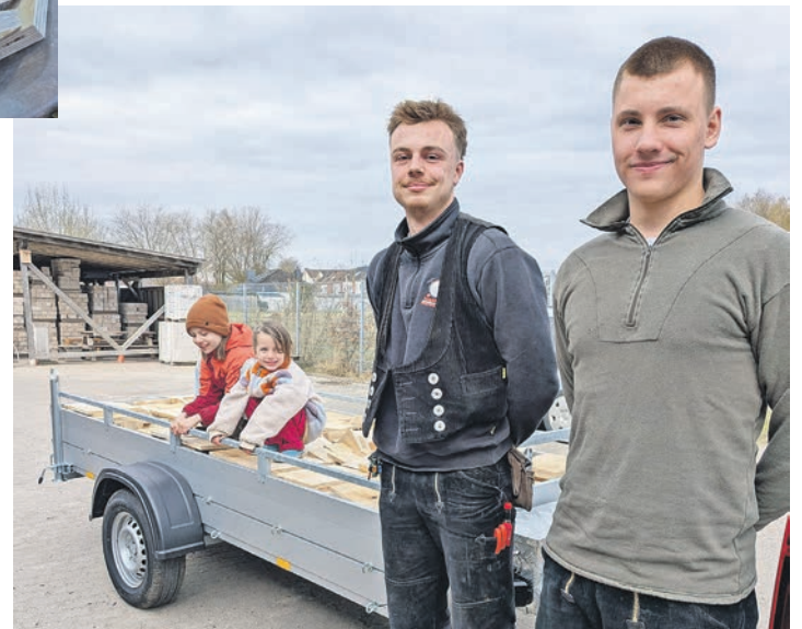
Die Azubis der Überbetrieblichen Ausbildungsstätte hatten für ERNA die Nistkästen-Bauteile hergestellt.

Ab Mai können Interessierte wieder das „Bildungsspaß“-Programm der Sparkassen-Stiftung bei ERNA buchen und dabei Natur hautnah erleben. Weitere Infos über die Arbeit des Vereins sind online auf www.erna-eutin.de zu finden.