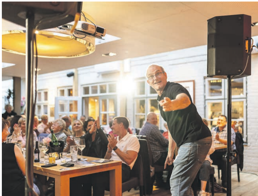
Momentaufnahme der Nacht der Hofnarren 2025 im Brauhaus Eutin.

Eutin (t). Am 10. September kehrt die beliebte „Nacht der Hofnarren“ nach Eutin zurück. Der Kartenvorverkauf läuft in der Tourist-Info am Markt 19. In den teilnehmenden Locations – Brauhaus Eutin, Exquisites China Restaurant Chau Eutin, Imbiss & Café Kajott sowie Bistro und Patisserie Stumpfes Eck – sorgen die Künstler wieder für einen abwechslungsreichen Abend, bei dem Comedy und gutes Essen perfekt zusammenkommen. Für das Brauhaus und das Restaurant Chau sind noch Karten zu haben. Während die Acts im Laufe des Abends zwischen den Restaurants wechseln, servieren die Gastronomien in den Pausen ein optionales Menü, das die Gäste kulinarisch ver-