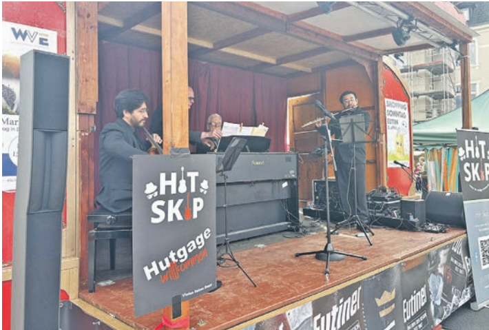
Von Klassik bis Rock war an diesem Nachmittag alles dabei.

Im Mittelpunkt stand dabei ein konkreter Lösungsansatz: Die Vereinigung plant, eine eigene Trägergesellschaft zu gründen und sich damit als Gesellschafterin an der neuen Festspiel-GmbH der Stadt zu beteiligen.