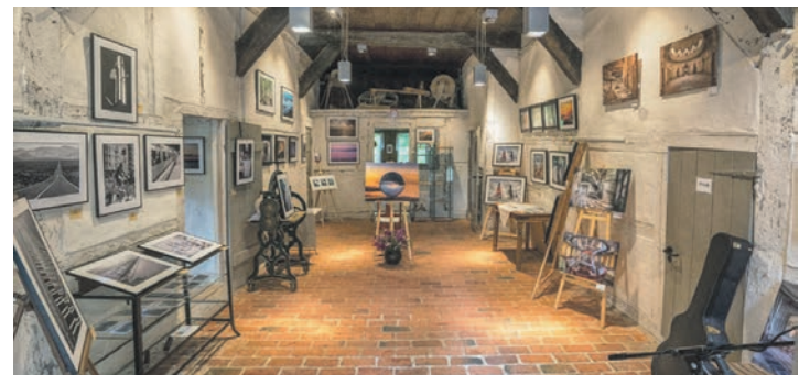
In der Dunkerschen Kate stellt der Fotoclub Kiel öfter aus.

sind die Arbeiten ambitionierter und erfahrener Hobbyfotografen in der Dunkerschen Kate, Bischof-Vicelin-Damm 7, in Bosau zu sehen.