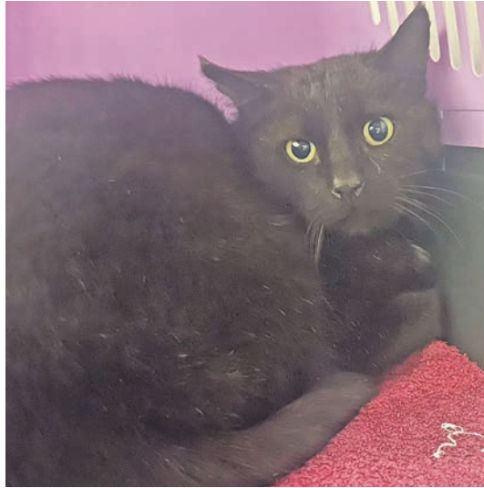
In Barghorst wurde dieser schwarze Kater gefunden.

oder per E-Mail info@tierheim-eutin.de .