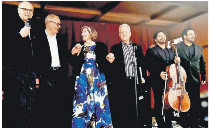
Hand in Hand für die Festspiele – das war der Spirit des Verkaufsoffenen Sonntags.