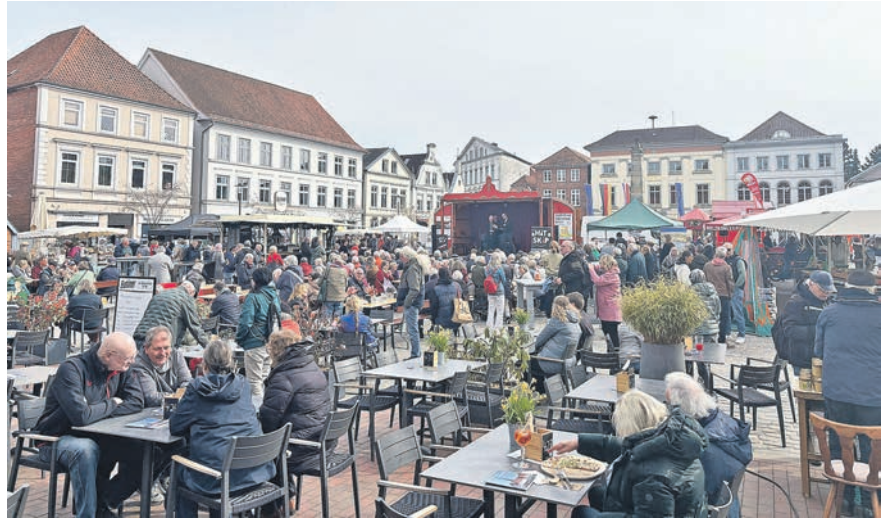
Zahlreiche Besucherinnen und Besucher verfolgten das Konzert auf dem Eutiner Marktplatz.