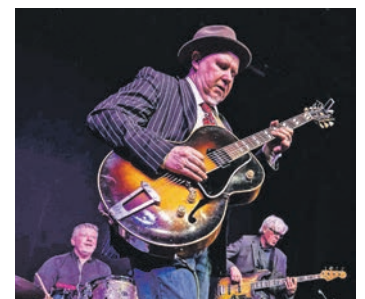
Jay Åsling ist eine feste Größe in der nordischen Blueszene.

Lensahn (t). Die Gaststube des Museumshofes in Lensahn lädt wieder mit klangvollen Blues-Rhythmen zu einem unvergesslichen Abend ein. Am Montag, 20. April, findet dort ein Blueskonzert mit den Musikern Bertram Scholz, Kalle Reuter und Martin Röttger sowie dem Sir Jay Åsling samt Band statt. Der schwedische Bluesgitarrist ist für seinen energiegeladenen Mix aus traditionellem Blues und modernen Einflüssen bekannt. Und Reuter/Röttger/Scholz sind ein Trio, das den „alten Blues“ und auch bluesverwandte Stücke präsentiert. Das Konzert beginnt um 19.30 Uhr, Einlass ist ab 18.30