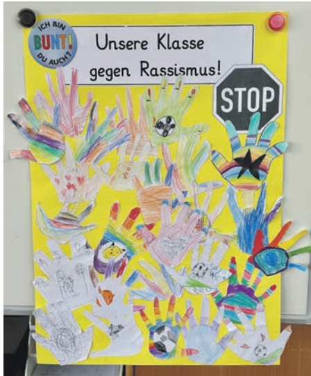
Die Grundschulklassen gaben ein klares Statement ab und arbeiteten auf vielfältige Weise zum Thema.

In der Gemeinschaftsschule wurde das Thema in unterschiedlichen Zusammenhängen bearbeitet. Die Klasse 5a begann mit einem Anne Frank-Mandala als Impulseinstieg, betrachtete dann reale Fotos der Familie des Mädchens und erstellte im Anschluss ein Tafelbild zu den damals möglichen Aktivitäten im Alltag und in der Freizeit. Ein animierter Spielfilm „Wo ist Anne Frank?“ wurde mit drei