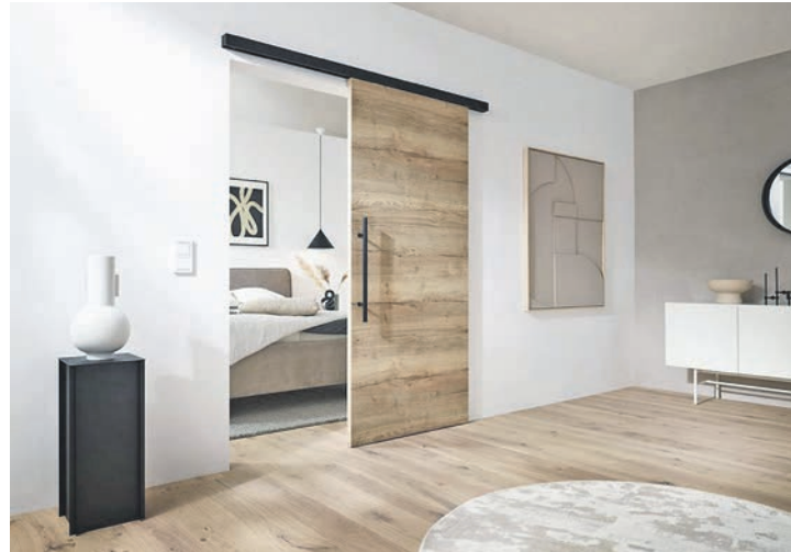
Schiebetüren nehmen nur wenig Platz in Anspruch und schaffen barrierefreie Durchgänge.

Wer es klassischer mag, kann zu Weißlack-Ausführungen greifen, die mit ihrer zurückhaltenden Optik zu vielen Wohnstilen passen. Für mehr Licht, etwa in