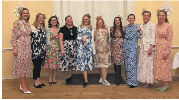
Auf dem Weg zum Verein: Der Ladies' Circle in Gründung 122 Holsteinische Schweiz.

Passend dazu hatten die Ladies für eine stimmungsvolle