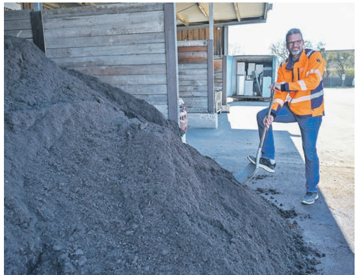
Kompost ist ideal für Beete und Rasenflächen.

Recyclinghöfen in Bad Schwartau, Neuratjensdorf und Neustadt in Holstein kostenfrei zur Verfügung gestellt. Pro Haushalt kann eine Menge von bis zu einem Kubikmeter Kompost, nach tagesaktueller Verfügbarkeit, entnommen werden – ideal für Hobbygärtnerinnen und -gärtner, die Blumenbeete, Gemüseflächen oder Rasenflächen auf natürliche Weise düngen möchten. Mit dieser jährlich wiederkehrenden Aktion möchte der ZVO aufzeigen, wie wichtig die richtige Trennung von Bioabfällen ist und welchen Beitrag Bürgerinnen und Bürger durch konsequente Abfalltrennung für Umwelt- und Klimaschutz leisten können. „Aus Bioabfall wird wertvoller Rohstoff – wer seine Biotonne richtig nutzt, hilft aktiv mit, Ressourcen zu schonen und den