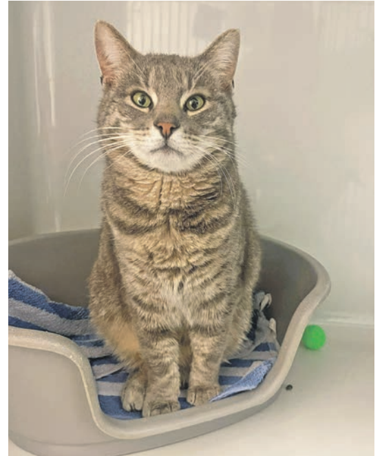
Der graugetigerte Kater wurde in Timmdorf gefunden.