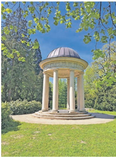
Der Sonnentempel ist ein freimaurerisches Element.

Eutin (t). Die Eutiner Freimaurerloge „Zum goldenen Apfel“ lädt wieder zu öffentlichen Führungen durch den Eutiner Schlossgarten ein. Die Führung beginnt am Sonnabend, 18. April, um 10 Uhr im Schlosssinnenhof am Freimaurerportal mit einer kleinen Vorrede. Dann geht es in den Freimaurergarten. Erste wichtige Station ist der Seepavillon. Er steht symbolisch für den Eintritt ins Leben und ist bereits ein vollständiger Initiationstempel, bei dessen Bau Himmelsrichtungen, Sichtachsen und Zahlensymbolik berücksichtigt wurden.