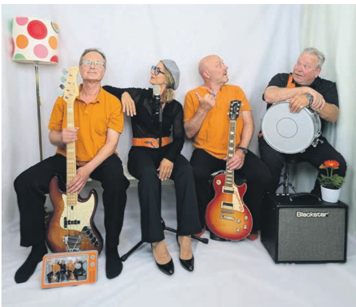
Die Band „Tonabgeber“ bringt gute Laune nach Eutin.