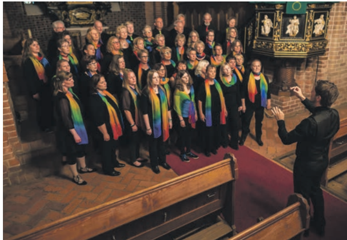
Die Basilika Altenkrempe ist der gewohnte Konzertort für den Eutiner VHS-Chor „Voice Company“.

Das Programm „Music of the heavens“ setzt verschiedenste inhaltliche Akzente: Es finden sich altbekannte Gospels und Spirituals, aber auch neu einstu-