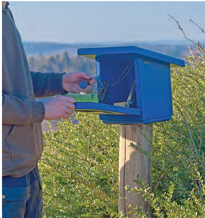
Einer der 42 neuen Stempelkästen im Naturpark Holsteinische Schweiz steht am Bungsberg.

Zu den besonderen Stempelstellen-Highlights gehören der Bungsberg und die Bräutigamseiche, die mit exklusiven Stempelmotiven aufwarten – passend zu den jeweiligen Naturpark-Highlights. Auch die Naturpark-Geschäftsstelle in Eutin ist jetzt mit einem Stempelkasten ausgestattet und kann von fleißigen Stempeljäger*innen besucht werden. Die beiden Wanderpässe sind in den Tourist Informationen in Bad Segeberg, Eutin, Malente und Plön sowie an weiteren dezentralen Punkten im Naturpark erhältlich. Alternativ können sie unter holsteinischeschweiz.de/wanderpass heruntergeladen werden. Für jeweils fünf gesammelte Stempel eines Wanderpasses gibt es an den Tourist Infos Wandernadeln in Bronze, Silber und Gold. Wer