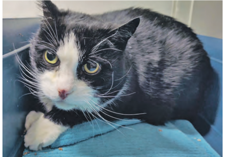
Kater Mulle sucht ein neues Zuhause.