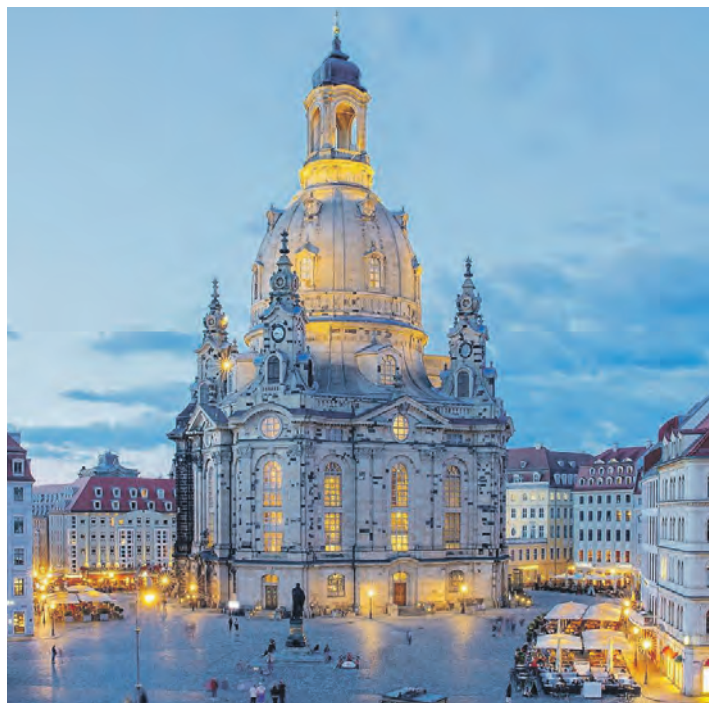
Einer der Höhepunkte des Programmes: der Besuch in der Frauenkirche Dresden inklusive Orgel-Konzert.

Stadtführung, Kirchenführung Frauenkirche und viel Freizeit zum individuellen Entdecken des Elb-Florenz. Zum großen Leistungspaket der Sonderreise gehören neben der Fahrt im erstklassigen Fernreisebus direkt ab Eutin ohne weitere Einsammeltour drei Übernachtungen im Komfort-Hotel in Meissen mit reichhaltigem Frühstück vom Buffet sowie drei Abendessen im Hotel als leckere Schlemmerbuffets oder Drei-Gang-Menüs sowie die kostenlose Sauna-Nutzung im Hotel. Bereits auf der Anreise erfolgt