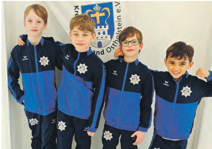
Die jungen Eutiner Leistungsturner brauchen angemessene Trainingsbedingungen.

Scan to donate to Sven's fundraiser "Lasst unsere Nachwuchsturner weiterfliegen"