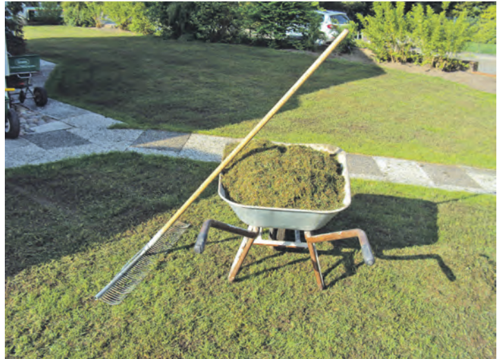
Langsam wird es Zeit, den Rasen auf Vordermann zu bringen.

Das regelmäßige scharfe Abharken striegelt den Rasen, lüftet und verhindert das Verfilzen. Die Rasenflächen sollten darüber hinaus dreimal jährlich gleichmäßig gedüngt werden und bei anhaltender Trockenheit bodendurchdringend gewässert werden. Alles was aus Baumschul-Töpfen kommt kann ganzjährig gepflanzt werden. „Ballenpflanzen sollten nicht nur in der vegetativen Ruhezeit entnommen, sondern auch innerhalb dieser Periode wieder eingesetzt werden. Was aus dem Freiland kommt, sollte gepflanzt werden, bevor das Laub wächst