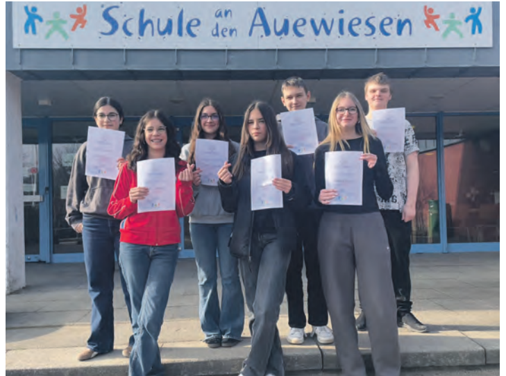
Die Malenter Konfliktlotsinnen und -lotsen sind zurecht stolz auf ihr Zertifikat.

che Gefühle es gibt. Außerdem waren Gesprächstechniken und die gemeinsame Entwicklung fairer Lösungen entwickelt. Das Ziel dieses Projektes ist es, Konflikte frühzeitig, eigenständig zu klären. Besonders die jüngeren Kinder profitieren davon, neutrale Ansprechpersonen auf Augenhöhe zu haben. Die Schule an den Auewiesen setzt mit diesem Programm ein Zeichen für ein respektvolles Miteinander. Mit ihrem Start übernehmen die ausgebildeten Schülerinnen und Schüler des achten Jahrgangs nun eine wichtige Rolle im Schulleben – als Vermittler, Zuhörer und Unterstützer für die gesamte Schulgemeinschaft. Mit Stolz können sie ihre Zertifikate in den Händen halten.