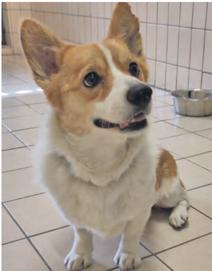
Der süße Corgi-Mix hat diese auffällige Leine getragen.

Eutin (ik). Da hat sich der kleine Hund wohl allein auf den Weg gemacht und wird jetzt irgendwo schmerzlich vermisst: Ein Corgi-Mix wartet nun im Tierheim Eutin darauf, nach Hause abgeholt zu werden. Der unkastrierte Rüde ist zwar gechipt, aber nicht registriert, sodass die Besitzer nicht auszumachen