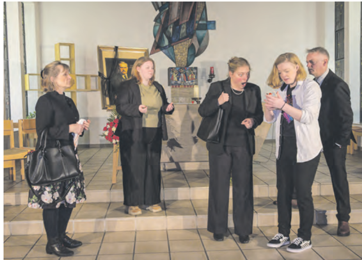
Die „Zeitgeister“ widmen sich in ihrem satirischen Trauerspiel dem Thema Tod und Abschied, wobei die Befindlichkeiten im innerdeutschen Kulturkampf aufs Korn genommen werden.

Ein weiterer Aufführungstermin von „Kalter weißer Mann“ ist am Sonnabend, 25. April, um 19.30 Uhr im Kursaal im Haus des Gastes in Malente. Der Kartenverkauf erfolgt in der Malenter Tourist-Information in der Bahnhofstraße 3.