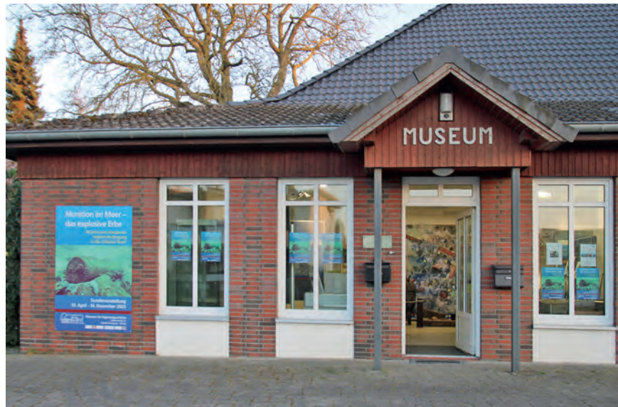
Im Museum in Pönitz läuft die Sonderausstellung weiter.

Die ehrenamtlich arbeitende Museumsteam erhielt Informationen zum aktuellen Stand von den Wissenschaftlern und Praktikern, die an der Meeresuntersuchung, der Pilotbergung und an der Erforschung der Gefahren, die von den Altlasten ausgehen, beteiligt sind und hat diese in die Ausstellung eingearbeitet. Ein wei-