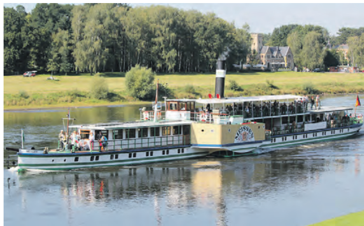
Auf schönster Strecke kreuzen die Reporter-Gäste auf der Elbe durch das Elbsandsteingebirge „unter Volldampf“.

Rahmenprogramm erwartet die Reisenden ein großer Panorama-Ausflug ins weltberühmte Elbsandsteingebirge mit Pillnitz und Bastei, eine herrliche Elbe-Kreuzfahrt auf schönster Strecke sowie ein großer Erlebnistag in Dresden mit Stadtrundfahrt/