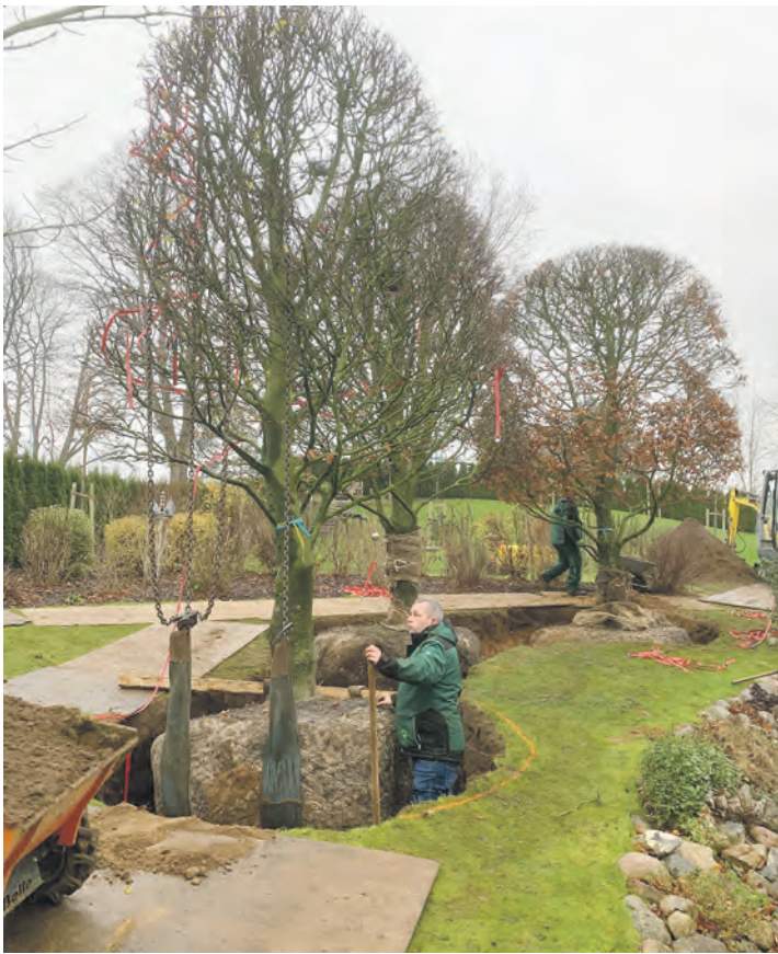
Ballenpflanzen sollten während der vegetativen Ruhezeit in den Boden gebracht werden.

In vielen Gärten bietet Buchs derzeit kein schönes Bild. Das zentrale Problem, das Buchsbäumen massiv zusetzt, ist der Buchsbaumzünsler – ein eingeschleppter Schädling aus Asien. Da der Kampf dagegen mühselig ist, empfiehlt Eskildsen, Buxus durch andere Gewächse ersetzen. Dabei geht es nicht nur um weniger Pflegeaufwand, sondern auch um ökologische Vorteile. „Eibe oder Ilex bieten nahrhafte Früchte für unsere heimischen Vögel“, so Eskildsen.