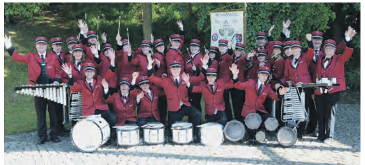
Der Malenter Spielmannszug ist bekannt für gute Musik – und seinen tollen Flohmarkt.

bekannten und beliebten Markt wird auch für das leibliche Wohl gesorgt. Stand-Betreiber (nur Privat-Anbieter) können sich bei Familie Buck anmelden unter Telefon 0 45 23-38 89 oder per E-Mail an m.buck-malente@t-online.de . Aufbau ist dann frühestens ab 7 Uhr.