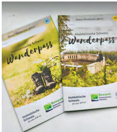
Die Wanderpässe sind in den Tourist-Informationen vor Ort zu erhalten.

einen Wanderpass komplett ausfüllt, erhält als Belohnung zusätzlich eine der farbigen Sondernadeln.