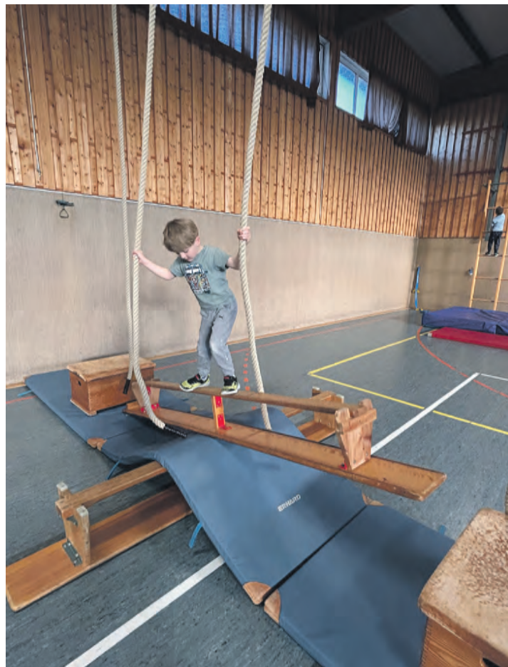
Nach schönen Erlebnissen in der Turnhalle wartet nun die Natur auf die Glasauer Kinder.

In der Turnhalle stand vor allem eines im Mittelpunkt: Bewegung, Gemeinschaft und Mitbestimmung. Die Kinder konnten sich bei abwechslungsreichen Gruppenspielen ausprobieren, gemeinsam Regeln entwickeln und ihre Ideen einbringen. Besonders wichtig war die Partizipation. Die Kinder durften mitentscheiden, welche Spiele gespielt oder wie Aufbauten gestaltet werden. Ein Highlight waren die Bewe-