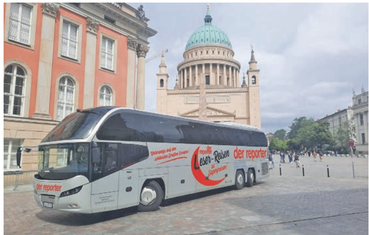
Welt-Kunst vom Feinsten erwartet die Leser in Potsdam und Berlin bei der großen Kunst-Sonderreise vom 27. bis 28. Juni.

Residieren werden die Gäste unserer Sonderreise im internationalen First-Class-Hotel mit großzügigem Schlemmerfrühstück vom Buffet in der Schlösserstadt Potsdam in Best-Lage direkt am Templiner See mit Hallenbad und Sauna, die