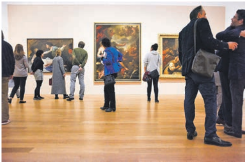
Europas spektakulärstes Kunstmuseum: das „Barberini“ im Herzen von Potsdam.

Anmeldungen zu dieser ganz besonderen Kunst-Reise, die sich bestens als Oster-Geschenk eignet, sind ab sofort bei den Reporter-Leser-Reisen des Burg-Verlages in Eutin Montag bis Freitag von 9 bis 13 Uhr unter Telefon 04521-701130 oder direkt online auf leserreisen.der-reporter.info möglich.