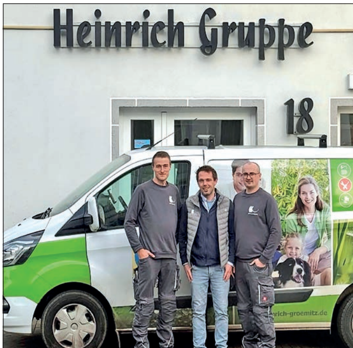
Sie erreichen uns unter: Tel. 04562-224610, info@heinrich-groemitz.de , www.heinrich-groemitz.de

oder Alternative zu klassischen Heizsystemen darstellen. Im gewerblichen Bereich – etwa in Gastronomie, Hotellerie oder Lebensmittelbetrieben – sind zuverlässige Kälteanlagen unverzichtbar für reibungslose Abläufe und gleichbleibende Produktqualität. Zum Angebot von Heinrich Haustechnik gehören die persönliche Beratung, eine durchdachte Pla-