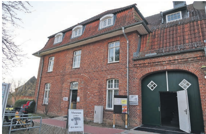
Nicht nur die Globus Werke feiern Jubiläum, auch das Heimatmuseum feiert in diesem Jahr das 30-jährige Bestehen

ber in der Region um Ahrensböck. Ganz ohne Zweifel ist das Werk damit ein wichtiger Bestandteil der Historie von Ahrensböck. Im Heimatmuseum der Stadt wurde nun ein aufwendig reproduziertes Bild der Globus Werke vorgestellt. Das Bild, ursprünglich 1972 aus einem Flugzeug aufgenommen, wurde im letzten Jahr als Druck auf einer Leinwand bei einer Räumung eines Lagers des Heimatmuseumsvereins entdeckt und daraufhin bis Dezember letzten Jahres von Hobbyfotograf Armin Redöhl, ebenfalls