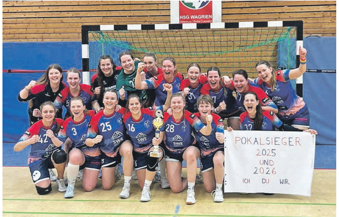
Die zweite Frauenmannschaft der HSG Holsteinische Schweiz hat den Kreispokal gewonnen.

Im Finale traf die Mannschaft auf die erste Damenmannschaft der HSG Ostsee Neustadt/Grömitz, die ihr Halbfinale kampflos gewonnen hatten, nachdem der MTV Ahrensböök nicht angetreten