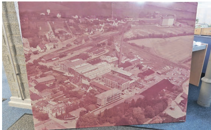
Das originale Bild wurde erst im letzten Jahr in einem alten Depot des Vereins entdeckt.

ihre 120-jähriges Jubiläum und schauen auf eine lange Historie zurück. Zunächst gegründet, um Gummidichtungen für Konservengläser und Einkochringe herzustellen, erweiterte die Firma ihre Produktion mit der Zeit und stellte auch Radiergummis sowie technische Gummiteile für Maschinen her. Nach dem Zweiten Weltkrieg wuchs das Unternehmen stark und entwickelte neue Verfahren zur Verarbeitung von Gummi. Heute produziert die Firma vor allem technische Gummiprodukte wie Schläuche, Schnüre und Profile und ist ein wichtiger Arbeitge-