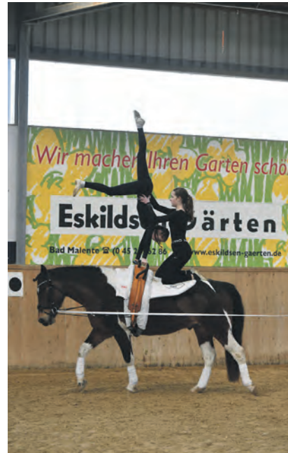
Das Showprogramm der Voltigiergruppe des Ostholsteinischen Reitervereins ist immer ein Highlight.

statt. Ab 14 Uhr folgen dann die Nachwuchswettkämpfe für die Kleinsten mit einem Führzügel- und einem Reiter-Wettbewerb. Den Abschluss des Tages bildet das Jump & Run ab ca. 16 Uhr. Nach dem ruhigen Sonnabend steht dann für den Sonntag ein deutlich gepacktes Programm an. Ab 8 Uhr werden die Dressurreiter an den Start gehen. Mit bis zu 30 Teilnehmern in einer Prüfung sind die Dressurprüfungen wieder sehr gut angenommen werden. Um 13.30 Uhr findet noch einmal ein Reiter-Wettbewerb statt, bevor es ab 15.30 Uhr mit der höchsten Prüfung des Tages, einer Dressurreiterprüfung der Kl. L los geht. Nicht fehlen darf natürlich auch das Showprogramm der Voltigiergruppe des Vereins. Diese werden am Sonnabend in der Mittagspause um ca. 13.30 Uhr ihren großen Auftritt haben.