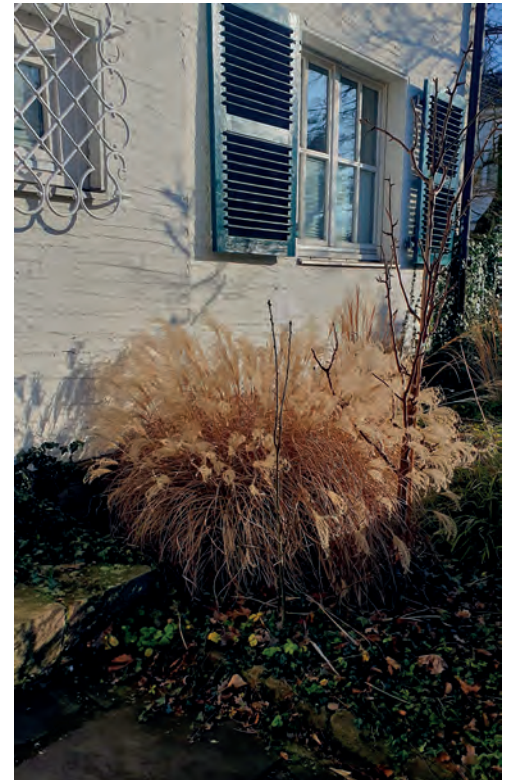
Der Miscanthus (Schilfgras) steht zerzaust im Vorgarten und wartet auf den Schnitt.

Mit dem Schnitt kommt Licht und Luft an den Gräserhorst und es zeigen sich zugleich eventuelle Lücken im Beet. Wer nur wenige dieser Gräser hat, schneidet mit der normalen Gartenschere eine Handbreit über