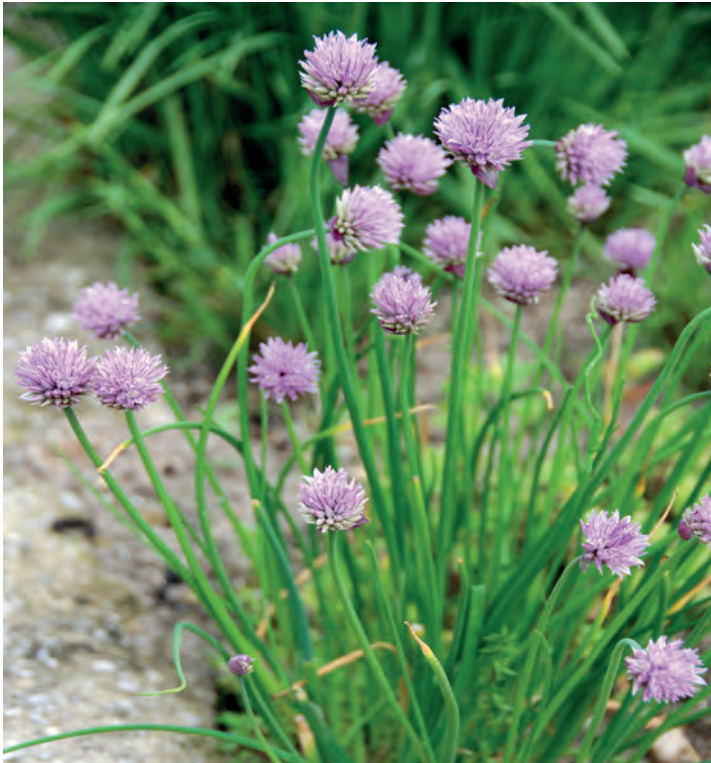
Der Schnittlauch aus dem eigenen Garten ist Schmuck ... und leckere Salatbeigabe.

auch im Nutzgarten mit Gewächshaus: Der Garten ist jetzt jeden Tag mehr ein Ort voller Möglichkeiten. Wer sich direkt an die Realisierung seiner Wünsche machen möchte, findet auf www.meintraumgarten.de eine Liste mit Fachbetrieben des Garten- und Landschaftsbaus in der Nähe.