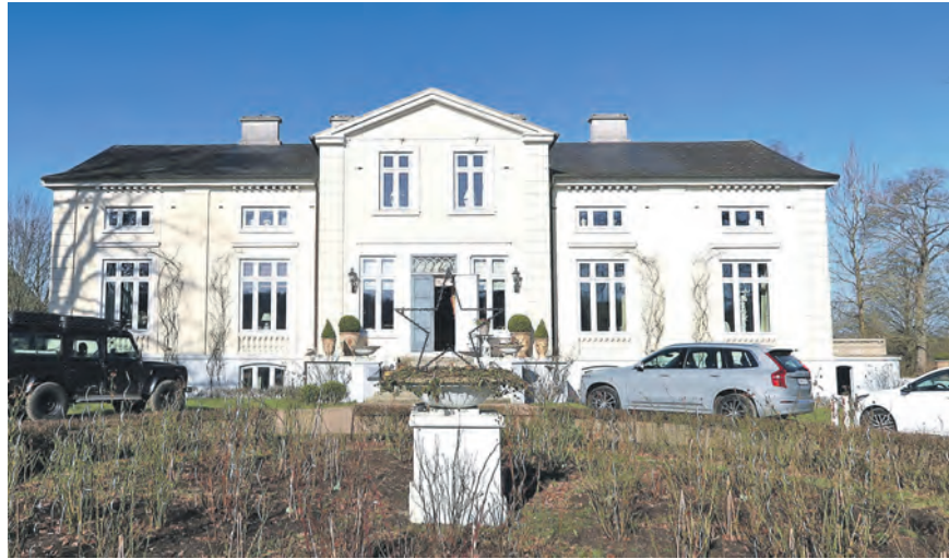
Gut Heuerstubben präsentiert sich in neuem Glanz.

schaffen, an dem Menschen das historische Anwesen erleben können. Das Trauzimmer selbst bietet Platz für bis zu 25 Personen und wurde bereits im Februar für die erste Trauung genutzt. Weitere Anfragen und Reservierungen liegen bereits vor. Für die Gemeinde Ahrensböök stellt Gut Heuerstubben eine wertvolle Alternative dar. Bisher war das Bürgerhaus die einzige Möglichkeit für standesamtliche Trauungen. Mit dem neuen Trauzimmer entsteht nun eine zusätzliche Option, die sich besonders durch ihr