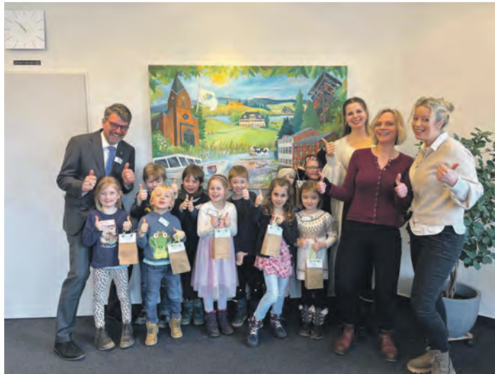
Bürgermeister Heiko Godow nahm sich am 26. Februar viel Zeit für die jungen Besucher im Rathaus.

Der Besuch ist Teil des Demokratieverständnisses im AWO-Kinderhaus. Denn Demokratie beginnt nicht erst in der Schule, sie wird im Kinderhaus bereits aktiv gelebt. Zehn engagierte