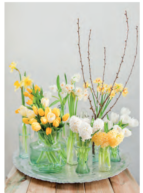
Ein frühlingshaftes Arrangement ohne Wartezeit: Hier sind Tulpen, Narzissen und Hyazinthen zu sehen.

egal für welche Dekoidee man sich entscheidet: Tulpen dürfen beim Osterfest nicht fehlen - wie gut, dass es sie aktuell überall gibt! tionsfreudigste Pflanze in der Schnittblumenwelt. Tatsächlich gibt sie frisch angeschnitten ein Sekret ins Vasenwasser ab, welches die Leitungsbahnen in den Stängeln anderer Blumen verstopft und sie schnell verderben lässt - fast so, als wolle die Narzisse keine anderen Schönheiten neben sich dulden. Man sollte ihr daher (übrigens genauso wie Hyazinthen) einen Vorsprung von 24 Stunden geben, in denen sie separat im Wasser stehen kann. Danach werden die Stiele abgewaschen und kommen - ohne erneutes Anschneiden - zusammen mit den Tulpen in eine Vase. Wer auf diese Extraportion Arbeit keine Lust hat, greift ausschließlich zu Tulpen. Sie sind umgänglich und brauchen keine Sonderbehandlung