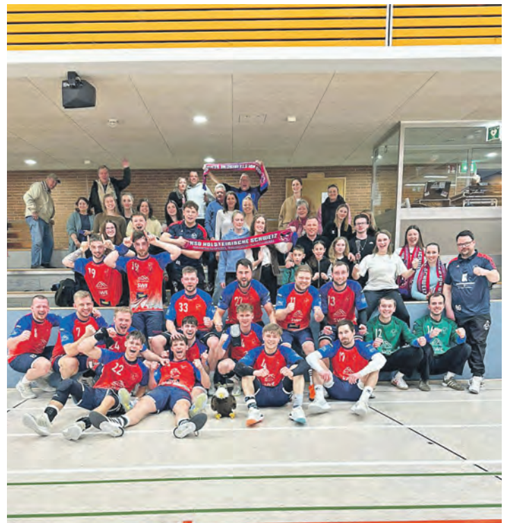
Zwei Stunden Anfahrt schrecken die HSG-Fans nicht – sie unterstützen das Team.