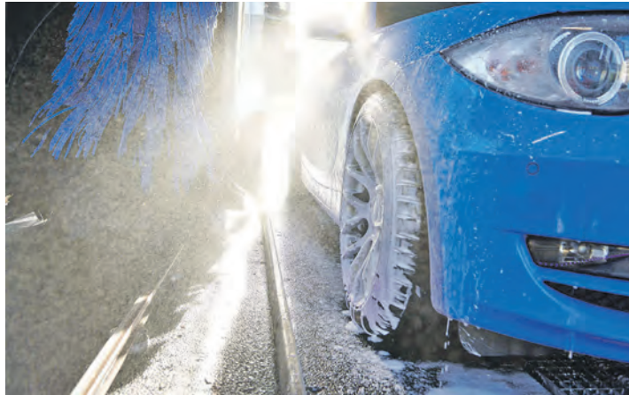
Nach dem Winter sollte dem Auto eine gründliche Fahrzeugwäsche spendiert werden.

Der Automobilclub von Deutschland (AvD) empfiehlt zunächst einen Blick auf die Reifen, sind sie doch das wichtigste Bindeglied zwischen Auto und Straße. Wer nicht auf Ganzjahresreifen unterwegs ist, der sollte bei Temperaturen dauerhaft über sieben Grad Celsius von Winter- auf Sommerreifen zu wechseln. Sie bieten auf trockener und nasser Fahrbahn bessere Haftung und verkürzen den Bremsweg. Winterreifen verschleifen bei Wärme schneller,