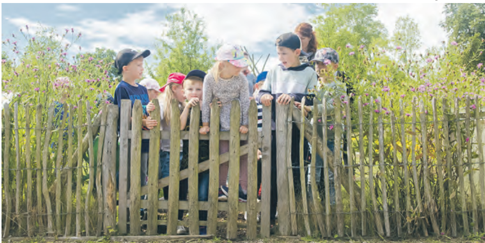
Im Küchengarten von Schloss Eutin erwarten Familien spannende Entdeckungen.

rung wird um eine Stornierung bis spätestens 24 Stunden vor Programmbeginn gebeten, um anderen Familien die Teilnahme zu ermöglichen. Weitere Informationen zu den Programmen und die Anmeldelinks gibt es auf der Website der Stiftungen der Sparkasse Holstein: www.stiftungen-sparkasse-holstein.de/ferienprogramm/ .