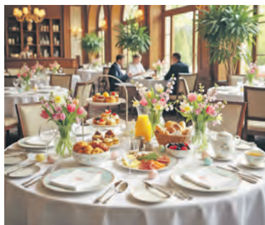
In den Restaurants der Region freut man sich darauf, Sie zu verwöhnen.

Ostholstein (aj). Steht Ihr Osterplan schon? In den Restaurants der Region laufen die Vorbereitungen der Profis auf Hochtouren. Vom Karfreitagessen über den Osterbrunch und das Festtagsmenü bis zur üppigen Kaffeetafel – der Saisonstart bietet, was das Genußherz begehrt. Gönnen Sie sich und Ihre Liebsten nach dem langen Winter fröhliche Stunden bei bestem Essen und reservieren Sie sich mit einem Tisch nicht nur Speis und Trank, sondern auch beste Laune und Zeit miteinander. Von Lamm bis Spargel, von griechisch bis holsteinisch reicht die Auswahl. Familienfreundlichkeit steht allorts ganz oben auf der Karte. Nach Eiersuche oder Ostergottesdienst werden die Restaurants