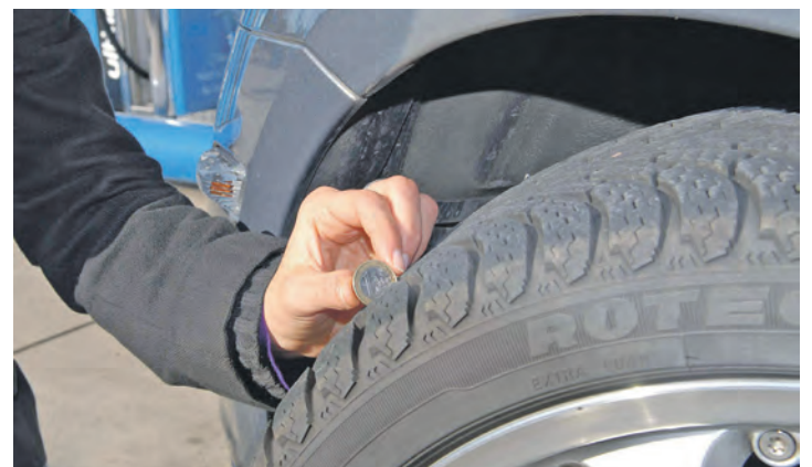
Profiltiefe am Reifen messen: Verschwindet der goldene Rand einer Ein-Euro-Münze, ist alles im grünen Bereich.

zeug hat, sollte die Spannung überprüfen lassen. Ein kurzer Batterietest in der Werkstatt schafft Klarheit über den Zustand und verhindert böse Überraschungen. Ebenfalls wichtig ist die Beleuchtung. Streusalz und Feuchtigkeit können Kontakte angreifen, Temperaturschwankungen setzen den Leuchtmitteln zu. Ein kompletter Lichttest ist schnell erledigt und erhöht die Sicherheit deutlich.