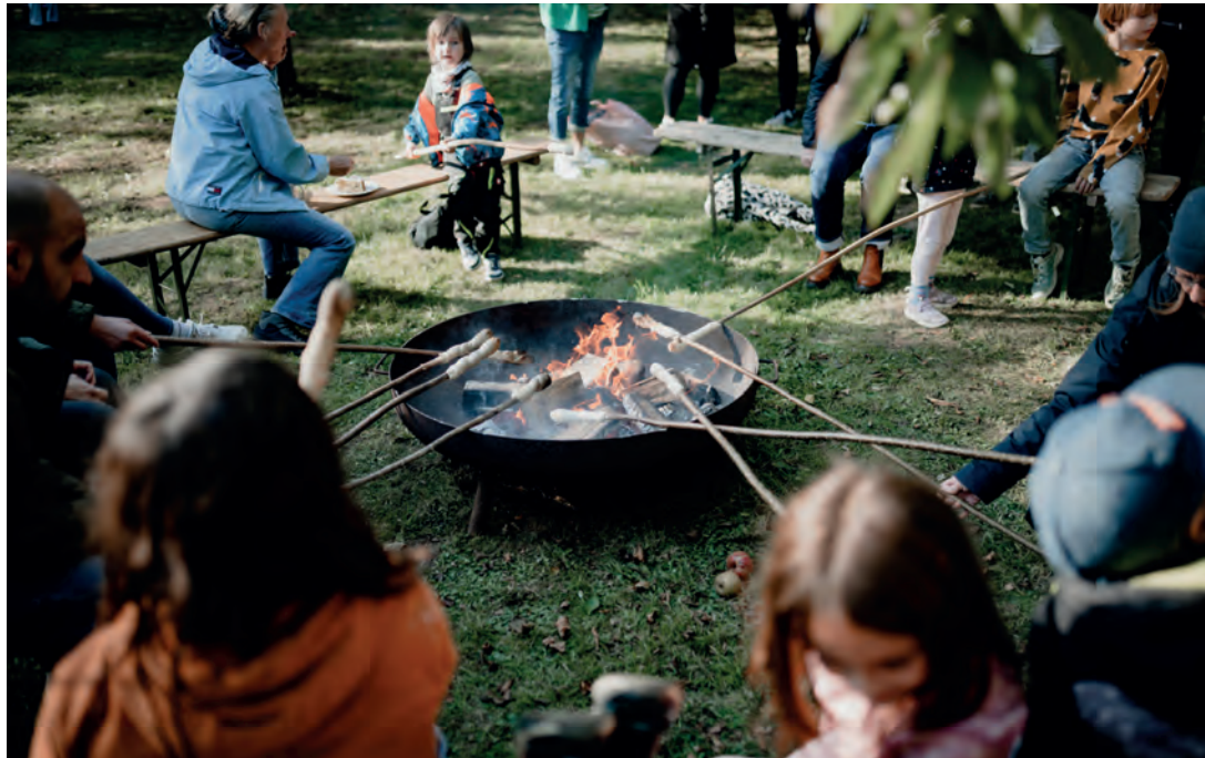
Erna steht für das Erlebnis von Natur und Gemeinschaft.

braucht es dafür verlässliche Ehrenamtliche. Aktuell ist auch die Stelle einer Pädagogin zu besetzen, die mit freier Hand die Ar-