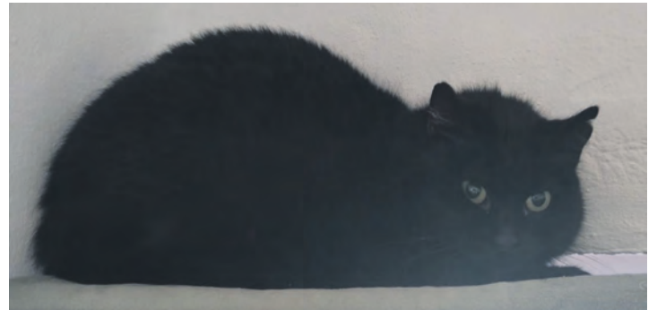
Die hübsche Ebony will ihre Zurückhaltung aufgeben.