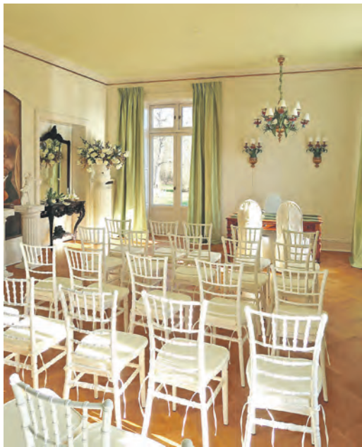
Bei bestem Wetter zeigt sich das neue Trauzimmer in historischem Ambiente.

Bis dahin können alle Ahrensböökerinnen und Ahrensbööker, sowie Gäste aus aller Welt ihren ganz persönlichen Moment auf Gut Heuerstubben erleben – sei es bei einer Trauung im neuen Trauzimmer oder einfach beim Besuch des historischen Anwesens.