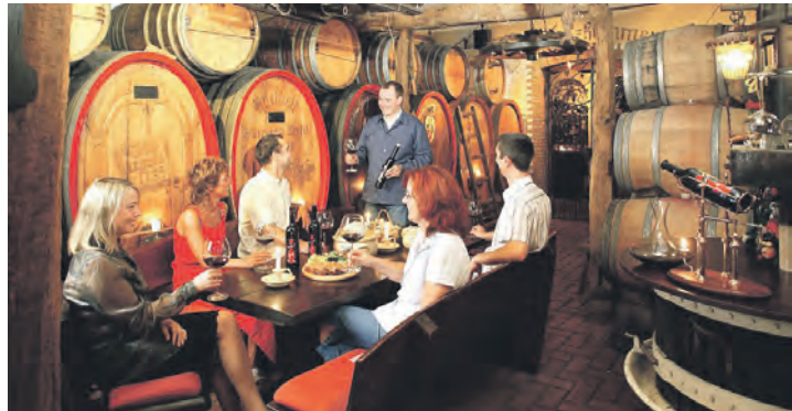
Höhepunkt einer jeder Wein-Reise an Rhein und Mosel ist eine besonders stimmungsvolle Weinprobe mit dem Winzer.

„Höhepunkten am Rhein“ mit Besuch im Weinstädtchen Rüdesheim mit Freizeiter zum Bummel in der Drosselgasse und eine mehrstündige Erlebnis-Schiffahrt entlang des Mittelrheins „rund um die Loreley“ sowie am nächsten Tag ein großer Erlebnis-Ausflug in die verträumten Mosel-Weindörfer entlang der Uferstraße und der Moselschleifen in die vielbesungene Weinstadt Cochem mit Freizeit und einer Genießer-Schiff-