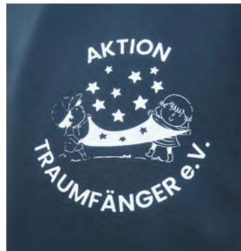
Der Verein Aktion Traumfänger erfüllt schwer kranken Kindern und Jugendlichen besondere Herzenswünsche.

terhin Flohmärkte veranstalten, um so weitere Projekte in der Region zu unterstützen. Der nächste Termin ist bereits an diesem Freitag, 13. März, ab 18.30 Uhr im DGV Ottendorf. Genauere Information findet man auf Instagram unter „nummernflohmarkt_dgv“.