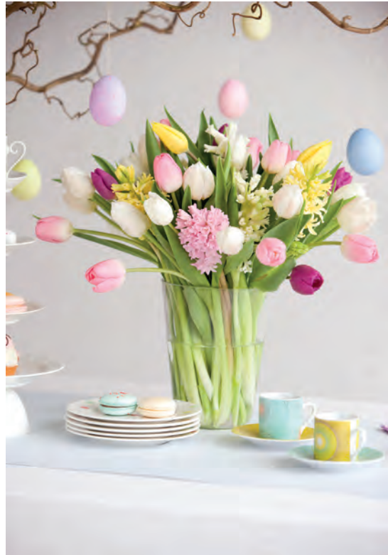
Frisch und fröhlich in hellen Farben verbreitet die- ser österliche Strauß.

me und als Zwiebelpflanze zeigt die Tulpe an sich jedes Frühjahr aufs Neue, wie das Leben nach den tristen, düsteren Tagen gewinnt. Tulpen und Ostern gehören also unbedingt zusammen. Wer nun kritisch den Finger hebt und die Osterglocke als ultimative Pflanze für die Festtage Anfang April ins Spiel bringt ... hat natürlich ebenso recht. Auch die Narzisse passt mit ihrem sonnigen Gemüt wunderbar in die österliche Deko und bildet mit der Tulpe ein perfektes Paar. In Kombination ergeben die beiden Zwiebelpflanzen herrlich fröhliche Arrangements, kombiniert mit Porzellanhasen, ausgeblasenen Eiern und frühlingshaften Zweigen - aber Achtung, die beiden Zwiebelpflanzen möchten langsam aneinander gewöhnt werden. Die Narzisse ist nämlich nicht die koopera-