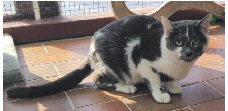
Runa möchte Mäusejägerin werden.

Wer die richtige „Neue“ für Fridolin zu Hause hat, wer zusammen mit Runa der Mäuseplage Herr werden oder wer der schönen Ebony ein Zuhause geben möchte, der melde sich bitte beim Tierheim im Diekstauen unter Telefon 04521-73644 oder per E-Mail info@tierheim-eutin.de .