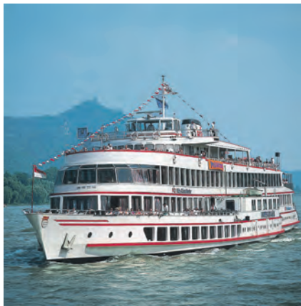
Herrliche Rhein- und Mosel-Kreuzfahrten gehören zum großen Genießer-Programm der Reporter-Sonderreise.

Fernreisebus direkt ab Eutin ohne weitere Einsammeltour drei Übernachtungen im Winzer-Hotel nebst Gästehaus direkt am Rhein mit dreimal Schlemmerfrühstück vom Buffet und drei Abendessen im Hotel als Buffet oder Drei-Gang-Menü. Zum Rahmenprogramm gehören preisinklusive ein großer Panorama-Ausflug zu den