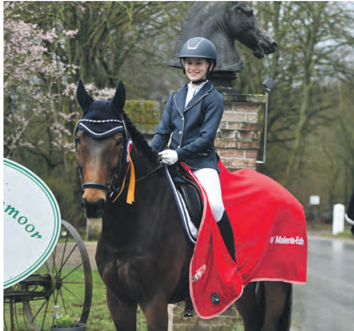
Die Wettbewerbe laufen an zwei Tagen.