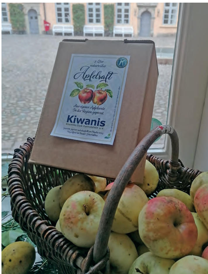
Erstmals haben die Kiwanier ihre Äpfel zu Saft mosten lassen, der für den guten Zweck verkauft wird.