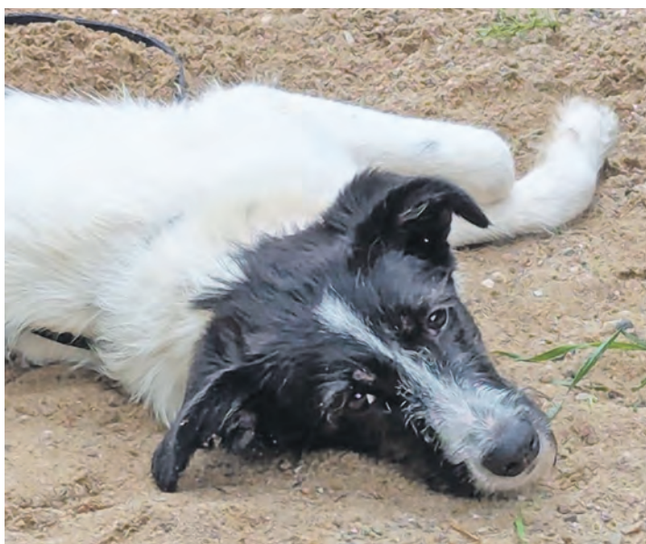
Die schüchterne Greta freut sich auf ein neues Zuhause bei einem Hund.

abgegrenzter Raum würde ihr und auch den neuen Besitzern Sicherheit geben. Die ansonsten sehr nette Hündin ist zunächst auch bei Menschen natürlich