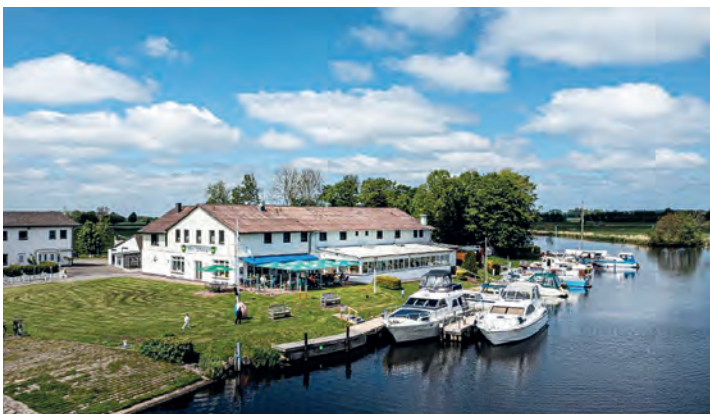
Im berühmten Fährhaus an der Eider erwartet die Leser das großen Winter-Schlemmerbuffet mit vielen regionalen Spezialitäten.

Dieses Jahr werden die Gäste sowohl im Bäckerslüüd Café (Markt 16) als auch im Restaurant Markt 17 willkommen geheißen, Räume und die Terrasse werden dafür gemeinsam genutzt. Es soll auch um einen Taxi-Service und Aktivitäten gehen – zwei Ideen, die direkt nach den Weihnachtsveranstaltungen des letzten Jahres entstanden sind. Die Entscheidungen werden gemeinsam im Treffen besprochen und allen, die nicht teilnehmen können, anschließend mitgeteilt. Wichtig: Wer nicht am Vorbereitungstreffen teilnehmen kann, kann trotzdem am 24. Dezember helfen.