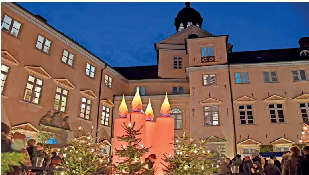
So schön soll es auch in diesem Jahr im Innenhof des Schlosses leuchten.

um Spenden gebeten. Denn an die Kinder wird nicht nur mit dem familienfreundlichen Programm, zu dem auch eine Mitmach-Werkstatt gehört, und moderaten Preisen gedacht. Der Erlös fließt komplett in Projekte für die junge Generation. Geöffnet ist am Sonnabend von 13 bis 19 Uhr und am Sonntag von 12 bis 18 Uhr.