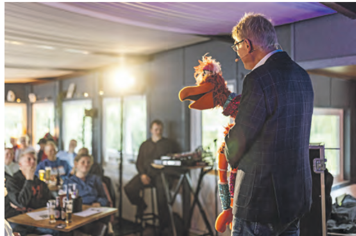
Das Publikum im Kajott hatte Spaß.

Auch die zweite Auflage verspricht ein abwechslungsreiches Programm und einen unvergesslichen Abend: Im Februar 2026 stehen Don Clarke, der „Natural Born Comedian“ mit einer gehörigen Portion britischem Humor, und Özgür Cebe, Kaba-