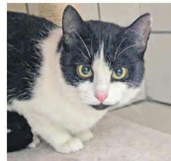
Die hübsche Paloma möchte am liebsten als Einzelkatze leben.

Wer also einer Katze oder gleich einem Doppelpack ein schönes Zuhause bieten kann oder bei wem ein Hundepartner auf Greta wartet, der melde sich bitte beim Tierheim im Diekstauen unter Telefon 04521-73644 oder per E-mail an info@tierheim-eutin.de .