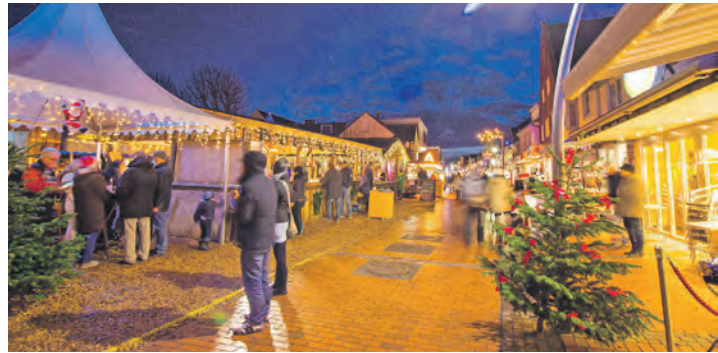
Der „Büsumer Winterzauber“ ist ein traumhafter Wintermarkt mit vielen regionalen Spezialitäten aus Dithmarschen.

Die Reporter-Winterfest-Sonderfahrt ist ab sofort bei den Reporter-Leser-Reisen des Burg-Verlages in Eutin unter Telefon 04521-701130 – täglich von 9 bis 13 Uhr – oder direkt online auf leserreisen.der-reporter.info buchbar. Gerne werden auch attraktive Reise-Gutscheine zur Verfügung gestellt.