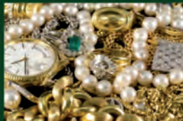
Ankauf von Diamantenringe