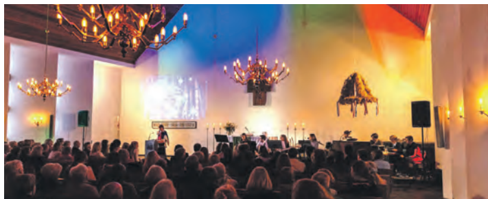
Gottesdienst einmal anders: In Fissau kam die Kombination ABBA und Abendmahl gut an.

Nach der Premiere im Herbst steht diese Wiederholung ganz im Zeichen einer Spendensammlung: Die Einnahmen sind für