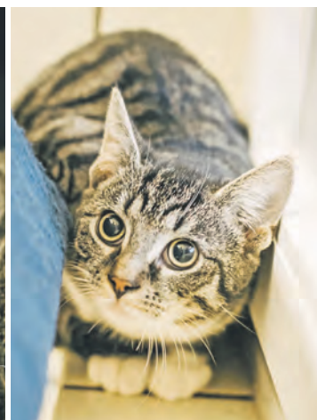
Mutter Georgia und Sohn Ohio suchen zusammen ein neues Zuhause.

man sich natürlich noch gern von seiner Mutter verwöhnen. Und Georgia ist mit ihren drei Jahren ja auch eine junge Mutter. Aber die Schüchternheit hat sie ihrem Sohn mitgegeben. Beide brauchen also etwas Zeit, um anzukommen und Vertrauen aufzubauen. Später würden sie sich gerne auch zusammen draußen umsehen.