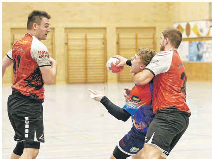
Die Löwen Abwehr verteidigt hart gegen den HSG-Angriff.

Beim Stand vom 8:4 zwang die HSG so den Gästetrainer bereits in der 13. Minute in die Auszeit. Die Tills Löwen stellten ihren Angriff um und spielten nun fast durchgängig im „7 gegen 6“ ihre Angriffe aus. Infolgedessen waren die Löwen nun torgefährlicher aber bei Ballverlusten stand das Tor leer. Nach der Auszeit verlief die Halbzeit wieder mehr auf Augenhöhe. Die HSG kam über ihre erste und zweite Welle zu Toren, tat sich aber im Positionsangriff sehr schwer und musste sich erneut über ihre vergebenen freien Würfe ärgern.