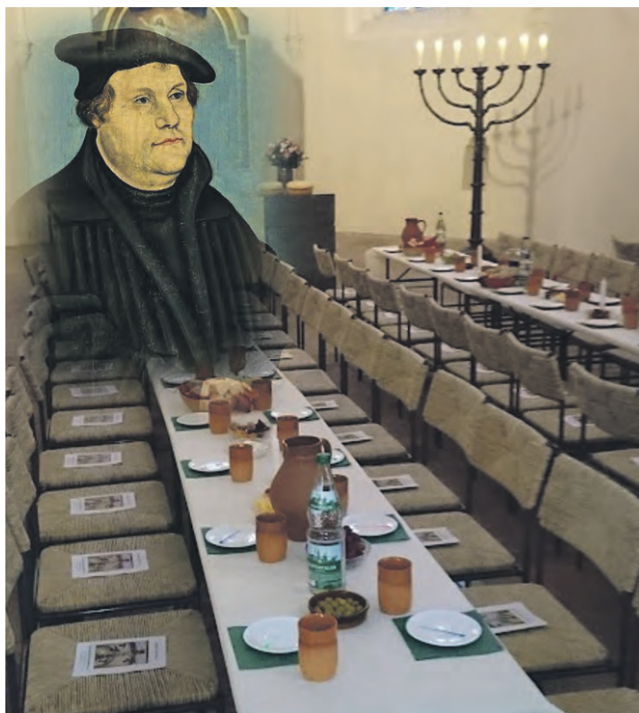
In der Eutiner Michaeliskirche ist die Luther-Tafel zum Reformationstag bereits gedeckt.