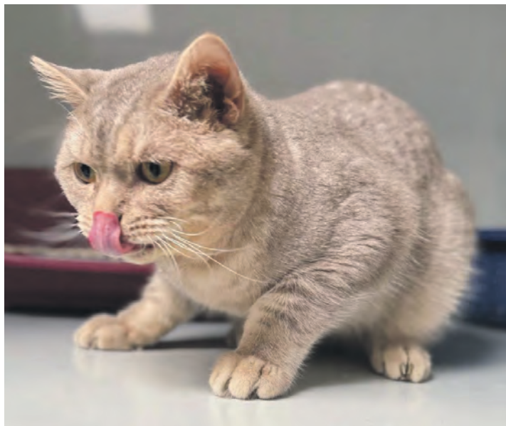
Der süße Leo visiert ein Leckerli an.

Bisher war Leo ein reiner Wohnungskater, aber nach einer Eingewöhnungszeit in seinem neuen Zuhause wird er bestimmt auch mal wissen wollen, was da draußen so los ist. Mit Ausnahme der Tierärztin findet Leo Menschen eigentlich gut. Denn mit denen, außer eben der einen, kann man gut schmuse oder spielen. Hektische Bewegungen allerdings sieht Leo eher als Aufforderung zu einem Schaukampf, weswegen kleinere Kinder im neuen Zuhause nicht so geeignet sind. Schick sieht sie aus in ihrem hautengen Body. Den muss Tilda aufgrund der kürzlich erfolgten Kastration vorübergehend tragen, um die Wundnähte zu schonen. Tilda ist eine ganz süße, liebe und schmusige kleine Katze. Ihrem Charme kann man kaum widerstehen, da macht es auch nichts, dass sie aus welchen Gründen auch immer, keine Zähne mehr hat. Am Alter liegt es vermutlich nicht, denn Tilda macht einen noch sehr