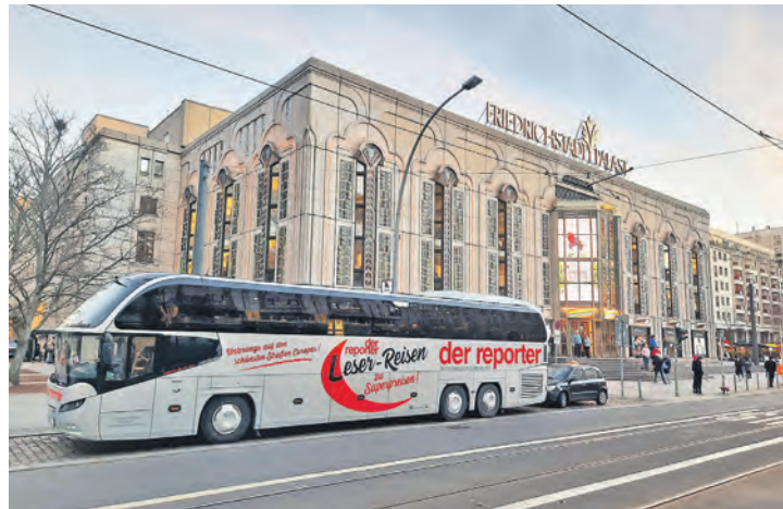
Die Weihnachts-Geschenkidee der Extraklasse: Mit dem Reporter-Bus in den Friedrichstadtpalast Berlin.

Höhepunkt des Shopping- und Erlebnis-Weekends ist sodann am Samstagabend der Besuch im berühmten Friedrichstadtpalast Berlin inklusive Hin- und Rücktransfer mit der nagelneuen Großrevue like Las Vegas mit „Blended by Delight“ inklusive Eintrittskarten (Höherwertige Eintrittskarten in allen Kategorien bei uns buchbar). Atemberaubende Büh-