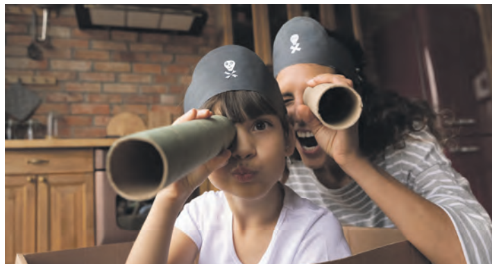
Viele tolle Angebote hat die Volksbank Eutin für junge Sparer vorbereitet.

schalter, Glücksrad, Kindertattoos, Infos zu ubiMaster und der Geschenkeausgabe. Auch in den Filialen in Malente, Ahrensböck, Scharbeutz und Timmendorfer Strand gibt es Aktionen rund ums Sparen. Eine Besonderheit in diesem Jahr: Die Volksbank Eutin verabschiedet sich vom klassischen Sparbuch. Mit der Umstellung auf Loseblattsparkonten werden künftig alle Umsätze im Online-Banking der Eltern oder auf dem Kontoauszug sichtbar. Kinder, die am Weltspartag Geld einzahlen, geben ihr Sparbuch