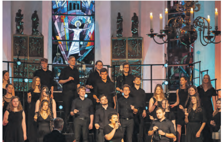
Der Jugendchor Oldesloe ist ein Stammgast in der Kleinmeinsdorfer Lutherkirche.

Konzert mit besonderer Vitalität und anspruchsvollen Gospel-Arrangements. Mit Songs der Black-Gospelmusic und aktuellen Titeln im Programm darf sich das Publikum auf ein beeindruckendes Gospelerlebnis freuen. Präsentiert werden bekannte Stücke wie „Oh Happy Day“, Songs aus Musical und Film wie „Halleluja“ aus dem Film „Shrek“ oder „Schattenland“ aus „König der Löwen“ sowie „Baba yetu“, eine Vaterunser-Komposition auf Suaheli, und von jungen Solostimmen interpretierte Balladen. Der Chor wird am Klavier von Henning Münther geleitet und begleitet. In der Pause gibt es Getränke und Schnittchen.