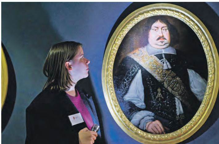
Schloss Eutin steckt voller „Mörderischer Geschichten“ – an Halloween werden sie erzählt.

Dabei waren einige Schloss-Bewohnerinnen und -Bewohner in seltsame, tragische und sogar düstere Begebenheiten verstrickt. Die Führung „Mörderische Geschichten“ erzählt Gästen von wahrlich schauderhaften Sammelleidenschaften, tragischen Todesumständen, ungeklärten Rosenkriegen und Fällen wie aus einem Krimi. Bühnenreif erscheint etwa der Tod Gustav III., König von Schweden. Das Porträt zeigt ihn herrschaftlich, gekleidet mit himmelblauem Samt und Edelsteinen. Der junge König setzte Reformen um, die damals so unerhört modern wa-