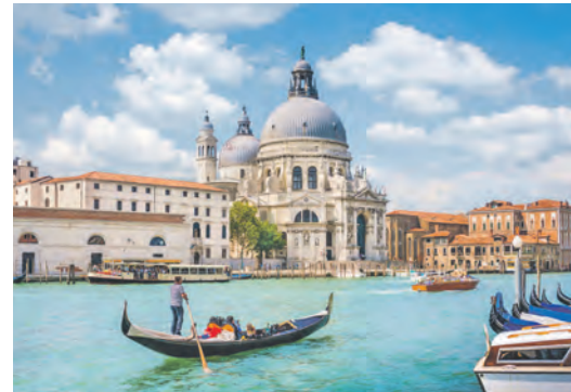
Eines der attraktiven Ausflugsziele der Gardasee-Reise ist die weltberühmte Lagunenstadt Venedig.