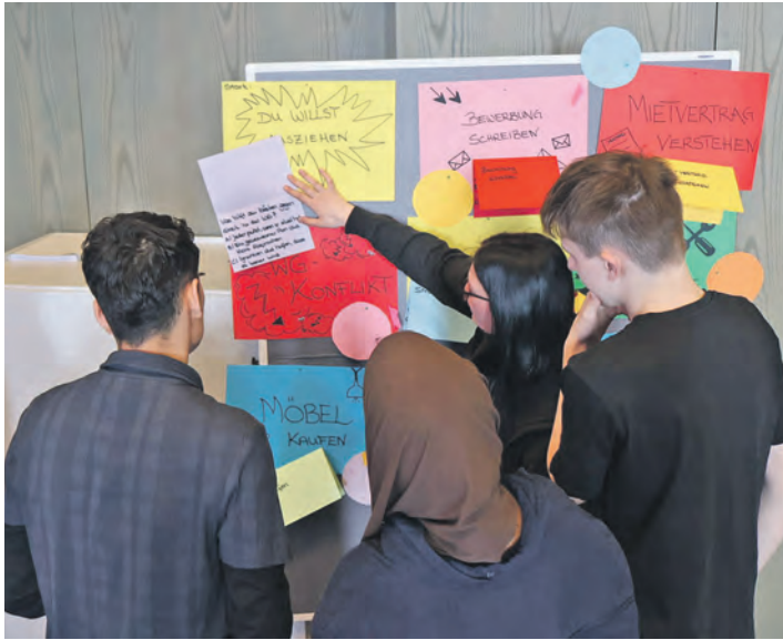
Bei dem „Wohn[t]raum“-Kurs werden die verschiedenen Themen auch in Gruppenarbeit von den Jugendlichen und jungen Erwachsenen erarbeitet.

Eutin (t). Nachdem im erfolgreichen ersten Durchgang 30 junge Menschen am Projekt „Wohn[t]raum“ teilgenommen haben, bietet der Kreis Ostholstein einen zweiten Durchgang des Wohnführerscheins an. Junge Menschen im Alter von 16 bis 27 Jahren haben die Möglichkeit, einen kostenfreien Wohnführerschein zu erwerben. Das Angebot „Wohn[t]Raum“ richtet sich an alle, die kurz davorstehen, in die erste eigene Wohnung zu ziehen, und vermittelt praxisnahes Wissen rund um die Themen Mieten und Wohnen. Wohnen ist ein Grundbedürfnis – auch junge Menschen streben danach, möglichst bald auf eigenen Füßen zu stehen, zu Hause auszuziehen und in den „eigenen vier Wänden“ zu leben. Doch wie geht das? Wohnungsunternehmen und Vermieter registrieren zunehmend, dass es jungen Menschen bei der Anmietung ihrer ersten eigenen Wohnung oft an ausrei-