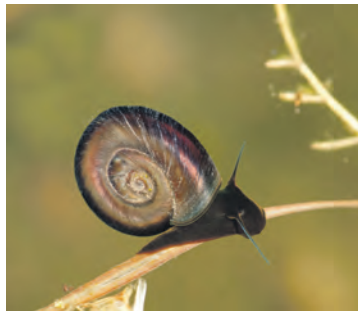
Eins, zwei oder drei – welcher Kandidat darf es sein (v.l.): die Posthornschnecke, das Grüne Heupferd oder die Mauer-Zebraspringspinne?

Die drei Tiere haben jeweils eines gemeinsam: „Man muss ganz genau hinschauen, um sie zu entdecken. Und genau deshalb haben sie es verdient, dass wir