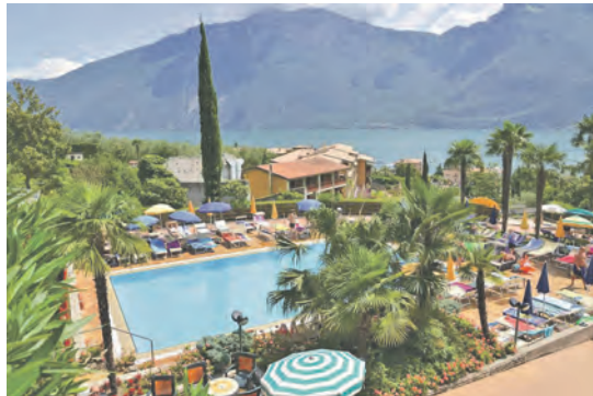
In traumhafter Lage in Limone am Gardasee erwartet das First-Class-Hotel unsere Leser*innen.

Eutin (t). Zum ganz besonders günstigen Sonderpreis erleben unsere Leser eine glanzvolle Sonnen-Erlebnis-Reise an den Gardasee vom 14. bis 20. April 2026 (Blüten-Reise) oder vom 20. bis 26. Oktober 2026 (Weinlese und Orangen-Ernte) zum Superpreis von nur 599,90 Euro. Es geht an den größten italienischen See bei warmen Temperaturen mit seinem einzigartigen, milden Klima und der üppigen Mittelmeer-Vegetation, die Sie begeistern wird. Sie werden in einer komfortablen Vier Sterne-Hotelanlage, umgeben von Oliven- und Zitronenhainen, im beliebten Urlaubsort Limone erwartet. Das Hotel verfügt über ein Panorama-Hallenbad sowie subtropische Gärten mit großen Frei-Schwimmbädern und Liegewiesen. Kulinarisch werden Sie rundum mit den üppigen und reichhaltigen Schlemmer-Bufferfs verwöhnt; Außerdem erhalten Sie zum Abendessen „all inclusive“-Getränke ohne