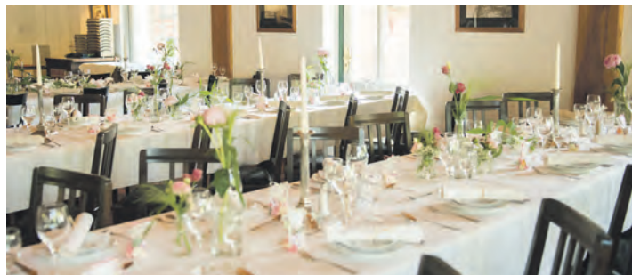
Ab November stehen Räumlichkeiten im Landgasthof Kasch als Veranstaltungsort für Kaffeetafeln, Trauerfeiern, Familienfeiern und Seminare zur Verfügung.

Weiterhin geöffnet ist das Gasthaus aber für Übernachtungen mit Frühstück, die weiterhin gebucht werden können. Montags bis don-