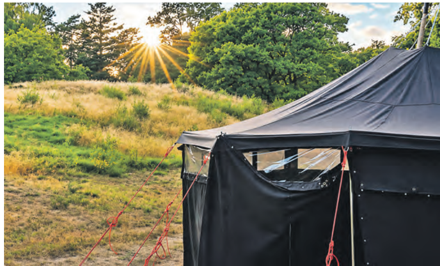
Im Sommer findet ein abwechslungsreiches Zeltlager voller Spiel, Natur und Gemeinschaft in Dänemark statt.

teten Kostümen für Mitarbeiter tauchen Kinder und Jugendliche in eine lebendige Geschichte ein, die das Zeltlager zu einem einzigartigen Erlebnis macht. Alle interessierten Kinder und Jugendlichen aus dem Kreis Plön und darüber hinaus sind willkommen. Die Kosten betragen 420 Euro, es gibt einen Geschwisterterrabatt. Weitere Infos gibt es online auf https://zeltlager-preetz.de oder per E-Mail an ev.jugend@kirche-in-preetz.de .