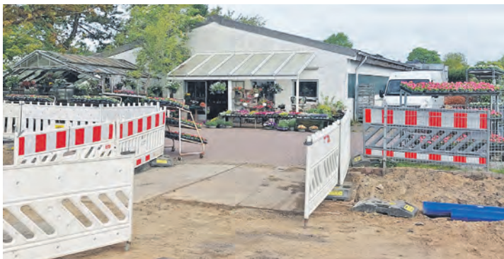
Ein Heranfahren ist derzeit nicht möglich, aber das Blumenhaus Puck hilft seinen Kunden, ihren Einkauf zum Fahrzeug zu bringen.