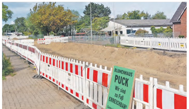
Die Baustelle im Eichkamp lässt Fußgänger passieren.