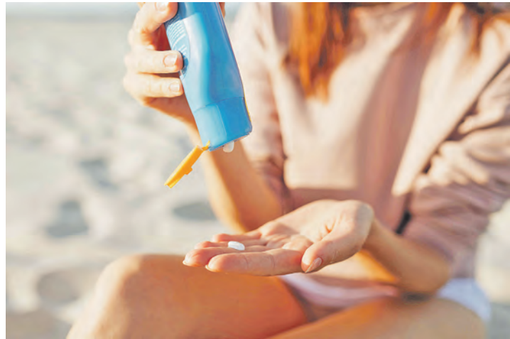
Nachcremen verlängert nicht die Schutzzeit.

merksam. Als zentrales Urlaubs- und Freizeitland mit direkter Nähe zur Küste spielt das Thema Sonnenschutz in Schleswig-Holstein eine besondere Rolle. Ob beim Segeln, Stand-up-Paddling oder beim Aufenthalt am Strand – viele Wassersportarten finden ohne natürlichen Schatten statt. Gerade in den Mittagsstunden zwischen 11 und 15 Uhr ist die UV-Belastung besonders hoch. In dieser Zeit ist ein konsequenter Sonnen-