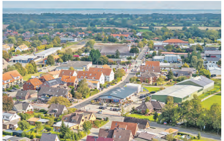
Luftaufnahme vom vergangenen Herbst, das die wandernde Baustelle rund um den Eichkamp zeigt.