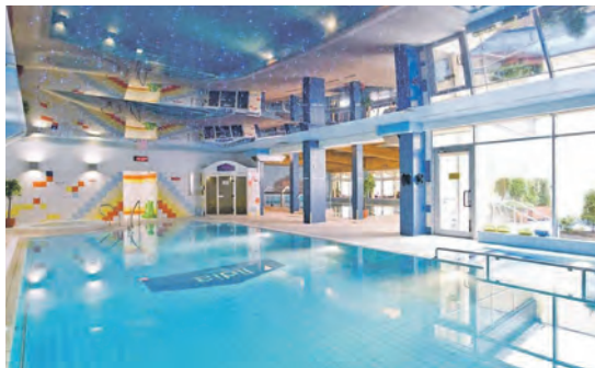
Herrliche Entspannung bietet die große Wellness- und Schwimmbad-Abteilung des Hotels.

zig mit Stadtführung und Freizeit zusätzlich gebucht werden. Ein fröhlicher Tanzabend und ein Bowling-Nachmittag jeweils im Hotel komplettieren das Programm optimal. Als besonderer Service sind große Komfortzimmer mit Balkon buchbar gegen Aufpreis von nur 29,90 Euro für alle vier Nächte. Einzelzimmer sind gegen Zuschlag von 148 Euro buchbar. Anmeldungen zu dieser Sonderreise sind ab sofort bei den Probsteer-Leser-Reisen des Burg-Verlages in Eutin – täglich von 9 bis 13 Uhr – unter Telefon 04521-701130 oder direkt online auf leserreisen.der-reporter.info möglich.