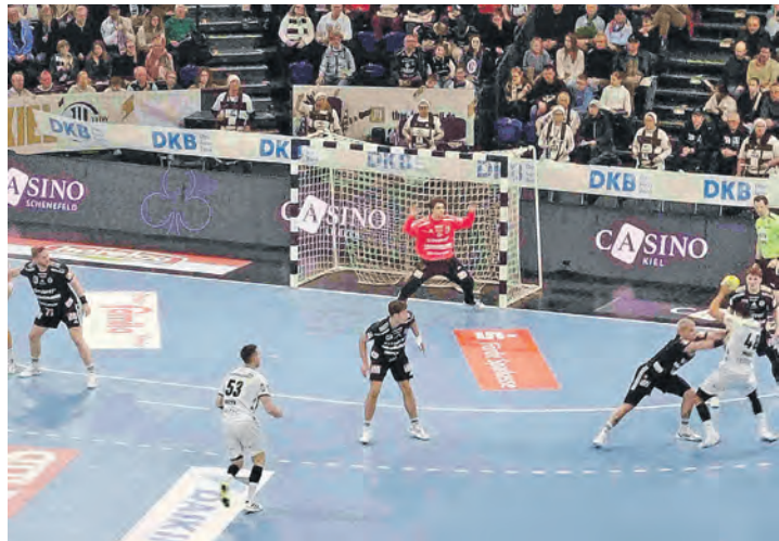
In den Finals wird es auch auf die THW-Offensive ankommen.

ab 18 Uhr, starten. Titelverteidiger ist die SG Flensburg, die einst Zebras-Bezwinger Montpellier mit 32:25 besiegen konnte. Wir tippen diesmal auf die Kieler, die ihren Pokalhunger stillen wollen und sich in Europa aktuell wohler fühlen als in der Bundesliga. In der Vorrundengruppe konnte der deutsche Rekordmeister alle Vergleiche gegen Flensburg und Montpellier gewinnen. Aus dieser starken Gruppe schafften es gleich drei Teams in die Hamburger Finals. Der große Außenseiter ist sicherlich die MT Melsungen. Aber der nationale Pokal hat gezeigt, wie schnell hier der vermeintlich kleine Verein in einem „k.o-Spiel“ den Sprung schaffen kann. Der SC Magdeburg kann bei seiner Niederlage im DHB-Halbfinale gegen den Bergischen HC davon berichten. Unser Tipp fürs Wochenende: Kiel gegen Flensburg, mit besserem Ende für