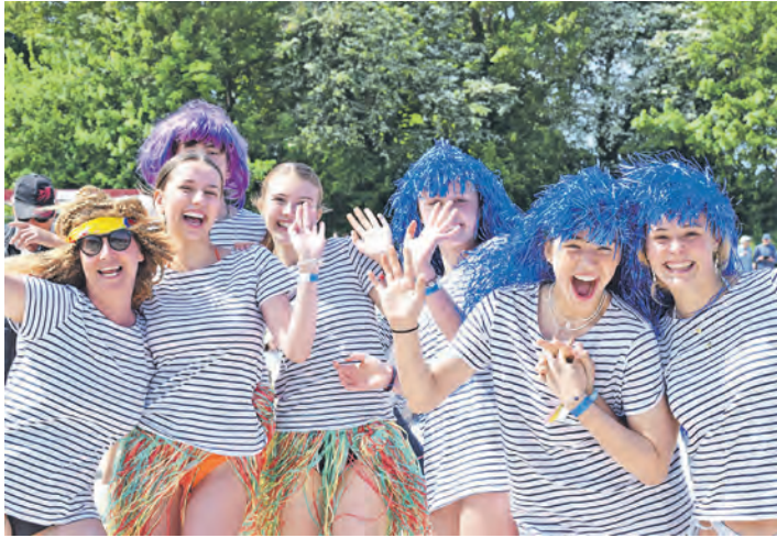
Anmeldungen von Teams sind ebenso gerne gesehen wie lustige Badeverkleidungen.

Heikendorf (t). Auch in diesem Jahr lädt das Ostseebad Heikendorf wieder zum gemeinsamen „Frische-Kick“ in die Badesaison an den Möltenorter Hauptstrand ein. Am Sonntag, 31. Mai, um 12 Uhr sind beim „Anbaden mit Rambazamba“ alle Gäste aufgerufen, sich in die Fluten der Kieler Förde zu stürzen. Für die passende Stimmung sorgt die Samba-Percussionformation Brincadeira. Für die Sicherheit ist die Wasserwacht des Deutschen Roten Kreuzes vor Ort. Treffpunkt ist am südlichen Strandzugang bei Zan-tops Sommerhaus. Erfahrungsgemäß beteiligen sich zahlreiche Teilnehmer, einzeln oder in Gruppen, an dem fröh-