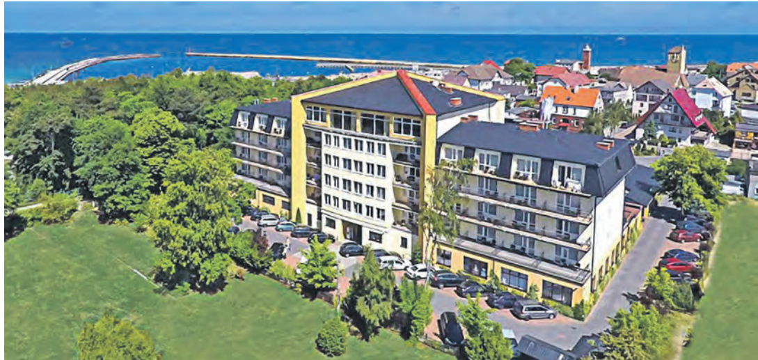
In Top-Lage am Meer befindet sich das exklusive Verwöhn-Hotel „Lidia“ an der Pommerschen Bernsteinküste.

Mönkeberg/Heikendorf (t). Einen Herbst-Knüller der Extraklasse präsentieren die Probsteer-Leser-Reisen zum Saisonabschluss 2026 zum absoluten Superpreis von nur 333 Euro mit einer exklusiven Verwöhn-Reise an die weltberühmte Pommersche Bernsteinküste vom 25. bis 29. Oktober: Die Leser genießen während der fünftägigen Luxus-Reise das internationale Verwöhn-Hotel „Lidia“ in der historischen Königsstadt Rügenwalde in Top-Lage direkt am Meer und Hafen mit deutschsprachigem Personal und Top-Service. Das alte Seebad mit der großen Geschichte erwartet die Reisenden zum Schlemmen und Genießen mit dem bei den deutschen Gästen so überaus beliebten „Lidia“-Hotel, das Top-Bewertungen bei „Holiday-Check“ vorweisen kann. Zum großen Leistungspaket gehören neben der Fahrt im erstklassigen Fernreisebusdirekt ab Kiel, Schwentinental und Preetz vier Übernachtungen im Vier-Sterne-Top-Hotel „Lidia“ mit sehr großzügigen und reichhaltigen Schlemmerbuffets zum Frühstück und Abendessen, die kostenlose Benutzung der großen Wellness-Abteilung mit zwei Schwimmbädern, Whirl-