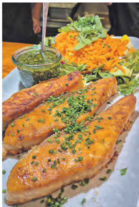
Lachsstreifen sind einer der Renner unter den zahlreichen Delikatessen im Angebot der Fischküche Laboe.

Kinder zu zahlreichen Aktivitäten ein, vom Basteln von Perlenketten über das Bemalen von Holzfischen bis hin zu kreativen Spielangeboten. Ein besonderes Highlight ist zudem „Aale Dieter“, Hamburger Urgestein, der Frischfisch unter die Flanierenden bringen wird. Der Erlös geht an „Starke Löwen eV“. Auch das Bühnen- und Rahmenprogramm hat es in sich: Mehrere Quizrunden sorgen für Spannung und Mitmachspaß. Zwischen den Programmpunkten sorgen Walking Acts für Unterhaltung rund um das Hafenbecken. Musikalische Einlagen