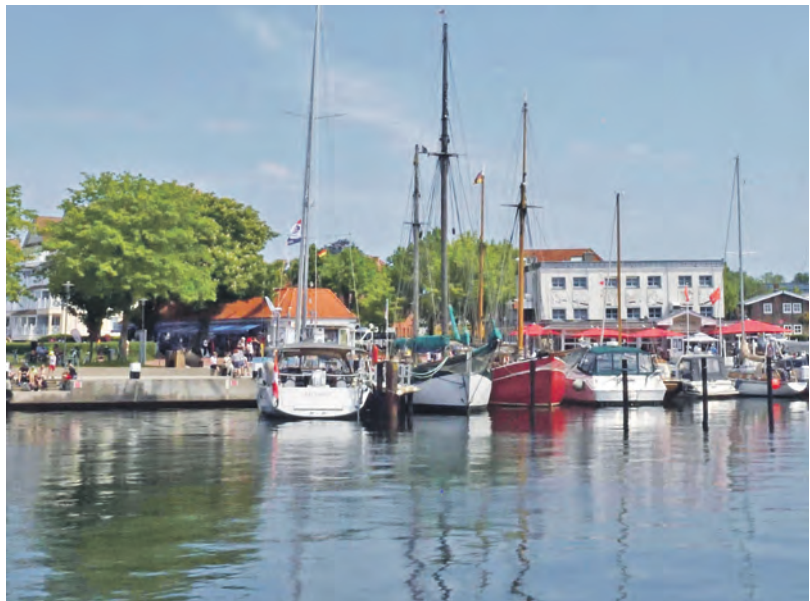
Die Fischküche Laboe lädt für Sonnabend, 18. April, zum Jubiläumsfest mit zahlreichen Aktionen am Hafen ein.

werden Erinnerungen, Anekdoten und Einblicke aus drei Jahrzehnten Gastronomie am Hafen geteilt. Dazu locken zahlreiche kostenfreie Mitmachangebote und Attraktionen rund um das Hafenbecken. Etwa mit einer spektakulären Aussichtsgondel. Sie ist höher als das Marine-Ehrenmal und bietet einen einzigartigen Blick über Laboe. Oder beim „Rodeo-Fisch“, bei dem Geschicklichkeit gefragt ist. Drei Spielzelle laden vor allem