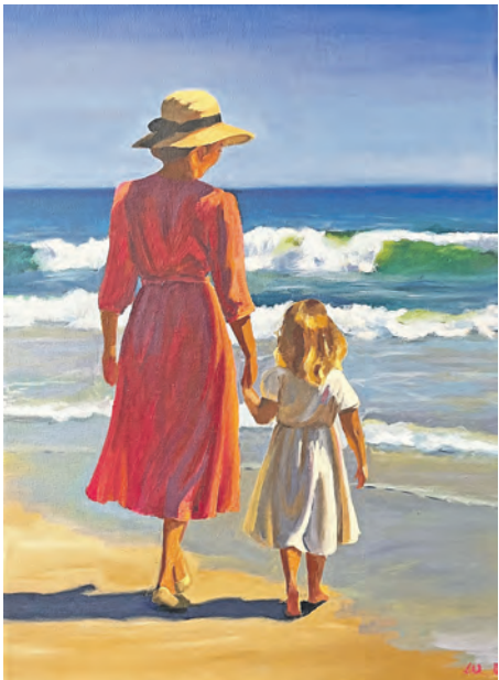
Dieses Bild heißt „An deiner Seite“.

Cornelia Maiwald greift diese Geschichte auf und widmet sich mit impressionistischen Ölgemälden der Beziehung zwischen Mutter und Kind sowie der Atmosphäre des Meeres. Ergänzt werden sie durch direkt am Meer entstandene „Plein-Air-Arbeiten“, die die Weite und Kraft der Küstenlandschaft einfangen. Begleitet werden die Bilder von der Lyrik Anna Monekes und der Musik des Komponisten Nicolas Kozuschek, die den Ausstellungsraum um poetische und klangliche Ebenen erweitern wollen.