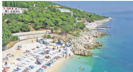
Traumhafte Strände bei warmen Temperaturen erwarten die Leser bei der großen Verlags-Sonderfahrt nach Kroatien.

Biere, Softdrinks, Wasser). Zum großen Leistungspaket gehören neben der komfortablen Busreise im erstklassigen Fernreisebus mit Waschaum/WC, Bordküche ab Kiel, Schwentimental und Preetz ohne weitere Einsammeltour auf der Hin- und Rückreise jeweils eine komfortable Zwi-