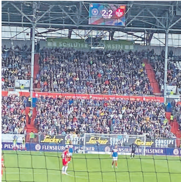
2022: Der letzte Kieler Heimpunkt gegen den FCK.

Kreis Plön (dif). Wenn heute Abend um 20.30 Uhr im KSV-Stadion am Mühlenweg der Anpfiff zum Zweitligaspiel Holstein Kiels gegen den 1. FC Kaiserslautern ertönt, ist die Route klar vorgegeben. Die Störche wollen mit dem zweiten Dreier in Folge weiter den Glauben an den Ligaverbleib aufrechterhalten. Nach dem starken 2:1-Sieg bei Fortuna Düsseldorf geht man gestärkt in diese neunzig Zweitligaminuten gegen die „Roten Teufel“. Mit den wichtigen Toren von Harres und Neki vor einer Woche hat sich der Bundesligaabsteiger etwas aus der bedrohlichen Lage befreien können. Gerettet ist die Elf von Trainer Tim Walter natürlich noch lange nicht. Dieser brachte am Rhein mit Ikem Ugoh aus der 2. Mannschaft einen Neuling, der einen gelungenen Einstand feierte und seine Sache mehr als gut machte. Nur zwei Tage nach dem Kieler Sieg wurde Fortuna-Coach Markus Anfang, der Aufstiegstrainer Holsteins aus dem Jahre 2017, von seinen Aufgaben entbunden. Und so sieht es vor dem Kick gegen Lautern in der unteren Tabellenhälfte aus: Die KSV hat durch den Sieg drei Zähler auf Eintracht Braun-