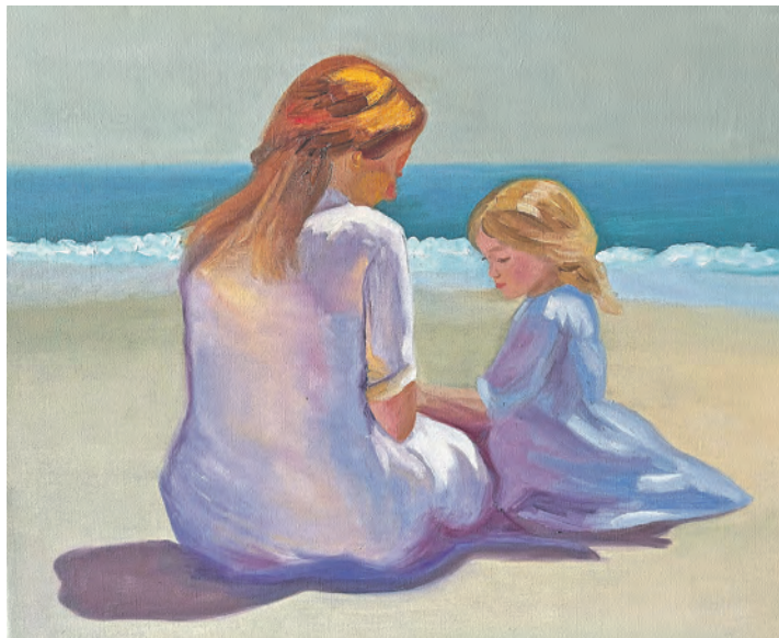
„Bei dir“, so lautet der Titel dieses Gemäldes von Cornelia Maiwald, das jetzt in der Ausstellung zu sehen ist.