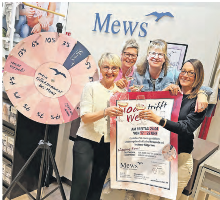
Das Team vom Modehaus Mews freut sich auf die Aktion „Mode trifft Wein“.