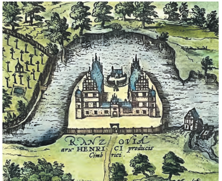
Das Gut Rantzau mit der Wassermühle an der angestauten Kossau. Detail eines Stiches von 1593 aus „Civitates Orbis Terrarum“ von Georg Braun und Frans Hogenberg.

Und so verbindet sich Historisches hier mit den brandaktuellen Themen, die zur Auseinandersetzung herausfordern, während Geschichte just passiert und Weichen für die Zukunft gestellt werden. Die Veranstaltung beginnt