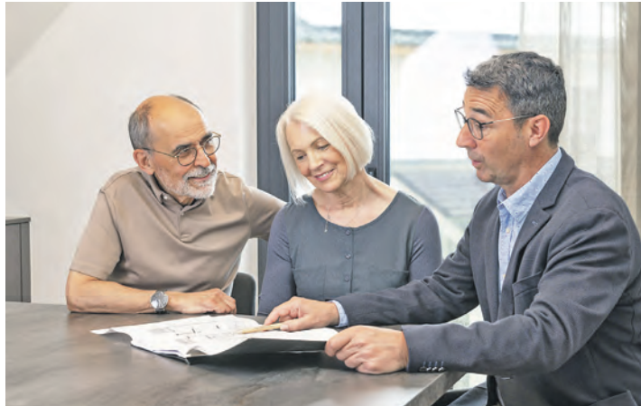
Wärmepumpen in größeren Gebäuden müssen regelmäßig geprüft werden.

Ostholstein/Kreis Plön (t). Nicht nur fossil betriebene Heizungen in größeren Gebäuden müssen regelmäßig geprüft werden – die Pflicht gilt auch für Wärmepumpen. Die ersten Anlagen sind im Januar 2026 unter die Prüfpflicht gefallen. Darauf weist das vom Umweltministerium Baden-Württemberg geförderte Informationsprogramm Zukunft Altbau hin. Gebäudeeigentümerinnen und Gebäudeeigentümer müssen die Anlagen nach einer vollständigen Heizperiode, spätestens aber zwei Jahre nach der Inbetriebnahme, untersuchen lassen. Die Regelung betrifft wassergeführte Luft-, Wasser- und Erdreichwärmepumpen, die nach dem 31. Dezember 2023 in größeren Gebäuden ab sechs Wohnungen eingebaut wurden. Sie gilt auch für Gebäudenetze mit mindestens sechs angeschlossenen Wohneinheiten. Gesetzliche Grundlage ist der Paragraph 60a