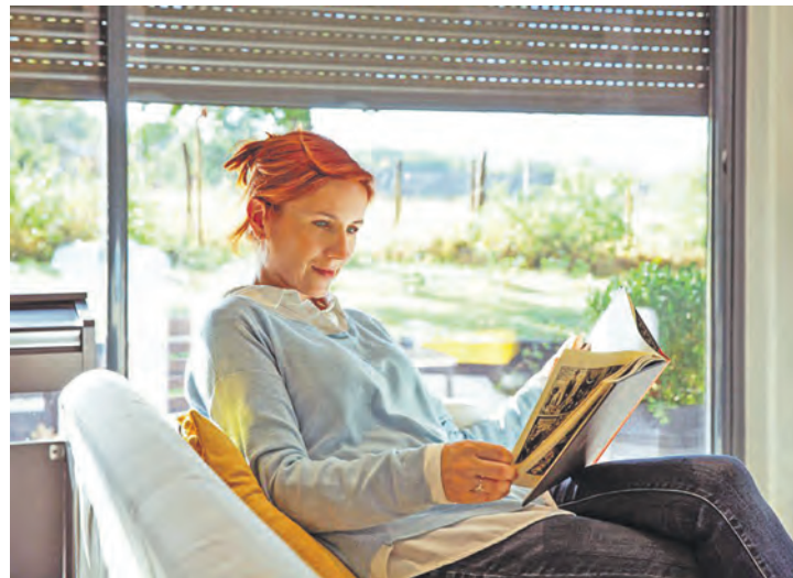
Neue Fenster leisten einen wesentlichen Beitrag, um Energie zu sparen und den Wohnkomfort spürbar zu verbessern.

Bei Systemen mit integrierter Solarversorgung liefert ein kleines Solarmodul am Rollladenkasten die Energie für den Antrieb und speichert sie in einem Akku. Eine separate Stromleitung oder zusätzliche Abstimmung mit einem Elektriker ist nicht nötig. Das erleichtert den Einbau ganz ohne Schmutz und Staub erheblich. Zu-