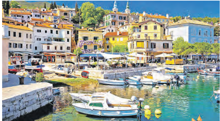
Malerische Städte und mediterranes Klima prägen die azurblaue Urlaubs-Küste in Kroatien.

Schönheiten und kulturellen Höhepunkten sowie malerischen Altstädten mit großer Geschichte freuen. Residieren werden sie im Vier-Sterne-Komfort-Bade-Hotel mit zwei großzügigen Pools (Innen- und Außenpool) und schöner Wellnessabteilung in direkter Nähe zum Meer und der drei Kilometer langen Strandpromenade mit sehr reichhaltiger Halbpension mit großen Schlemmerbuffets zum Frühstück und Abendessen. Als ganz besondere Verlags-Zugabe sind zudem alle Getränke zum Abendessen ohne Begrenzung im Reisepreis mit enthalten (Weine,