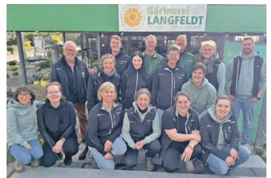
Das Team der Gärtnerei Langfeldt, die zum schönsten Gärtnereibetrieb gewählt worden ist.

Ein besonderer Grund zur Freude: Bei der Leserabstimmung der Kieler Nachrichten wurden wir zum schönsten Gärtnereibetrieb in Kiel und Umgebung gewählt. Dieses Vertrauen und diese Wertschätzung unserer Kundinnen und Kunden bedeuten uns sehr viel – und sind für uns zugleich Ansporn, Ihnen weiterhin höchste Qualität,