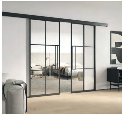
Gläserne Schiebetüren lassen Räume größer wirken und schaffen ein großzügiges Ambiente.