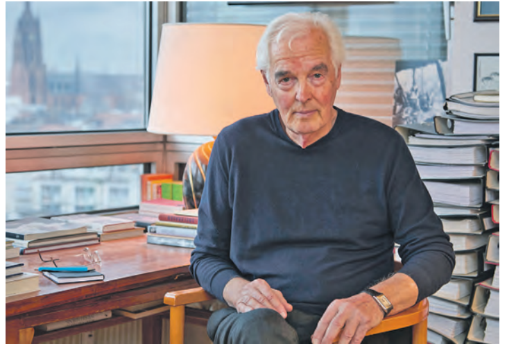
Bodo Kirchhoff liest am 19. April in Hohwacht aus dem Roman „Nahaufnahmen einer Frau, die sich entfernt“.

entfernt“. Das Buch erschien im Januar bei dtv. In seinem Roman beleuchtet er das Thema Entfremdung in einer Ehe, zeichnet einen radikalen Neuanfang im Alter, analysiert Nähe und Distanz und sorgt mit Hilfe eines Perspektivwechsels dafür, dass der fiktive Ehemann die Möglichkeit Empathie zu entwickeln erhält. So lässt er ihn die Geschehnisse aus dem