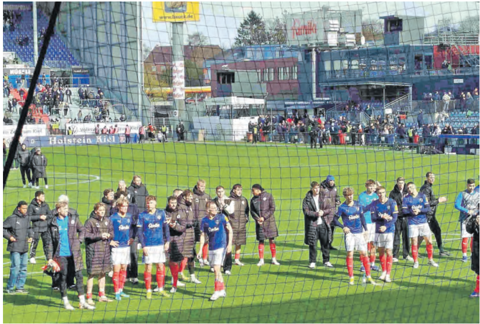
Verhaltener Jubel beim Kieler 0:0 gegen Münster.