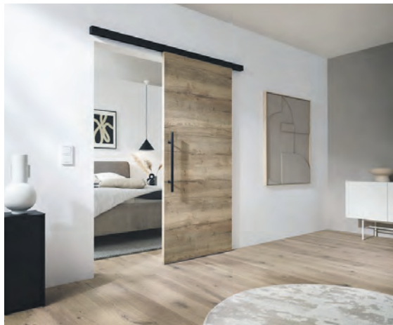
Schiebtüren nehmen nur wenig Platz in Anspruch und schaffen barrierefreie Durchgänge.

Hinter dem leisen Gleiten steckt ein technisches Prinzip: Im Gegensatz zu Standardtüren, deren Gewicht einseitig an Scharnieren hängt, wird die Last bei Schiebetüren ober- oder unterhalb über Schienensysteme aufgenommen. Das ermöglicht selbst bei groß dimensionierten und schweren Türflügeln eine dauerhaft stabile Führung und ein leichtes Öffnen. „Für zusätzlichen Komfort im Alltag sorgt ein optionaler Softclose-Beschlag. Diese Technik bremst den Türflügel beim Erreichen der Endposition sanft ab und verhindert so ein unkontrolliertes Anschlagen“, erläutert Marcus Braunshausen