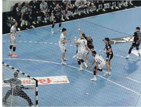
Auch gegen das Team vom HSV Hamburg wird ein Kampfspiel erwartet.

Trainer Filip Jicha steht trotz der kürzlichen Vertragsverlängerung bei den Anhängern in der Kritik. „Es sei einfach zu viel Mittelmaß im Kader der Zebras“, „die guten Handballer kommen