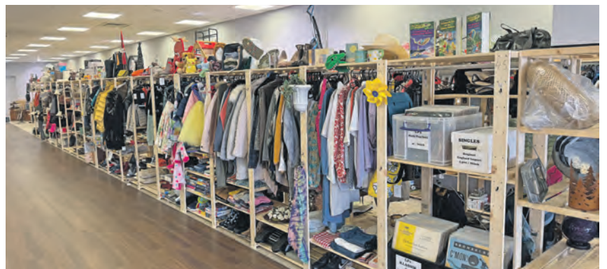
Eine neue Idee erobert Raisdorf: Mietregale für den Flohmarkt.

sein Regal, danach kann man seine Produkte online anlegen und mit Preisen versehen. Vor Ort werden die Etiketten ausgedruckt. Kleiderbügel und weitere Ausstattung werden vor Ort kostenfrei zur Verfügung gestellt. Das Höppis-Team kümmert sich um den professionellen Verkauf der Waren, und über das persönliche Kundenkonto hat man jederzeit live seine Verkäufe im Blick.