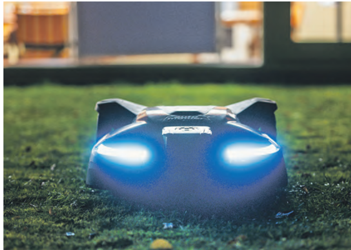
Um Tiere zu schützen, appelliert der Kreis Plön, Mähroboter nachts nicht in Betrieb zu nehmen.