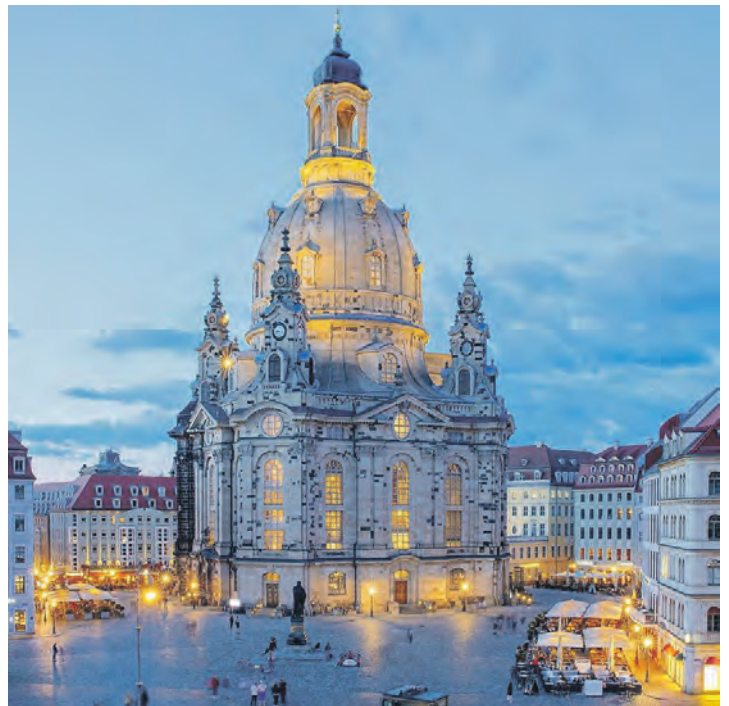
Einer der Höhepunkte des Programmes: der Besuch in der Frauenkirche Dresden inklusive Orgel-Konzert.