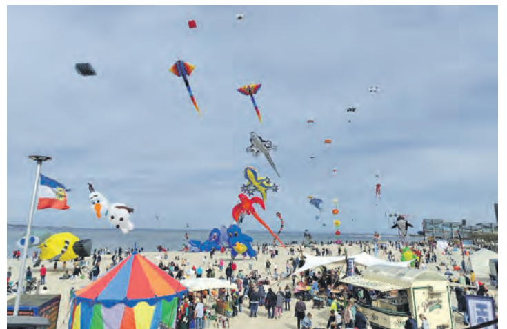
Am Strand von Laboe fliegen am 11. und 12. April die Drachen.

Die Veranstaltung ist am Sonnabend, 11. April auf die Zeit von 11 bis 21 Uhr begrenzt, am Sonntag, 12. April auf den Zeitraum 11 bis 16 Uhr.