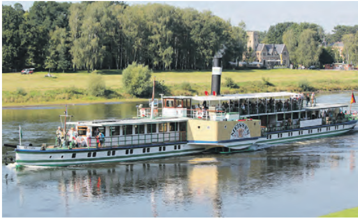
Auf schönster Strecke kreuzen die Reporter-Gäste auf der Elbe durch das Elbsandsteingebirge „unter Volldampf“.

Ausflug ins weltberühmte Elbsandsteingebirge mit Pillnitz und Bastei, eine herrliche Elbe-Kreuzfahrt auf schönster Strecke sowie ein großer Erlebnistag in Dresden mit Stadtrundfahrt/Stadtführung, Kirchenführung Frauenkirche und viel Freizeit zum individuellen Entdecken des Elb-Florenz. Zum großen Leistungspaket der Sonderreise gehören neben der Fahrt im erstklassigen Fernreisebus ab Kiel, Schwentinal und Preetz drei Übernachtungen im Komfort-Hotel in Meissen mit reichhaltigem Frühstück vom Buffet sowie drei Abendessen im Hotel als leckere Schlemmerbuffets oder Drei-Gang-Menüs sowie