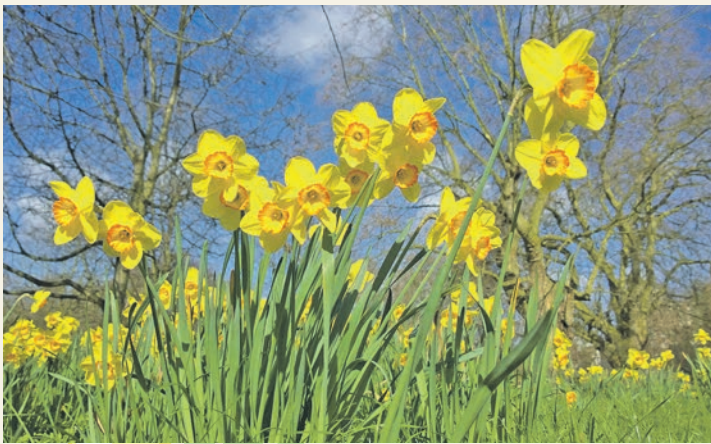
Mit ihren leuchtenden Blüten stehen Osterglocken für neues Leben und Hoffnung, die zentrale Botschaft des Osterfestes.

Hans Becker (Christliche Gemeinde Barsbek)