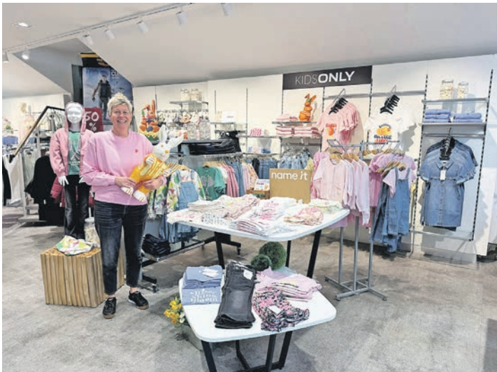
Premiere bei Mews: Anlässlich des Starts in die Frühjahr- und Sommersaison öffnet das Modehaus erstmals am Ostermontag seine Türen.

te Frühlingstage. Kundinnen und Kunden können sich in ruhiger Atmosphäre inspirieren lassen und ihren neuen Lieblingslook entdecken. Als kleine Osterüberraschung hält das Modehaus zudem ein Geschenk bereit: Ab einem Einkaufswert von 50 Euro gibt es eine blumige Aufmerksamkeit, solange der Vorrat reicht.