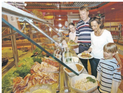
Auch kulinarisch werden die Kurier-Leser an Bord der Märchenschiffe auf dem Hin- und Rückweg rundum verwöhnt

Anmeldungen sind ab sofort im Leser-Reisen-Büro des Burg-Verlages in Eutin unter der Telefon 04521-701130 – täglich von 9 bis 13 Uhr – sowie direkt online auf leserreisen.der-reporter.info möglich.