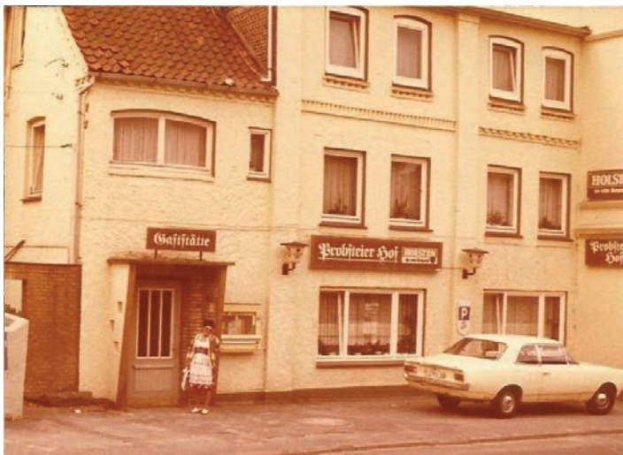
Historisches Bild vom Probsteier Hof, dem Gründungslokal des Vereins.

Einfach bestellen: Tel. 04348-919 629 7 www.meyer-menue.de