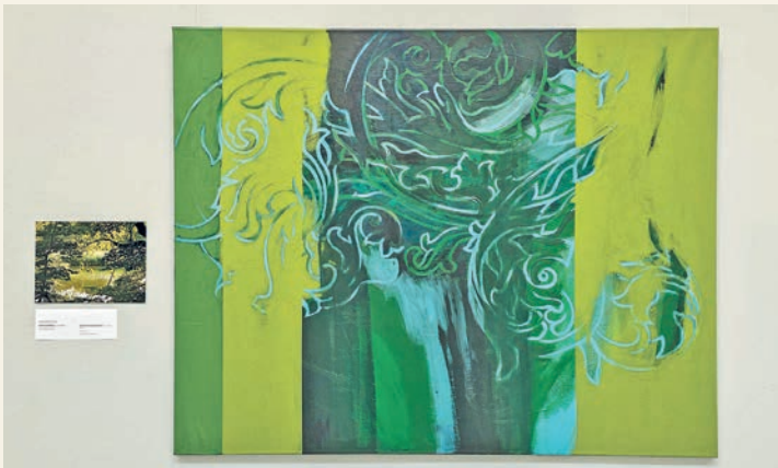
„Spätsommer“, so der Titel dieses Kunstwerks von Roswitha Steinkopf.

schlossen. Weitere Informationen zu Öffnungszeiten, Ausstellungen und Veranstaltungen sind zu finden unter www.kuenstlermuseumheikendorf.de