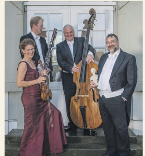
Wagners Salonquartett spielt Ostersonntag schwungvolle Musik im alten Herrenhaus zu Probsteierhagen.

1996 und hat in einer Vielzahl von Konzerten sein Publikum begeistert. Das Repertoire umfasst mehr als 350 Stücke, von Opern- und Operettenmelodien, Walzer der Strauß-Ära über Csardas, Tango, Foxtrott bis zum UFA-Filmschlager und wird ständig erweitert.