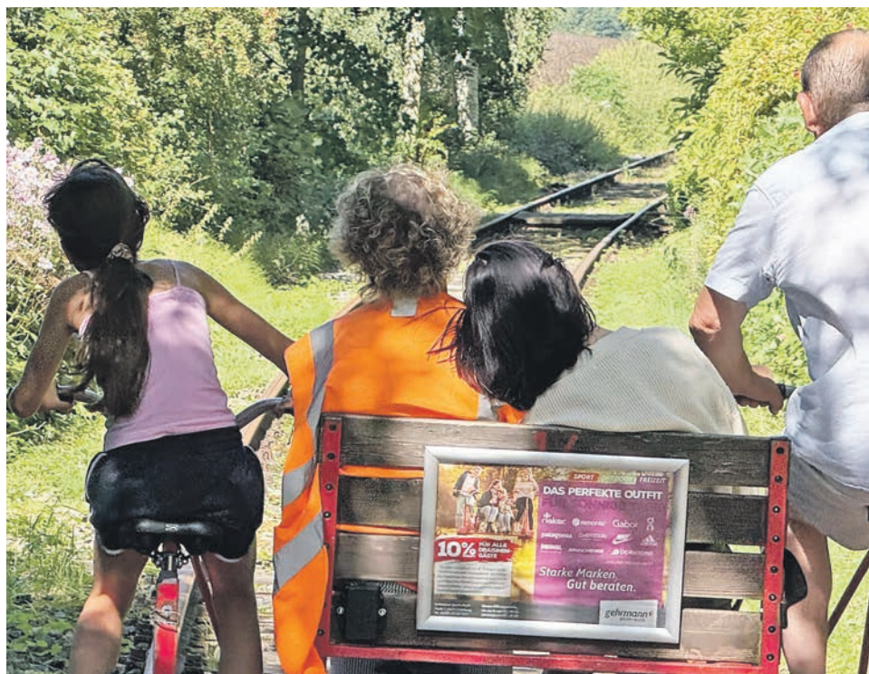
Mit der Draisine durch die Holsteinische Schweiz.