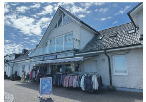
Die „Ostseebrise“ am Schönberger Strand hat ab sofort wieder täglich geöffnet.

wie vor der maritime Stil von Zwillingsherz mit den „Moin“ Hoodies und Sweats in vielen Farben und Variationen. Zu Ostern ab Samstag, 4. April, hat die „Ostseebrise“ zur Saison-Wiederöffnung viele interessante Angebote. Die Filiale an der Seebrücke ist ab sofort täglich von 13 bis 17 Uhr geöffnet. Das gesamte Team im Modehaus freut sich auf viele Besuchern an Ostern.