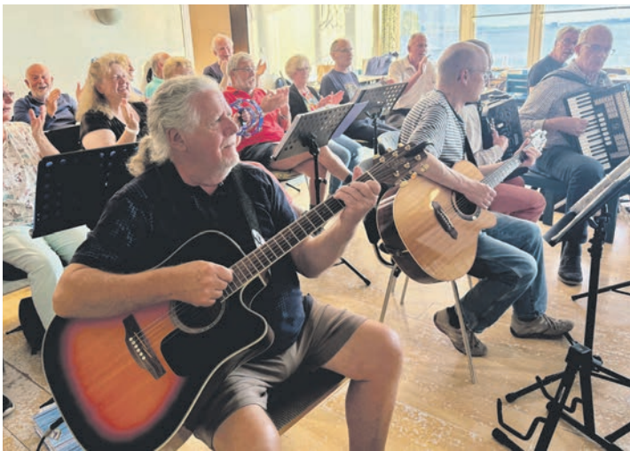
Gitarre und Akkordeon sind bei den Shantychorproben immer dabei.