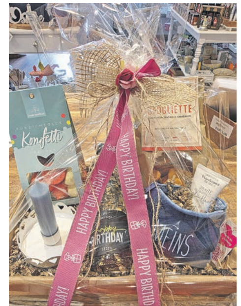
Ein Geburtstagskörbchen, liebevoll verpackt.