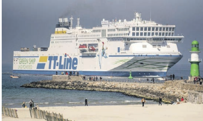
Unterwegs mit den Jumbo-Linern der TT-Line zum großen Jubiläum Kurs Schweden.

Die Einschiffung von Bus und Fahrgästen erfolgt in Travemünde auf Entdecker-Kurs Nord. An Bord werden die Probsteer-Leser mit schwedischen Schlemmer-Spezialitäten preisinklusive rundum verwöhnt. Sie genießen die komfortable Überfahrt auf dem Jumbo-Liner mit kostenloser Benutzung der herrlichen Sonnendecks zum Entspannen. In Malmö erwartet die Gäste sodann ein internationales First-Class-Top-Hotel in der südschwedischen Hafenmetropole mit modernsten Komfortzimmern und dem leckeren Frühstück vom Buffet für zwei Nächte. Am zweiten Tag ist eine große Stadtrundfahrt mit fachkundiger, deutschsprachiger Reiseleitung zu den Höhepunkten Malmös, eine der schönsten Städte Schwedens in malerischer Lage am Öresund, extra zu buchen für nur 19,90 Euro.