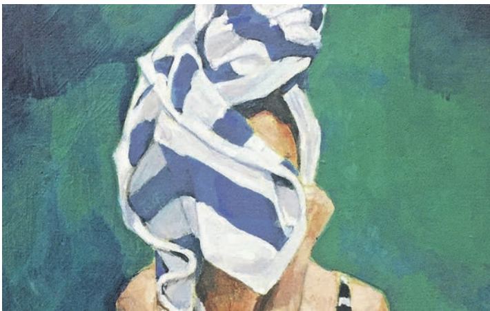
Ausschnitt aus dem Einband des Romans „Paradise Beach“.

der Begegnung mit Elja, die Adas Welt ins Wanken bringt. Doch mitten in diesem Jahrhundertsommer 2003 beginnt ein Schmerz, und mit ihm das Schweigen, das Ada zunehmend von ihrer Au-