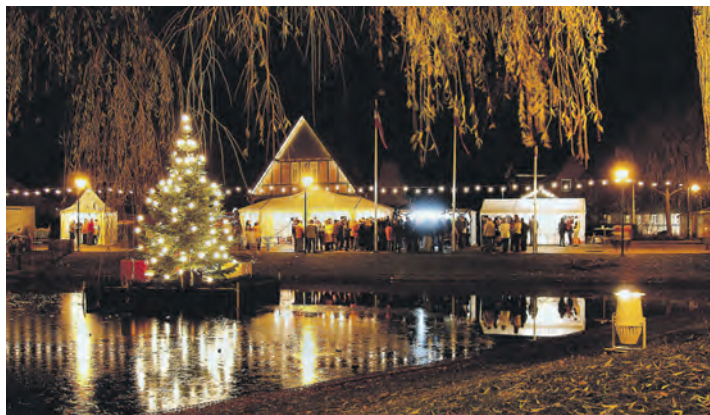
Weihnachtliche Stimmung rund um den Dorfteich von Schönkirchen.

Die aktuelle Ausgabe jeden Mittwoch auch im Internet. www.probsteer.de