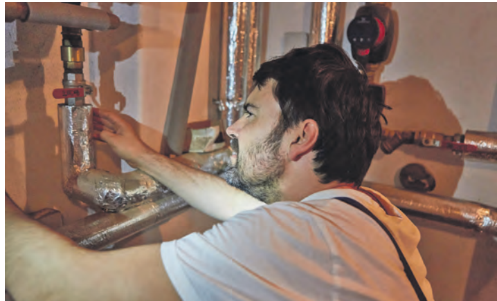
Heizungsrohre und Warmwasserleitungen lassen sich mit vorgefertigten Dämmschalen aus Mineralwolle schnell und einfach selbst isolieren – ideal für alle mit etwas handwerklicher Erfahrung.

Wer handwerklich etwas Erfahrung mitbringt, kann Heizungsrohre oder Warmwasserleitungen in unbeheizten Räumen mit vorgefertigten Dämmschalen aus Mineralwolle selbst isolieren – eine Arbeit, die in kurzer Zeit erledigt ist und sich meist schon nach einer Heizperiode auszahlt. Auch die Dämmung der Kellerdecke zählt zu den einfach realisierbaren Projekten. Dabei werden Dämmplatten von unten direkt gegen die Decke montiert. So verringern sich Wärmeverluste zwischen Keller und Erdgeschoss. Das Ergebnis sind spürbar wärmere Böden und ein geringerer Energiebedarf. Noch effizienter ist die nachträgliche Dämmung der obersten Geschossdecke mit Mineralwolle, die sich ebenfalls mit vergleichsweise wenig Aufwand in Eigenleistung erledigen lässt. Wird der Dachboden nicht beheizt und ist unbewohnt, genügen lose verlegte Dämmplatten oder -matten aus