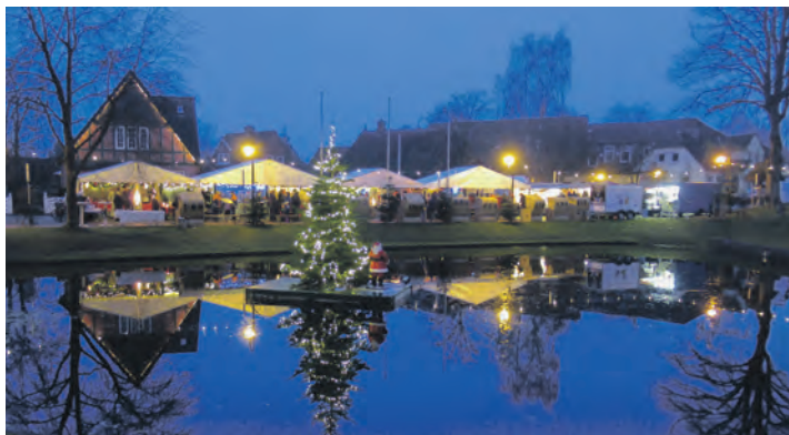
Auch die Vereine der Gemeinde Schönkirchen beteiligen sich mit zahlreichen Ständen.

teich schließt auch Hörn Huus, Schmidthaus, Gildehaus und Dorfteichcafé ein. Zu den kulinarischen Akteuren zählt das Kinderhilfswerk Schönkirchen, das Kartoffelpuffer und Räucherlachs, Schönkirchner Burger und Wintercocktails anbietet. Punsch und Schmalzbrot gibt es beim Kultur- und Landschaftspflegeverein. Die Alten Herren von der TSG Schönkirchen und die