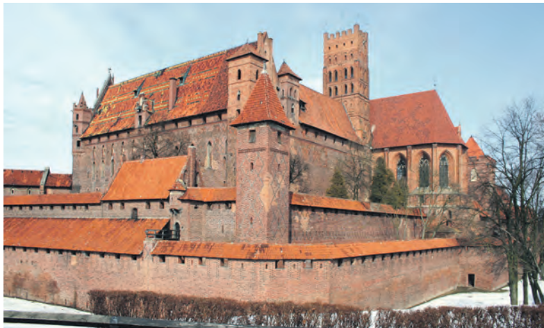
Die Marienburg des deutschen Ordens in Marburg bei Danzig.

Im späten Mittelalter entstanden unter der Herrschaft des Deutschen Ordens in Preu-