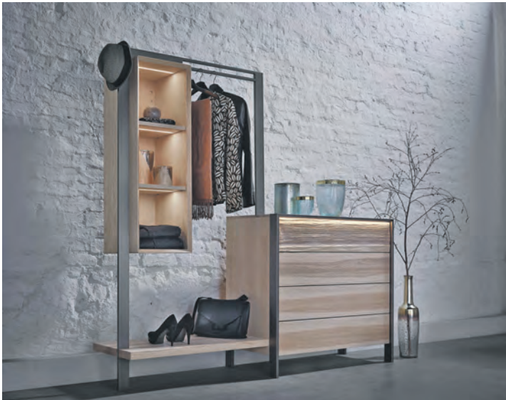
Dekorative Elemente sorgen für eine einladende Atmosphäre rund um die Massivholz-Garderobe.

der Schuhe und bietet zusätzlichen Stauraum. Persönliche Akzente wie Bilder, Pflanzen oder dekorative Accessoires machen den Flur einladend und spiegeln den eigenen Stil wider. Eine schöne Fußmatte sorgt für einen freundlichen Empfang und hält Schmutz draußen.