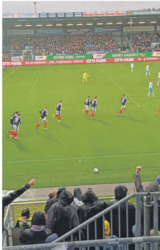
Störche wollen gegen Hertha endlich wieder jubeln.

seine Geburtsstadt. An den letzten Auftritt haben die Holstein-Anhänger keine guten Erinnerungen. Mit seinem Elfmetertreffer sorgte er für den Auswärtssieg der Berliner. Sollten sich die Störche nicht enorm formverbessert zei-