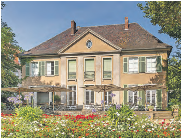
Die berühmte Liebermann-Villa am Wannsee entdecken die Probsteer-Leser mit einer Sonderführung.

oder direkt online auf leserreisen.der-reporter.info möglich.