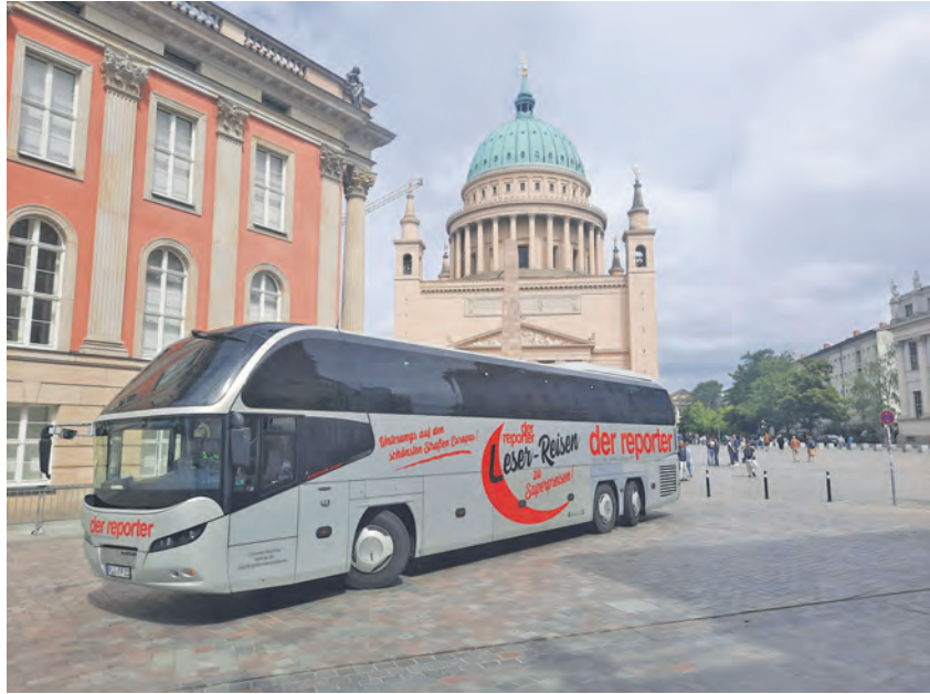
Welt-Kunst vom Feinsten erwartet die Gäste in Potsdam und Berlin am 7. und 8. März 2026.

Residieren werden die Gäste im internationalen First-Class-Hotel mit großzügigem Schlemmerfrühstück vom Buffet in der