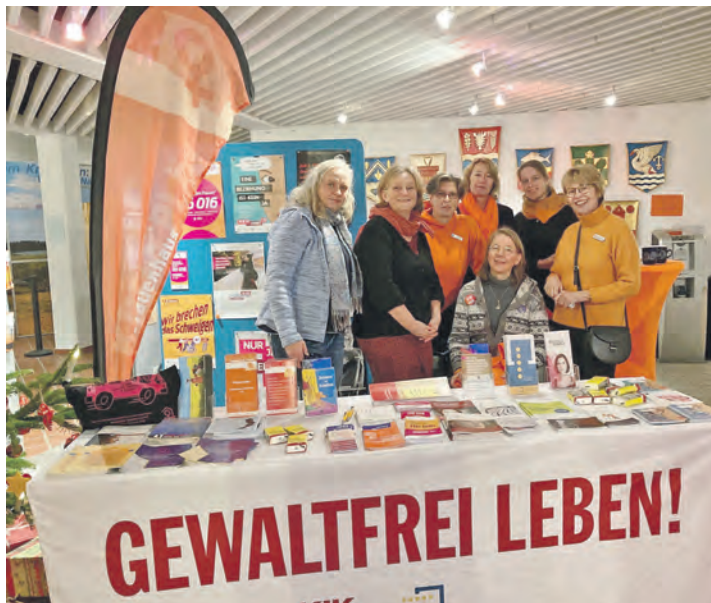
Die Gleichstellungsbeauftragten aus dem Kreis Plön sind auch wieder mit einem Infostand bei der Abschlussveranstaltung dabei.

Im Foyer des Kreishauses präsentieren sich die Mitglieder des Frauenpolitischen Beirates, Die Arbeitsgemeinschaft der Gleichstellungsbeauftragten im Kreis Plön, der Weisse Ring und die Jungen Landfrauen mit Informationsmaterial, um mit den Besuchern ins Gespräch zu kommen. Die Landfrauen servieren darüber hinaus Punsch. Die Organisatorinnen bitten alle Interessierten, sich per E-Mail an anmeldung@fpb-event.de für den Vortragsabend anzumelden.