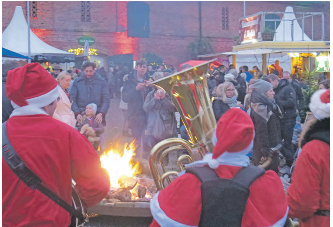
Für stimmungsvolle Momente auf dem Adventsmarkt von Gut Görtz sorgen auch die musizierenden Nikoläuse.

Weihnachtliches Singen, Posauern. Basteln und weitere Aktivitäten für Kinder schaffen eine