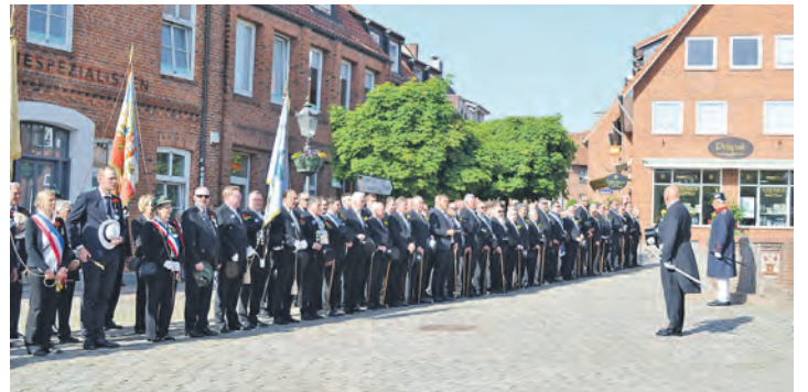
Kaiserwetter und eine große Delegation angetretener Gildebrüder sorgten für einen wunderbaren Festtag.

nur, dass unsere Kinder Dich zum Opa haben“. Ein langhaltender Applaus schloss sich an. Alsdann war es Zeit, die Lade hereintragen zu lassen, neue Rekruten zu verpflichten und die vom vergangenen Jahr als Gildebrüder zu begrüßen. Danach wurden zahlreiche Gildebrüder für lange Mitgliedschaften geehrt, nicht alle waren anwesend. Der nächste Höhepunkt des Gildefestes folgte mit der Verleihung des Otto Maack Gedächtnispokales, stellvertretend für Zusammenhalt und Engagement. Dieser kann nur verliehen werden, wenn der engere Vorstand eine einstimmige Entscheidung trifft, sollte es nicht dazu kommen, würde die Verleihung ausgesetzt werden. Verliehen wurde er an einen Gilde-