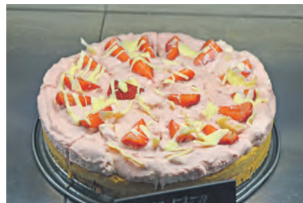
Nach wie vor gibt es hausgemachte Torten und Kuchen, wie zum Beispiel auch saisonale Köstlichkeiten wie diese leckere Erdbeertorte.

Um 18.30 Uhr findet die Königsproklamation statt. Ein Fest, das man nicht verpassen sollte, bei der Totengilde Blekendorf von 1731, Achternbeek in Blekendorf.