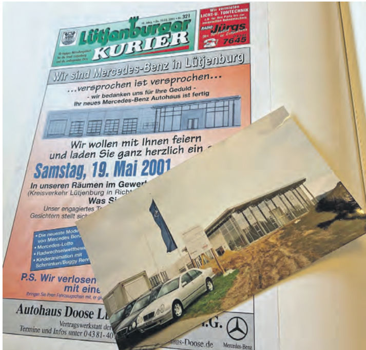
Die Anfänge: der Lütjenburger Kurier kündigte damals auf der Titelseite die Eröffnung des Mercedes Autohauses an, das Foto zeigt das gerade fertiggestellte Gebäude.

ist ein Mann, der von Beginn an im Team gearbeitet hat und heute noch dabei ist. Offiziell genießt er zwar seinen Ruhestand, aber ganz ohne „sein Mercedes Autohaus“ geht es halt nicht: saisonal ist er zuständig für die Einlagerung von blitzsauberen Reifen im Frühjahr und Herbst, die er zuvor noch sorgfältig auf mögliche Schäden überprüft. Aber auch viele Kund:innen halten Autohaus Doose seit der Eröffnung kontinuierlich die Treue, was für das hohe Qualitätsniveau, gute Betreuung und Service spricht, schließlich erhält das Haus schon seit vielen Jahren hintereinander das Prädikat „Service mit Stern“. Es gibt sogar eine Kundin, die in Paris lebt und jedes Jahr ihren Urlaub an der Ostseeküste mit einem Besuch bei Doose verbindet, um den erforderlichen Service am PKW vornehmen zu lassen. Auf die Frage der Redaktion, ob sie sich an besondere Erlebnisse erinnern würde, die in Erinnerung