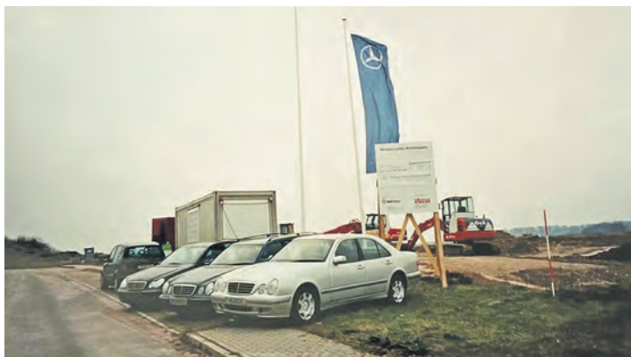
Nicole Tronnier öffnet das 25 Jahre alte Fotoalbum: auf den ersten Seiten sieht man die Anfänge, noch ist nur sehr schwer zu erahnen, was hier entstehen soll.