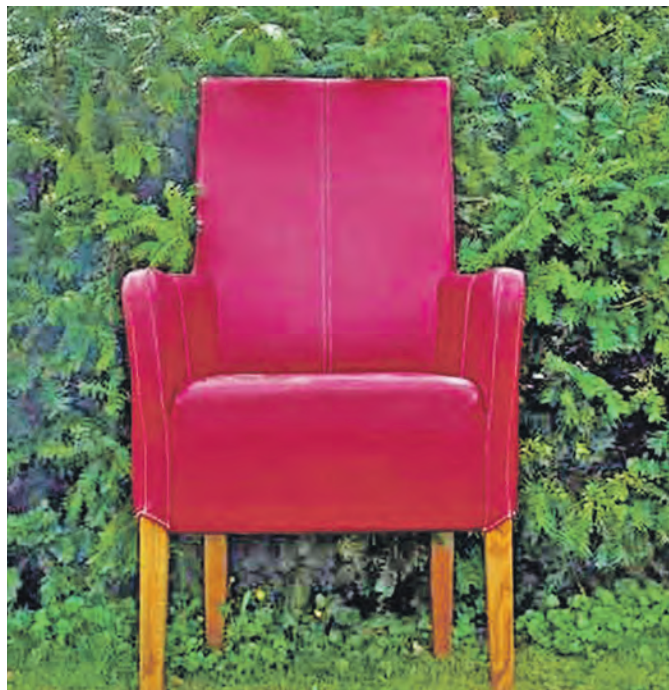
Ein roter Stuhl, Sofa oder Sessel macht leicht erkennbar, welches Atelier geöffnet hat.