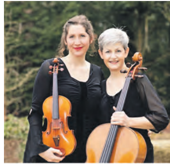
Duo Movimento.

lische Reise ohne Grenzen: von Händels zartem „Ombra mai fu“ über Vivaldis tosenden Sturm, von der Stille der Bach'schen Aria bis zum Funkenregen der „Flambée Montalbanaise“. Dazwischen eigene Kompositionen Le Boulaire, die Freude, Aufbruch und das Geheimnis des Lebens in Töne fassen – und zum Schluss gleitet Saint-Saëns' Schwan still und majestätisch in die Nacht. Wo Funken tanzen, entsteht Wärme. Wo Musik keine Grenzen kennt, entsteht