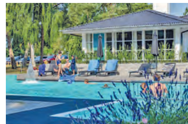
Traumhafte Hotel-Anlage mit großem Pool direkt am Meer