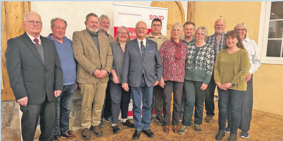
Der Gesamtvorstand des SoVD Ortsverband Giekau mit allen gewählten Mitgliedern.

wurden die Mitglieder des alten Vorstandes für die nächsten 2 Jahre in ihren Positionen bestätigt. Einige wenige personelle Veränderungen gab es nur im Bereich der Revisoren