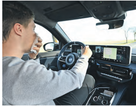
Allergien können sich auf die Fahrtüchtigkeit auswirken. Typische Symptome beeinträchtigen die Wahrnehmung im Straßenverkehr unmittlbar.

Konzentrationschwierigkeiten einher. Die Folgen ähneln den bekannten Risiken durch Übermüdung am Steuer: verlängerte Reaktionszeiten, nachlassende Aufmerksamkeit und eine erhöhte Fehleranfälligkeit. Einen weiteren Risikofaktor stellen Medikamente gegen Allergiebeschwerden dar. Vor allem Antihistaminika älterer Generation können müde machen und das Reaktionsvermögen deutlich reduzieren. Aber auch moderne Präparate wirken bei jedem Menschen anders. Besonders zu Beginn der Einnahme oder bei einem Wechsel des Medikaments sollte deshalb mit möglichen Auswirkungen auf die Fahrtüchtigkeit gerechnet werden – vorzugsweise sollte das Medikament am Abend vor dem Schlafengehen eingenommen werden. „Autofahrer unterschätzen häufig, dass bereits leichte gesundheit-