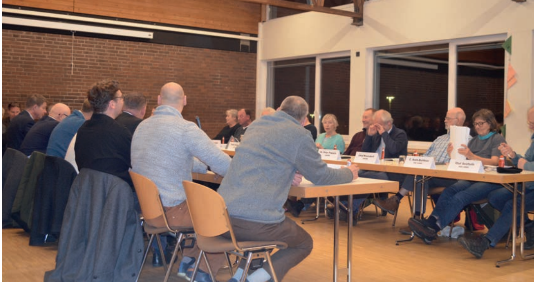
Die Stadtvertreter:innen waren zahlreich zur letzten Sitzung im Jahr 2025 erschienen.