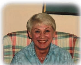
Immer in unserem Herzen

Getragen von euren lieben Worten, Erzählungen, Umarmungen und all den liebevollen Anteilbekundungen möchten wir von Herzen DANKE sagen!