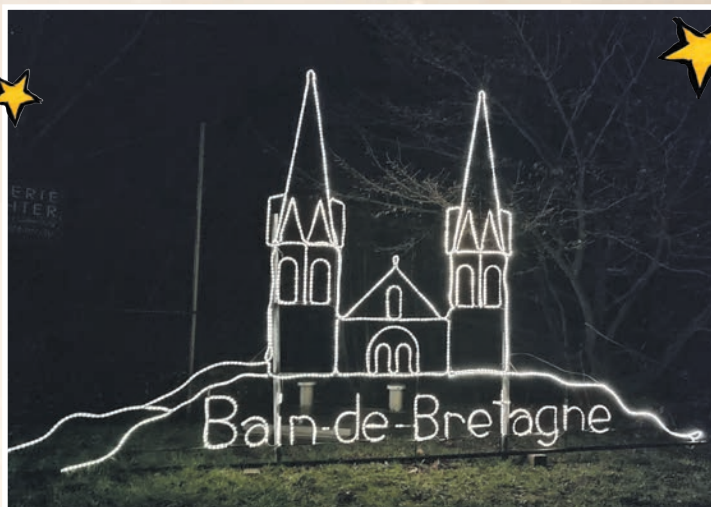
Zur Weihnachtszeit findet man an den Ortseingängen in Lütjenburg wunderbar illuminierte Darstellungen der Partnerstädte.

Todesfall zu beklagen gab, wird eine weiße Tischdecke aufgelegt und ein zusätzliches Besteck eingedeckt, um an den Verstorbenen zu erinnern. Weihnachten heißt auf Polnisch „Wigilia“. Auch hier beginnt der Heiligabend mit einem Festessen, in Regel zwölf Gerichte, dieser Brauch geht auf die 12 Apostel Jesu zurück. Mit dem Essen wartet man, bis der