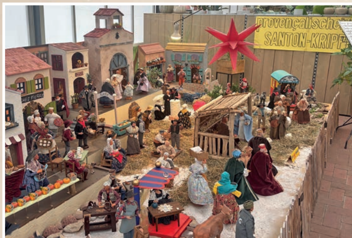
Die Weihnachtskrippe Santos, die auch in diesem Jahr in der Gärtnerei Langfeldt in Lütjenburg zu bewundern war.

Aus aller Welt (cm). Sowohl Lütjenburg als auch Oldenburg in Holstein haben eine Partnerstadt in Frankreich. Für Lütjenburg besteht die Partnerschaft mit Bain-de-Bretagne und in Oldenburg in Holstein mit der Stadt Blain. Dies möchten wir einmal zum Anlass nehmen, über die Grenzen zu schauen, um zu sehen, wie bei den Freunden im Ausland Weihnachten gefeiert wird. In Frankreich ist das Weihnachtsfest reich an Ritualen und Zeremonien, jede Region bringt eigene Akzente in die schönste Zeit des Jahres ein. Ähnlich wie bei uns beginnen die Vorbereitungen bereits Wochen vor dem