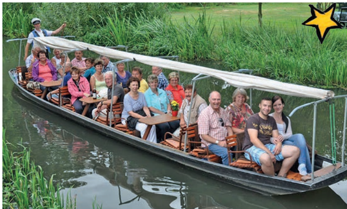
Unterwegs im Spreewald mit dem stakenden Führmann sind unsere Leser:innen im Sommer 2026.