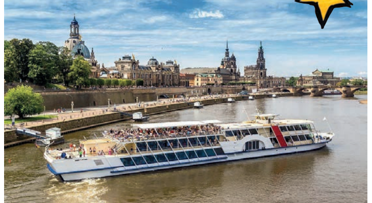
Elbflorenz im Sommerkleid: Das weltberühmte Dresden erkunden unsere Gäste beim großen Tagesausflug mit viel Freizeit.

Programme rundum verwöhnt – bitte vergleichen Sie unsere Leistungen mit dem Wettbewerb! Residieren werden unsere Gäste im großzügigen Komfort-Hotel mit Hallenbad und Sauna mit sehr reichhaltiger Halbpension bei den großen Schlemmer-Bufferets zum Frühstück und Abendessen & zusätzlich All-Inklusiv-Getränken ohne Begrenzung. Zum großen Leistungspaket der Leser-Reise gehören neben der Fahrt im erstklassigen Fernreisebus ab Oldenburg, Lensahn und