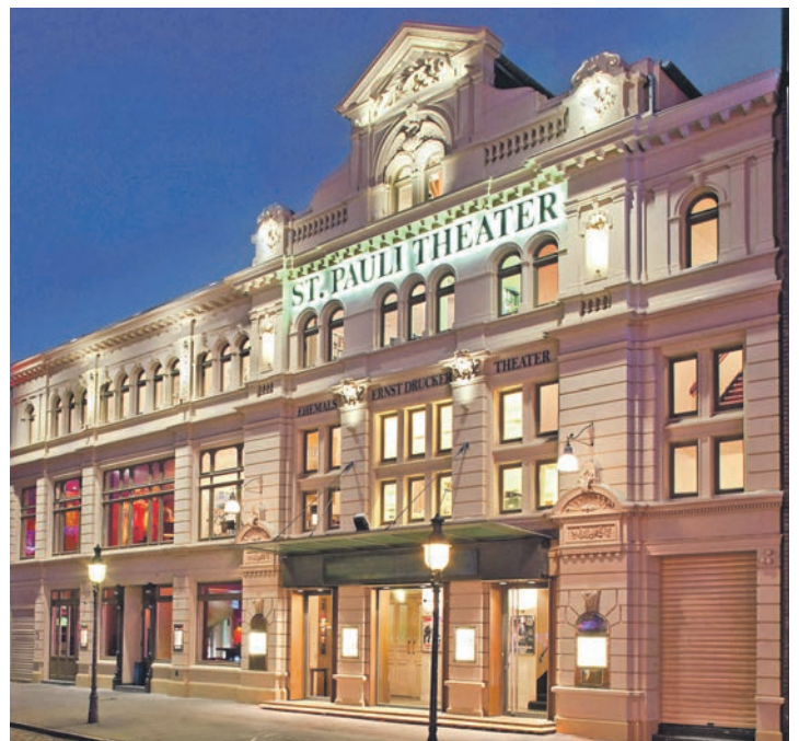
Legendäres Theater direkt auf der Reeperbahn: Das berühmte St. Pauli-Theater in Hamburg neben der Davidswache.

Döhnsdorf (hfr/cm). Am 27. April findet in Döhnsdorf ab 9.00 Uhr wieder der beliebte Hofflohmarkt in allen Straßen statt. Angeboten werden Haushaltswaren, Kleidung für Groß und Klein, Spielzeug, alles rund um Haus und Garten. Im Ortskern wird für das leibliche Wohl gesorgt. Kommt vorbei zum Stöbern, Feilschen und Schnacken.