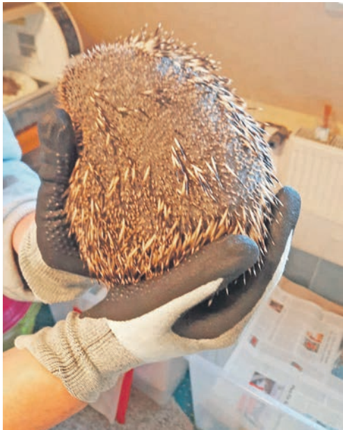
Durch einen Hautpilz leidet dieser Igel an Stachelverlust.

war ja in einem Igelkrankenhaus. Nun musste ich gehen, damit die Rettungsaktion bei Zaubermaus beginnen konnte. Als erster Schritt wurden die Fliegeneier entfernt, von denen sie voll saß. Innerhalb von Stunden schlüpfen Maden,