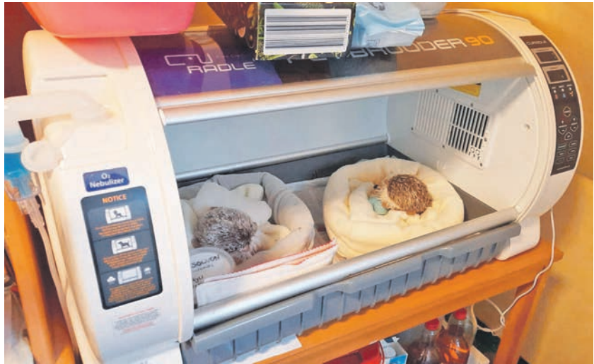
Für die Leichtgewichte gilt es, tüchtig zuzulegen.

Heute betreut die Igelpensionsmutter bis zu 16 Patienten – das war letzten September – und musste schweren Herzens Aufnahmestopps verhängen. Da muss nicht nur der Urlaub sehr gut geplant werden, verriet sie mir mit Augenzwinkern zu ihrem Mann